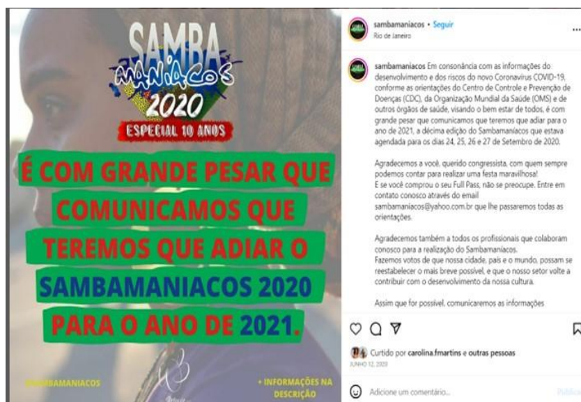
Figura 1 - Comunicado de cancelamento do evento “Samba maníacos” no ano de 2020. 1

Em poucos dias se iniciaram as medidas restritivas para o comércio e para atividades culturais e educacionais, ocorrendo a paralisação dessas atividades em nível nacional. Isso incluiu a suspensão de eventos de grande importância para a dança, como o festival de dança Joinville, bem como eventos específicos de dança de salão, como o Samba Maníacos, que reúne participantes de todo o Brasil e ocorre no Rio de Janeiro. Além disso, também foram proibidos eventos locais, como os concertos da orquestra sinfônica e as atividades no Cine Ouro. Esses efeitos podem ser observados nas imagens de contas oficiais desses eventos e nas notícias veiculadas no site da prefeitura de Goiânia, apresentados abaixo. A Figura 1 mostra a nota de cancelamento do evento “Samba maníacos”. A Figura 2 mostra a nota de cancelamento do Festival de Joinville.