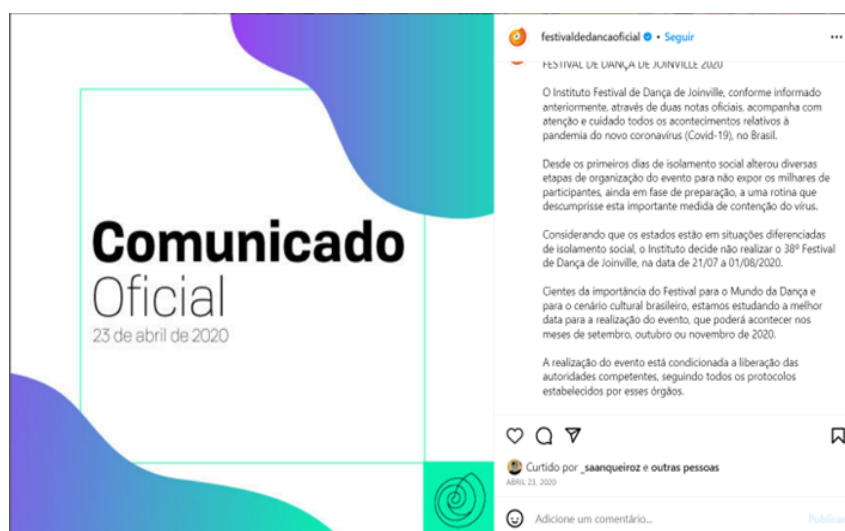
Figura 2 - Comunicado oficial cancelamento do Festival de Joinville no ano de 2020. 2