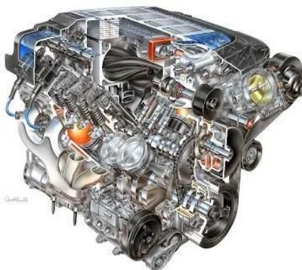
Figura 2: Motor à combustão

As configurações de montagem de um carro elétrico são consideravelmente mais simples do que as de veículos a combustão. Estes últimos exigem uma variedade de peças e lubrificantes, o que os torna mais pesados em comparação aos carros elétricos. Entre esses componentes, destacam-se: um monobloco do motor, que é maior e mais pesado do que um motor elétrico de potência equivalente, além de peças como o motor de partida, sistemas de captação de ar e escapamento, conforme demonstrado na figura 2. Já os carros elétricos possuem motores muito menores e mais leves, não necessitam de sistema de escape e têm caixas de marcha significativamente menores, como mostra a figura 3. Essas características contribuem para a maior eficiência dos carros elétricos, já que, para uma potência similar, é necessária menos energia para movimentar um veículo mais leve (DE SOUSA; CÔRTE-REAL, 2017).