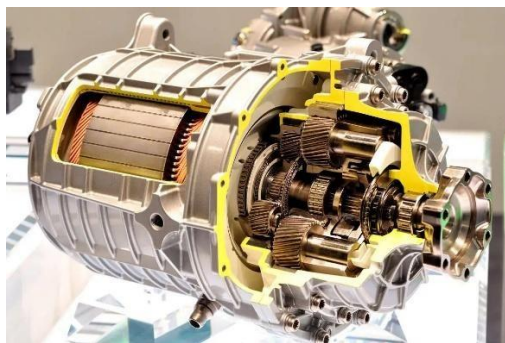
Figura 3: Motor elétrico