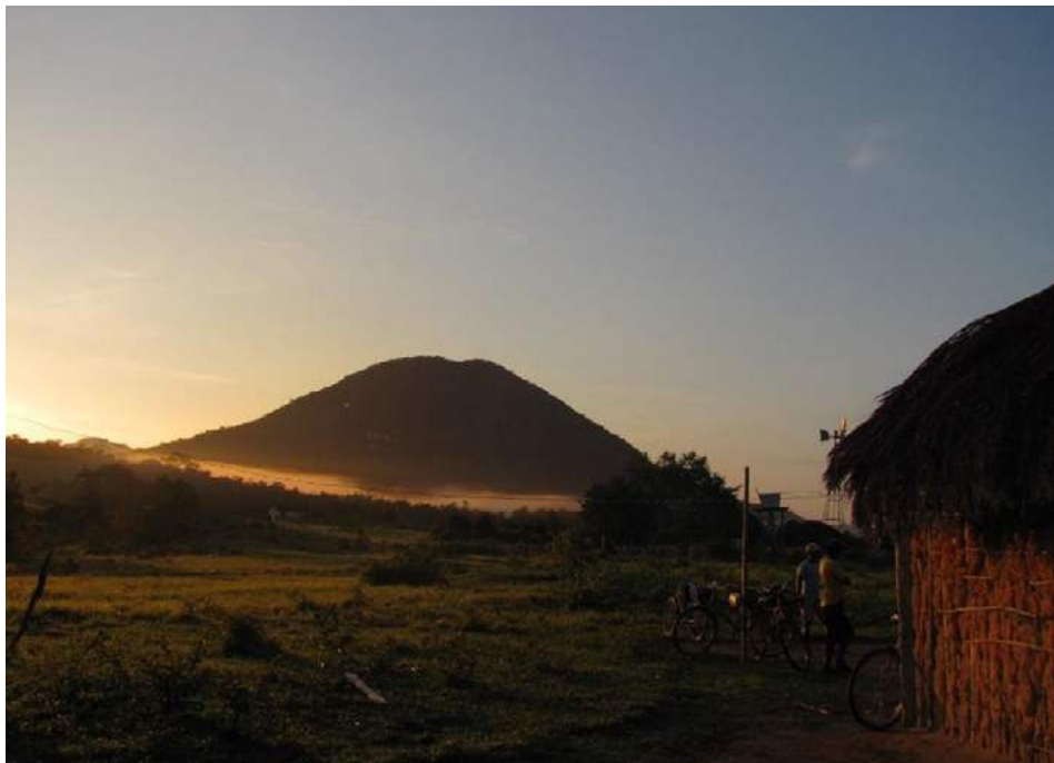
Imagem 1: Serra do Wapum.

As serras são marcadores geográficos e pontos de referência para avaliar distâncias e considerar rotas de viagem. Os moradores dessa região olham para as serras e interpretam as dinâmicas do clima através de suas cores: quando elas estão azuis, é sinal que vem chuva à tarde ou à noite; e quando estão bem verdes, é pouco provável que vá chover. Nelas estão localizadas nascentes de rios e igarapés fundamentais para as comunidades. Elas também são redutos e moradias de diversos animais de caça, como porcos, veados e cotias.