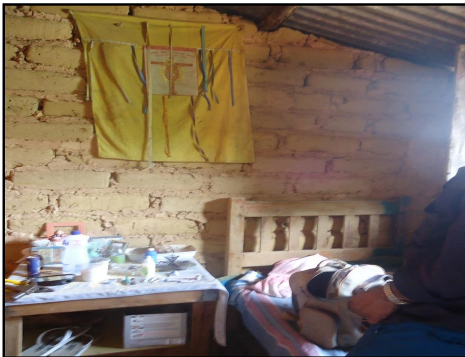
Figura 5. Fotografia do espaço de oração no dormitório, Distrito de Pouso Alto – Goiás.

desaparecimento de tradições como a religiosidade.