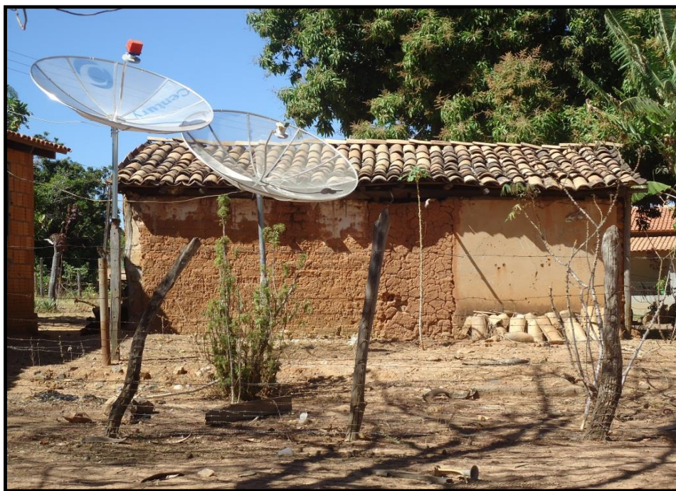
Figura 2. Fotografia de uma casa tipicamente rural com a presença de um elemento moderno – antena parabólica. Distrito de Pouso Alto – Goiás.

A tradicional técnica do enchimento — de adobe — na fabricação das paredes é ainda visível nas paisagens pouso-altenses, conforme ilustra a figura 2: