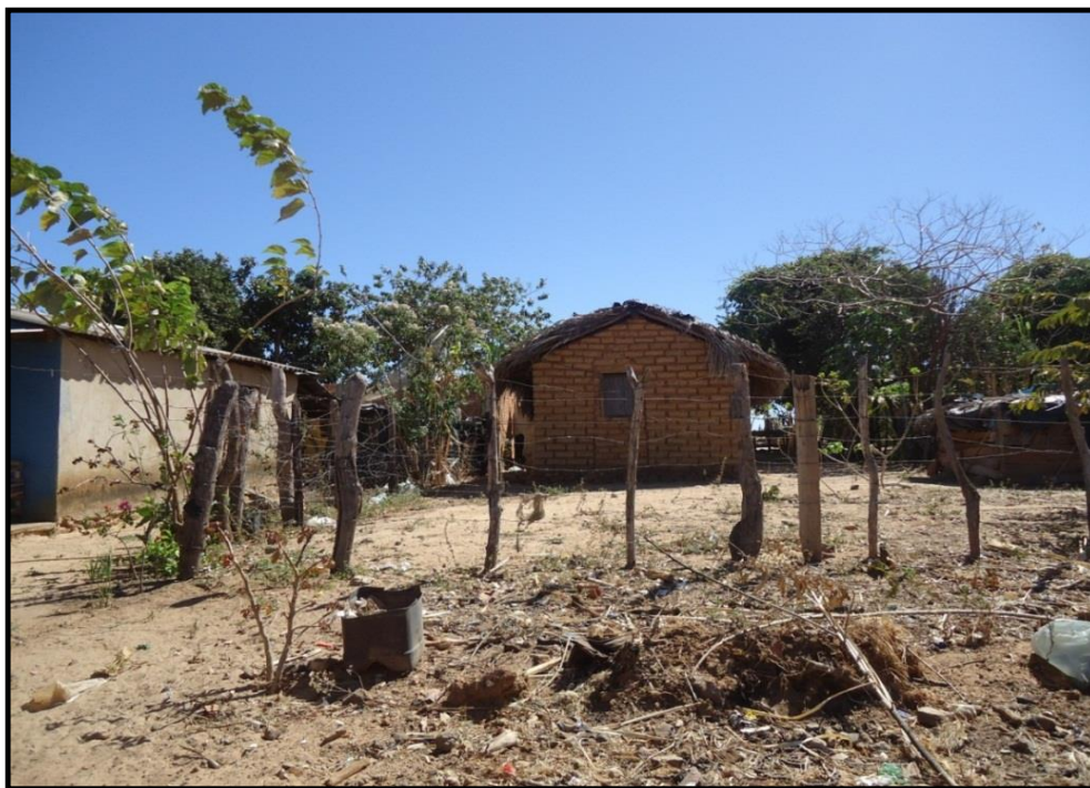
Figura 1. Fotografia de uma casa feita a partir de técnicas vernáculas, construída de adobe e coberta de palha, Distrito de Pouso Alto – Goiás. Fonte: Acervo da autora, 2011.

A técnica vernácula predominante na maioria das construções indica o trabalho de fabricação de objetos sem um planejamento profissional, o que é notável no povoado diante dos materiais e formas das residências (vide figura 1). Segundo Oliveira (2010, p. 21) essa técnica "[...] contempla todas as construções que resultam diretamente da interação entre sociedade, meio ambiente e cultura, na busca do abrigo, e define-se por um processo sem interferência de profissionais da construção, constituindo-se numa tradição".