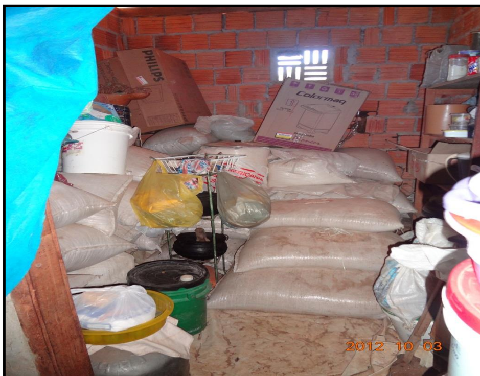
Figura 4. Fotografia da despensa: cômodo destinado ao armazenamento de alimentos, Distrito de Pouso Alto – Goiás.

Geralmente próximo à cozinha, há nas casas pouso-altenses um local destinado à estocagem de produtos cultivados pelos próprios moradores: a despensa. A fotografia 4, retrata o cômodo na casa de um casal de agricultores: