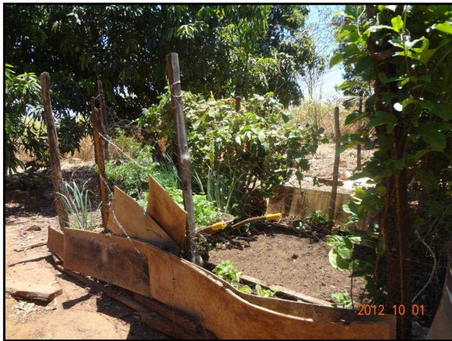
Figura 3. Fotografia do quintal – plantação de hortaliças – de um informante, Distrito de Pouso Alto – Goiás.

Ao longo da pesquisa de mestrado, percebeu-se que o quintal, assim como destacado na fotografia, é ademais, o lugar que liga o morador do povoado com a história camponesa que o constitui.