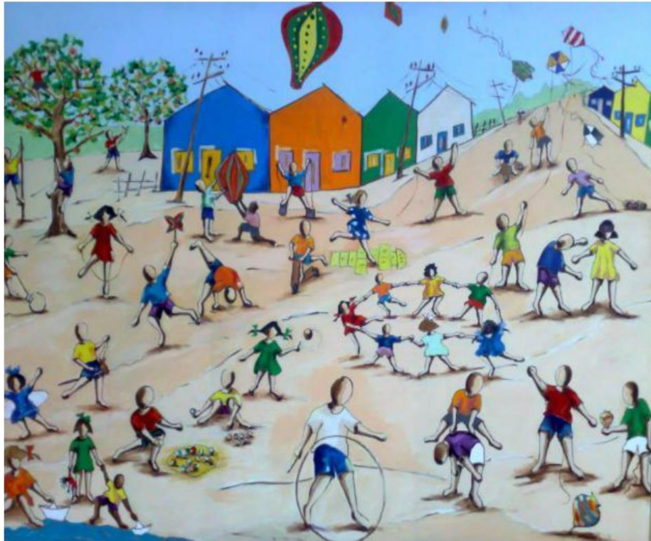
IVAN CRUZ. VÁRIAS BRINCADEIRAS II. DIMENSÃO: 1.30 X 1.70 M, 2006. TÉCNICA: A.S.T.