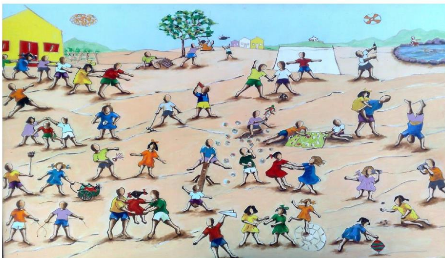
IVAN CRUZ. VÁRIAS BRINCADEIRAS I. DIMENSÃO: 1.30 X 1.70 M, 2006. TÉCNICA: A.S.T.