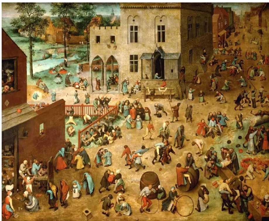
JOGOS INFANTIS (BRUEGEL, 1560)

PARA OBSERVAR MELHOR ESSA IMAGEM, APROXIMANDO EM CADA DETALHE, VEJA PELO RECURSO DO GOOGLE ARTE E CULTURA, NO LINK: HTTPS://ARTSANDCULTURE.GOOGLE.COM/ASSET/CHILDREN%E2%80%99S-GAMES/CQEEZWQPOI2YJG?HL=PT-BR.