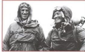
Edmund Hillary e Tenzing Norgay foram os primeiros a chegar ao topo do Everest

para viajar 8 mil quilômetros, mas Thor Heyerdahl acabou provando sua teoria.