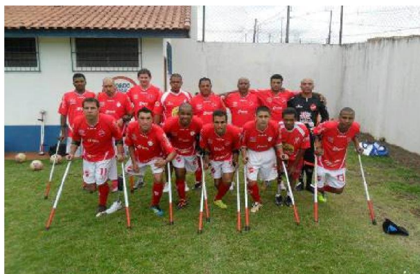
Figura3 local de pratica Futebol de amputados.