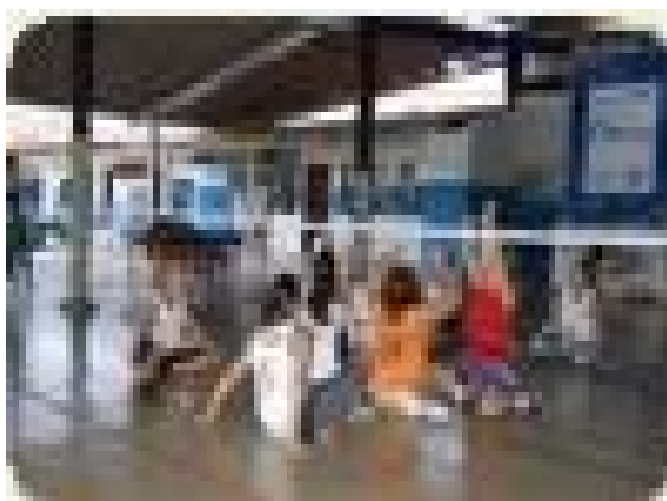
Figura1 local de pratica Vôlei sentado

http://www.adfego.com.br/adfego/esportes