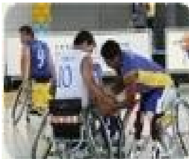
Figura2 local de pratica Basquete em cadeira de rodas.

http://www.adfego.com.br/adfego/esportes