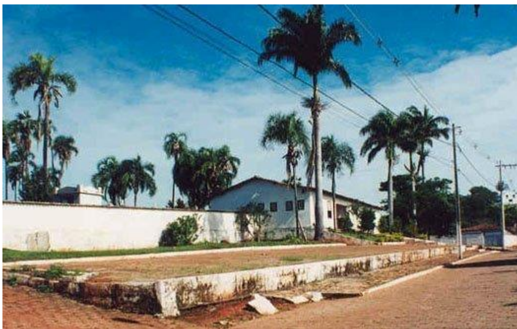
Figura 7 - Cemitério Público de São Miguel Arcanjo

Observa-se elementos do discurso científico no que se refere a “propaganda médica” e, além disso, “sem resistências da população e da elite política” visto que, como presente ainda na A Matutina Meiapontense na correspondência da Rosseira Zellosa era uma preocupação da população em geral.