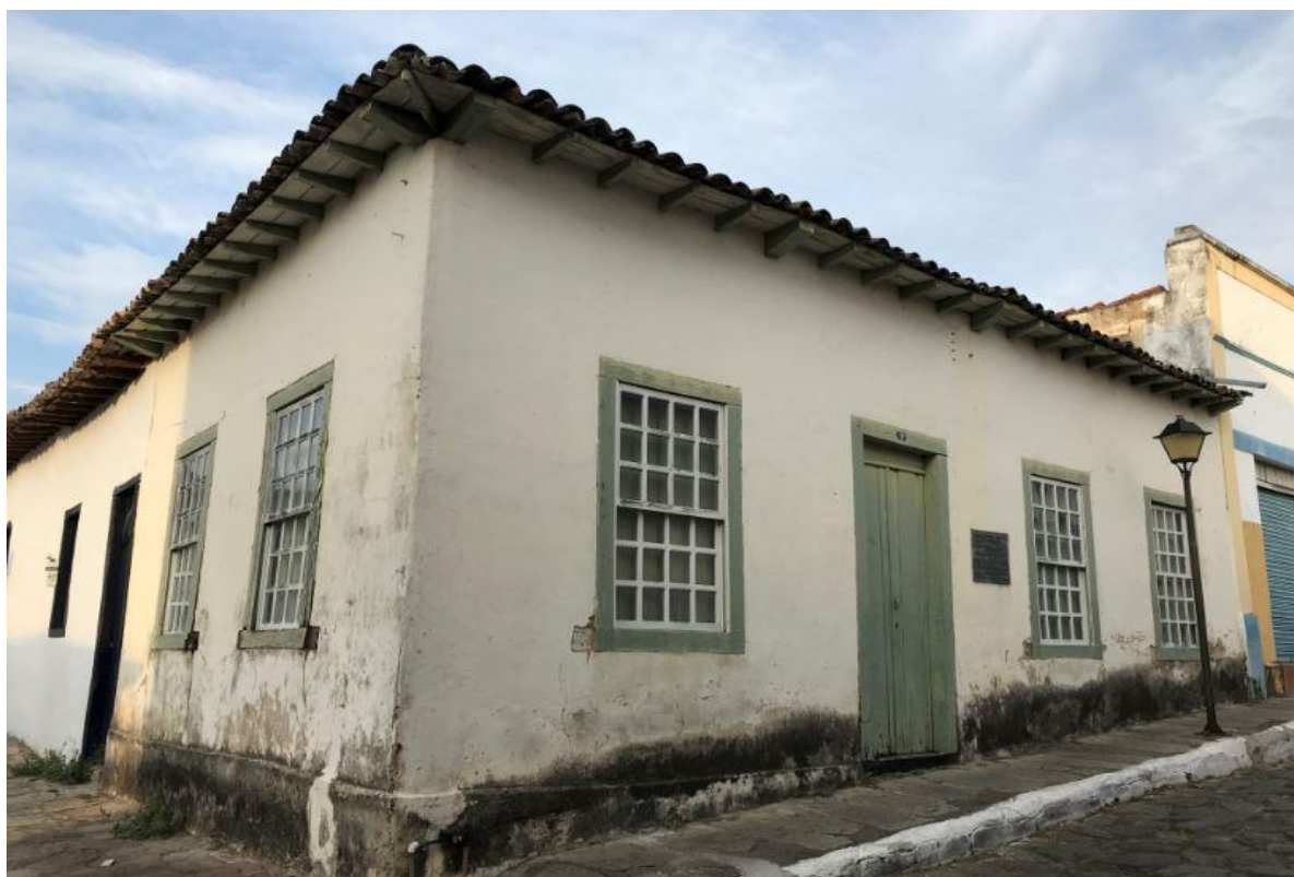
Figura 3 - Prédio do Gabinete Literário Goiano (2018)