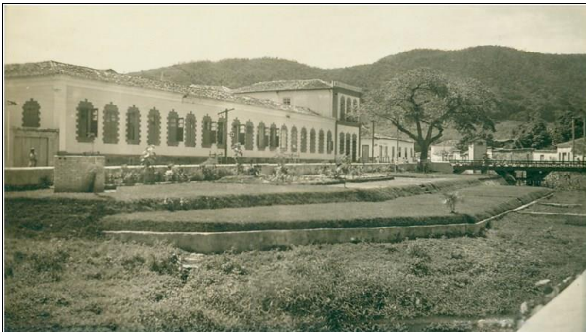
Figura 6 - Hospital de Caridade São Pedro de Alcântara