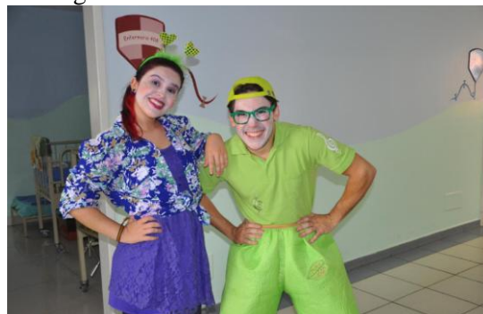
Figura 3 - “Violeta” & “Cravinhos”