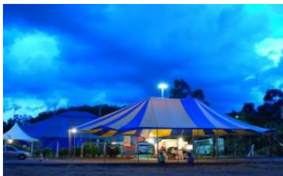
Figura 5 - Tenda do Circo Laheto