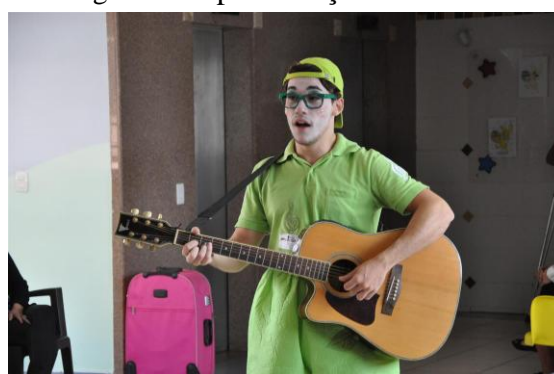
Figura 7 - Apresentação musical