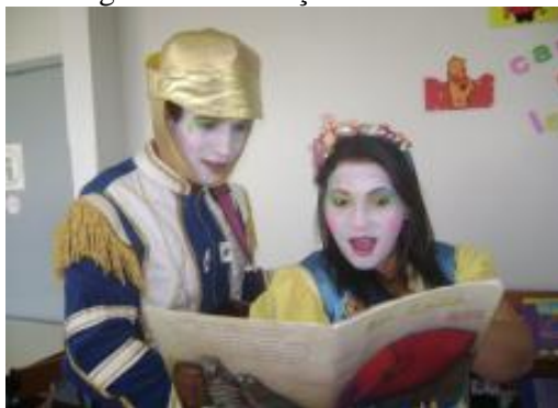
Figura 1 - Contação de histórias

A Biblioteca Americano do Brasil, Sesc Universitário, desempenha diversas atividades, no entanto, a ação que mais me despertou o interesse foi o projeto Biblioteca Solidária, o qual é desenvolvido pelo Sesc Universitário nos meses de março a junho e de agosto a novembro. Trata-se de um projeto que visa trabalhar a leitura, utilizando-a como contribuição para o conforto e descontração, destinando suas apresentações para os pacientes internados e seus acompanhantes nos hospitais da rede pública de Goiânia. Mais precisamente nos hospitais: Araújo Jorge, Materno Infantil e Hospital das Clínicas, com ações voltadas para contação de histórias e entretenimento em geral.