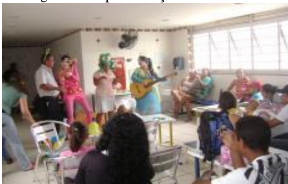
Figura 6 - Apresentações artísticas

Sendo de fato esta a realidade, o pessoal do Sesc e em especial a equipe do projeto Biblioteca Solidária estão representando bem a biblioterapia, observando pelo belo trabalho fornecido àqueles que naquele momento não estão tendo muitos motivos para sorrir.