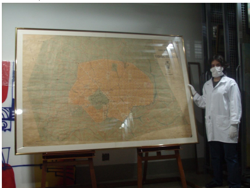
Figura 2: Planta Cadastral da Nova Capital de Minas Gerais enfatizando suas dimensões naturais.

Um último aspecto chama a atenção quando da elaboração da planta de Belo Horizonte: as dimensões do desenho produzido pelo próprio Aarão Reis; 1,40m X 2,00m. Em As cidades invisíveis , Calvino (1990) faz referência aos mapas do reino de Kublai Kan, que se propunham ser tão perfeitos que possuíam o tamanho do próprio território representado.