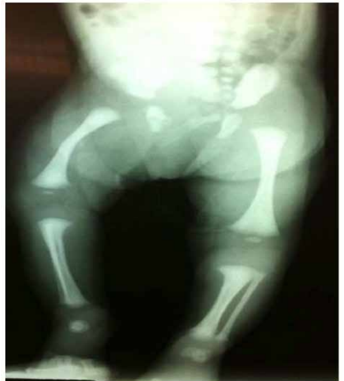
Figura 5 – Rx de membros inferiores pós natal: fratura consolidada do fêmur direito.

Foi encaminhada para a UTI neonatal para observação devido à alteração esquelética. Recém-nascida evoluiu bem, em aleitamento materno exclusivo. Realizado Rx em que foi observado consolidação da fratura do fêmur direito (Figura 5). Recém-nascida teve alta com 2 dias em bom estado geral, sem intercorrências, com segmento ortopédico e pediátrico. Todas essas informações foram obtidas após consentimento informado da paciente.