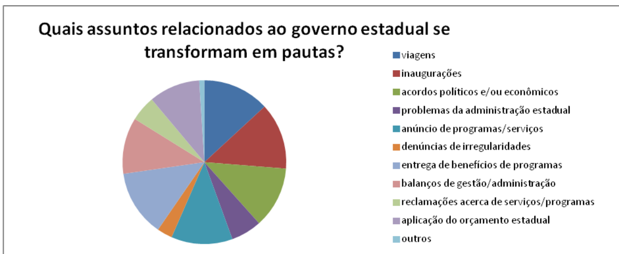
Gráfico 3. Resposta dos 13 profissionais à pergunta: “Quais assuntos relacionados ao governo estadual se transformam em pautas?”

Os assuntos mais citados foram, respectivamente: viagens, inaugurações e entregas de benefícios de programas (13 respostas, unanimidade); em seguida estão acordos políticos/econômicos e anúncios de programas e serviços, com 12 respostas e, em terceiro lugar, com 11 respostas, estão os balanços de gestão/administração. O item denúncias de irregularidades na administração estadual teve apenas três respostas. A maioria dos profissionais que responderam ao questionário admitiu sugerir pautas relacionadas ao governo estadual todos os dias, conforme ilustra o gráfico abaixo: