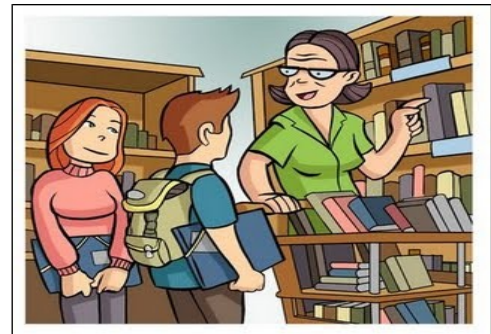
Figura 2 - Atendimento na biblioteca