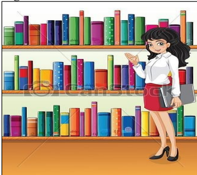
Figura 1 - A bibliotecária e os livros