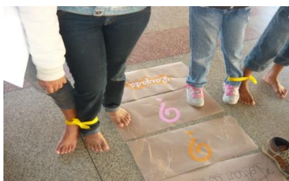
Figura 1: Os estudantes desenvolvendo atividades no Clube de Matemática

O outro projeto é intitulado Clube de Matemática . Assim como o anterior, o Clube de Matemática surge também a partir de 2009 e é desenvolvido por estudantes do curso de licenciatura em Matemática e também envolve os alunos do ensino fundamental e os professores que ensinam Matemática na rede pública (Figura 1). A finalidade do Clube de Matemática é permitir aos sujeitos envolvidos nas atividades a compreensão do processo de ensino e aprendizagem dos conhecimentos matemáticos por meio de atividades de ensino caracterizadas pela ludicidade.