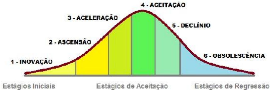
Ilustração 1 – Duração do ciclo de vida de um produto da moda 1

Há que se considerar, sempre, que o ciclo de vida de um produto de moda, quando aceito, é geralmente muito acelerado, sendo caracterizado por uma baixa aceitação inicial que, caso o produto seja aprovado, rapidamente cresce, chega a seu ápice e logo após entra em declínio (ZANETTINI, 2008, p.80).