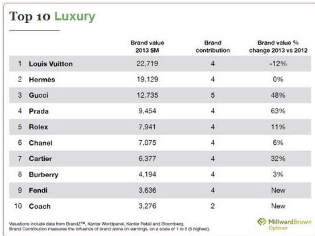
Ilustração 4 - As dez marcas de luxo mais valiosas do mundo segundo a consultoria Millward Brown Optimor 4

De acordo com Cobra, “as marcas no setor de moda proporcionam uma imagem de qualidade e status e ultrapassam os limites específicos dos atributos físicos do produto” (2007, p.44). As marcas de luxo ilustram muito bem tal afirmação.