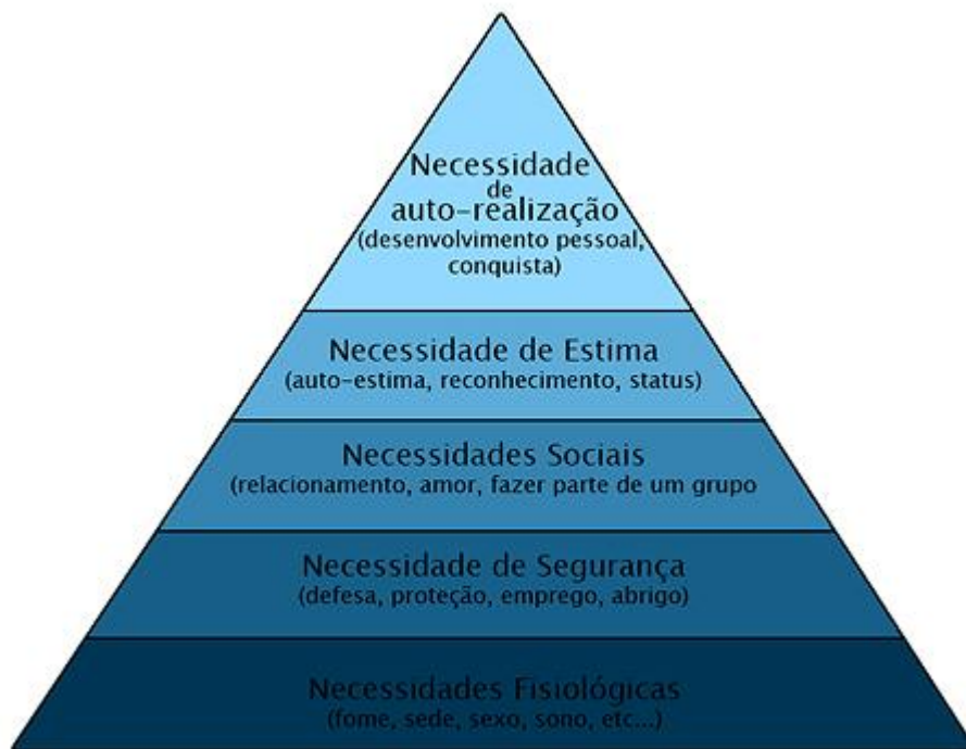
Ilustração 2 – Hierarquia das necessidades de Maslow 2

O processo de motivação inicia-se com a detecção de uma necessidade. Uma necessidade é ativada e sentida quando existe discrepância suficiente entre um estado desejado ou preferido de estar e o estado atual. À medida que essa discrepância aumenta, maiores a necessidade e a urgência sentidas com relação à sua satisfação (KARSAKLIAN, 2004, p. 36).