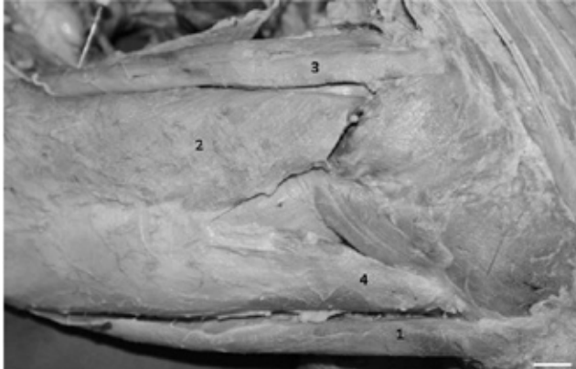
FIGURA 3. Vista lateral da coxa de P. cancrivorus , onde estão situados os músculos: 1) sartório; 2) bíceps femoral; 3) semitendinoso; 4) tensor da fascialata. Barra = 0,5 cm.

ral, vastolateral, quadrado femoral e semimembranoso (porção cranial), evidenciados nas Figuras 3 e 4, respectivamente.