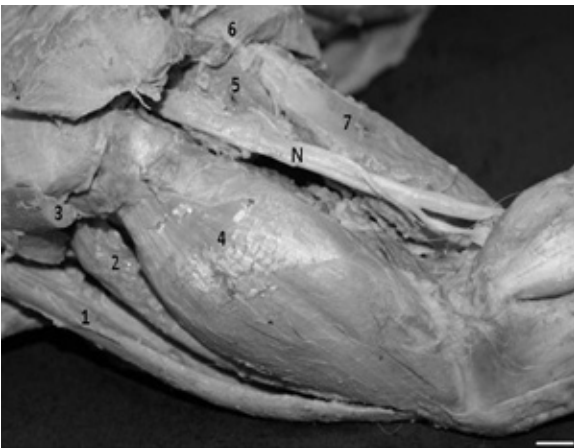
FIGURA 4. Vista lateral da coxa esquerda de P. cancrivorus , onde estão situados os músculos: 1) sartório; 2) retofemoral; 3) tensor da fascialata seccionado; 4) vastolateral; 5) quadrado da femoral; 6) semitendinoso; 7) semimembranoso; N) nervo isquiático. Barra = 0,5 cm.