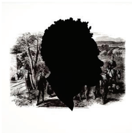
Figura 2 – Anything but Civil: Kara Walker’s Vision of the Old South

Anything but Civil: Kara Walker’s Vision of the Old South February 26 – August 10, 2014 Galleries 234 and 235