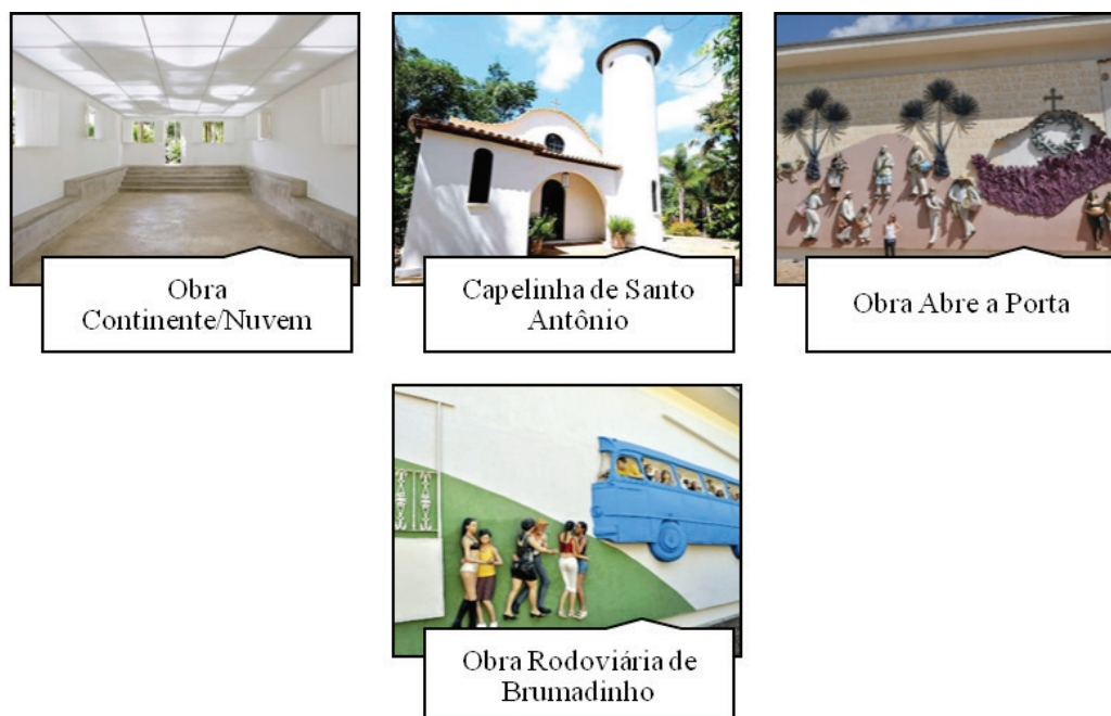
Figura 1 - Imagens de obras de arte do Instituto Inhotim 19

Utilizando-se de silêncios, Inhotim apresenta o passado do local como um ente sem nome e sem história. O referente original, a comunidade rural ali outrora existente, com seu complexo cultural, é eliminado do campo da história e das palavras. Omite-se os processos de violência simbólica e patrimonial. Mente-se sob a forma de verdade: embora o que esteja sendo contado seja verdadeiro, os motivos de dizê-lo não os são. A