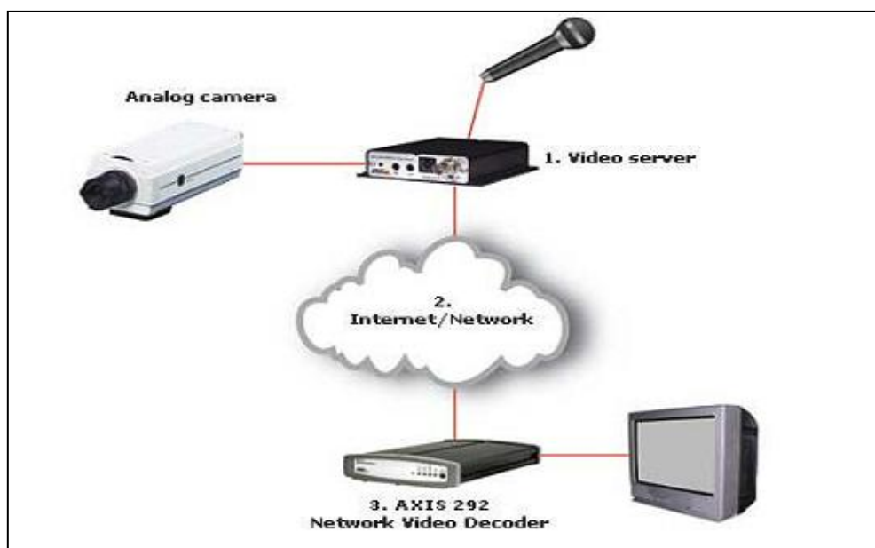
Figura 1: Sistema de vídeo vigilância analógico adaptado à rede IP

O sistema de vigilância IP é possível, devido à combinação de diversas tecnologias, sendo o vídeo digital a principal delas, associada à forma de captação, manipulação, armazenamento e distribuição da imagem. Se por um lado, os sistemas tradicionais não facilitavam a visualização do grande número de imagens, por outro, o sistema digital permite a visualização rápida, a localização de um objeto, lugar ou pessoa específica sem que seja necessário vasculhar todo o vídeo (ROSEIRO; TORRES; SALVADO, 2008).