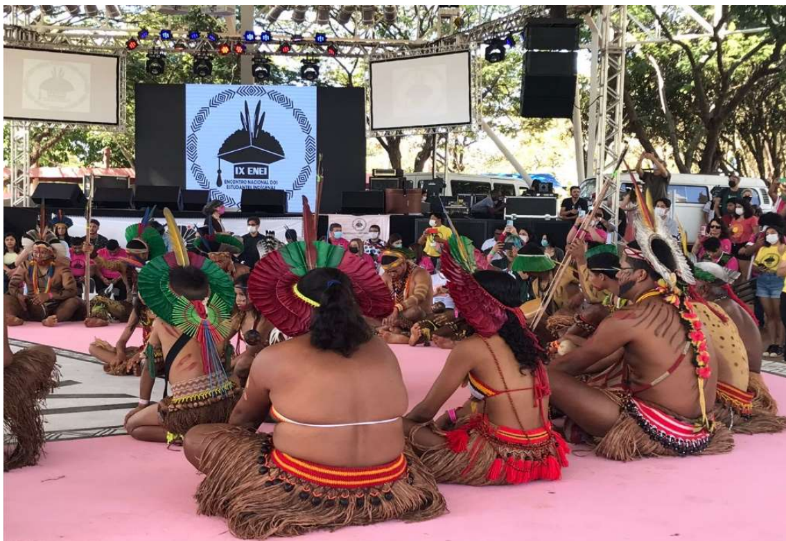
Figura 6 - Povo Pataxó após sua apresentação no ritual de abertura do IX ENEI - 2022