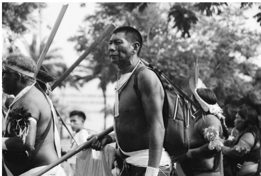
Figura 1 - Marcha do primeiro dia do 19º Acampamento Terra Livre - 2023

As palavras escritas não conseguem dar a real dimensão dos caminhos, encontram barreiras para descrever os atravessamentos, as mudanças no decorrer da pesquisa e principalmente, não conseguem respostas para todas as coisas – aliás, as respostas são quase ínfimas diante da complexidade das perguntas que surgem a todo momento. Mas compreendi que, mesmo que as palavras não deem conta de nomear, descrever, contar o muito que aprendi e senti com meu corpo e coração enquanto realizava a pesquisa, com as pessoas que conheci e diante de todos os entraves vividos, compartilhar esses sentimentos que atravessaram todo o processo são um modo lembrar que as pesquisas não seguem uma linearidade de acontecimentos e que na antropologia, nunca se sabe quando é que as coisas vão acontecer e muito menos, como elas vão terminar. E é talvez, nessa incerteza do que vai acontecer, que as coisas mais importantes acontecem.