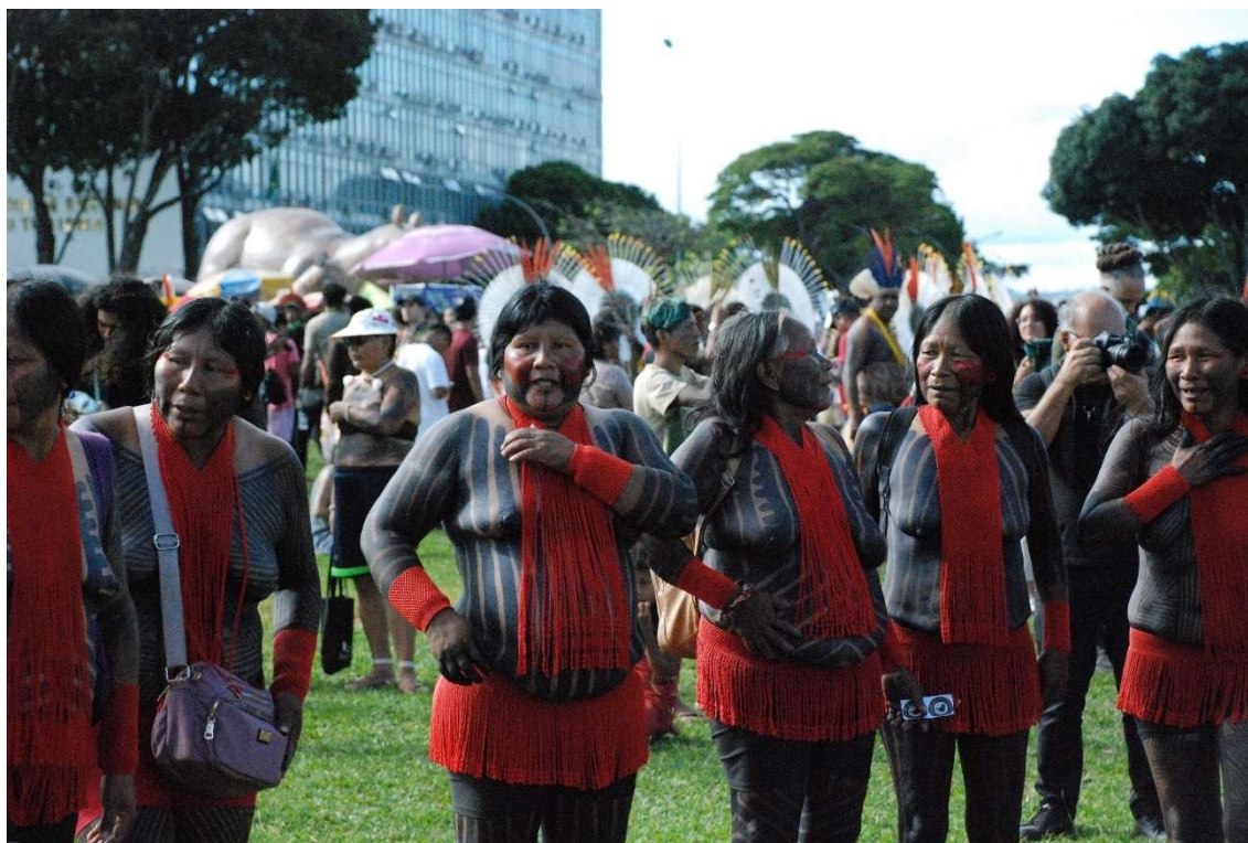
Figura 10 - Menire no gramado da esplanada após a marcha - 2023