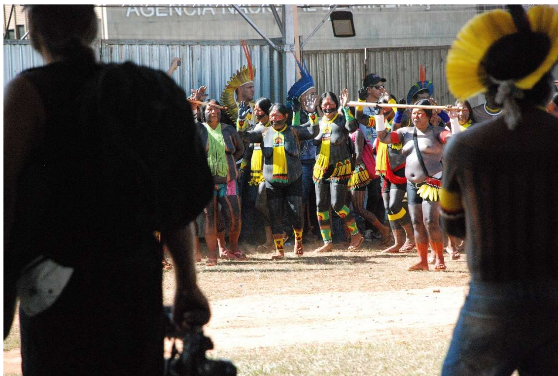
Figura 24 - Menire cantando antes da votação começar