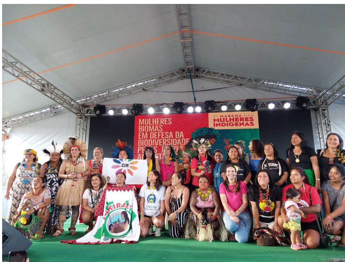
Figura 21 - Nova composição das articuladoras da 3ª Marcha das Mulheres Indígenas – 2023

Para que a Marcha de 2023 pudesse acontecer, durante o ATL foram eleitas as mulheres responsáveis por coordenar as ações até o dia da Marcha. As coordenações são divididas primeiro por biomas, depois por estados e a partir de então, cada uma delas tem a responsabilidade e o trabalho de mobilizar o maior número possível de mulheres para estarem na Marcha. Cada mulher que aceita esse compromisso tem cerca de 5 meses para formar comissões, organizar o trabalho, organizar o transporte e os demais recursos que viabilizem a presença dessas mulheres em Brasília.