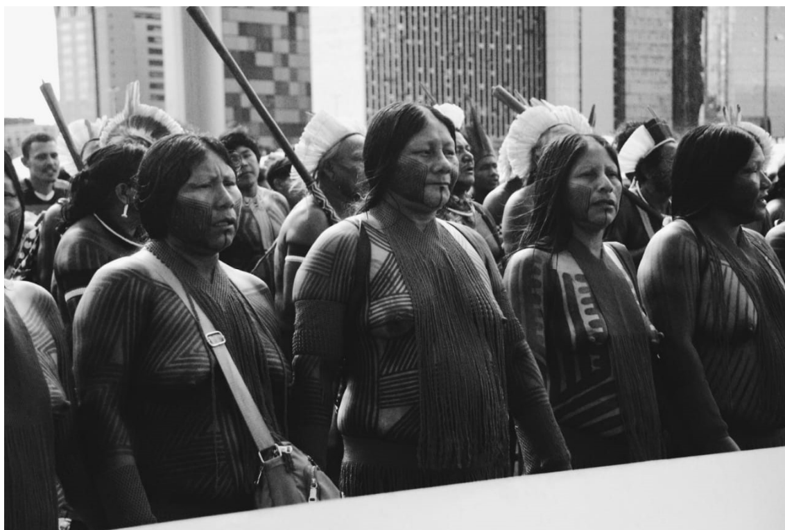
Figura 9- Menires em marcha durante o ATL - 2023

"[...] este trabalho envolve toda a nossa personalidade - cabeça e coração [...] o que se traz de um estudo de campo depende muito do que se leva para ele." (EVANS-PRITCHARD, E..1937, p.300)