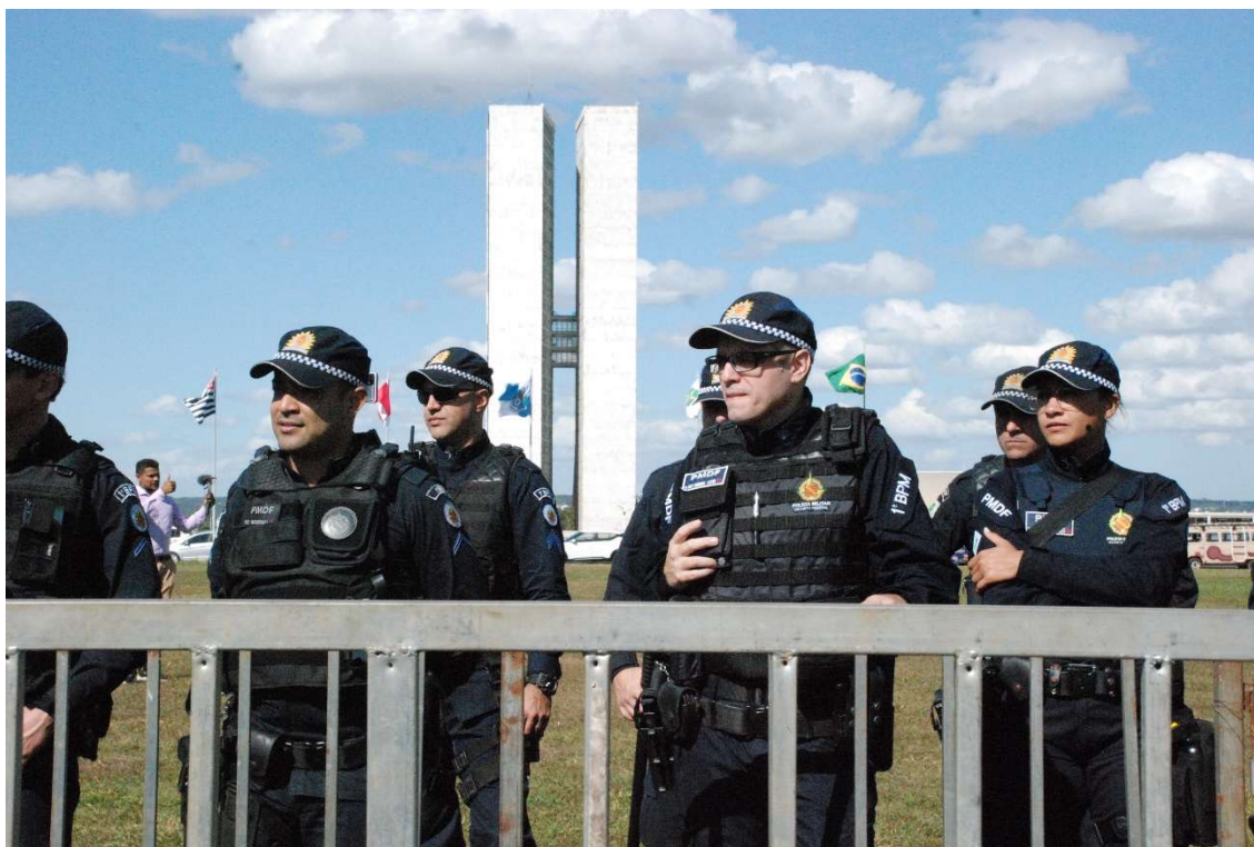
Figura 31 - O cerco da guerra - 2023