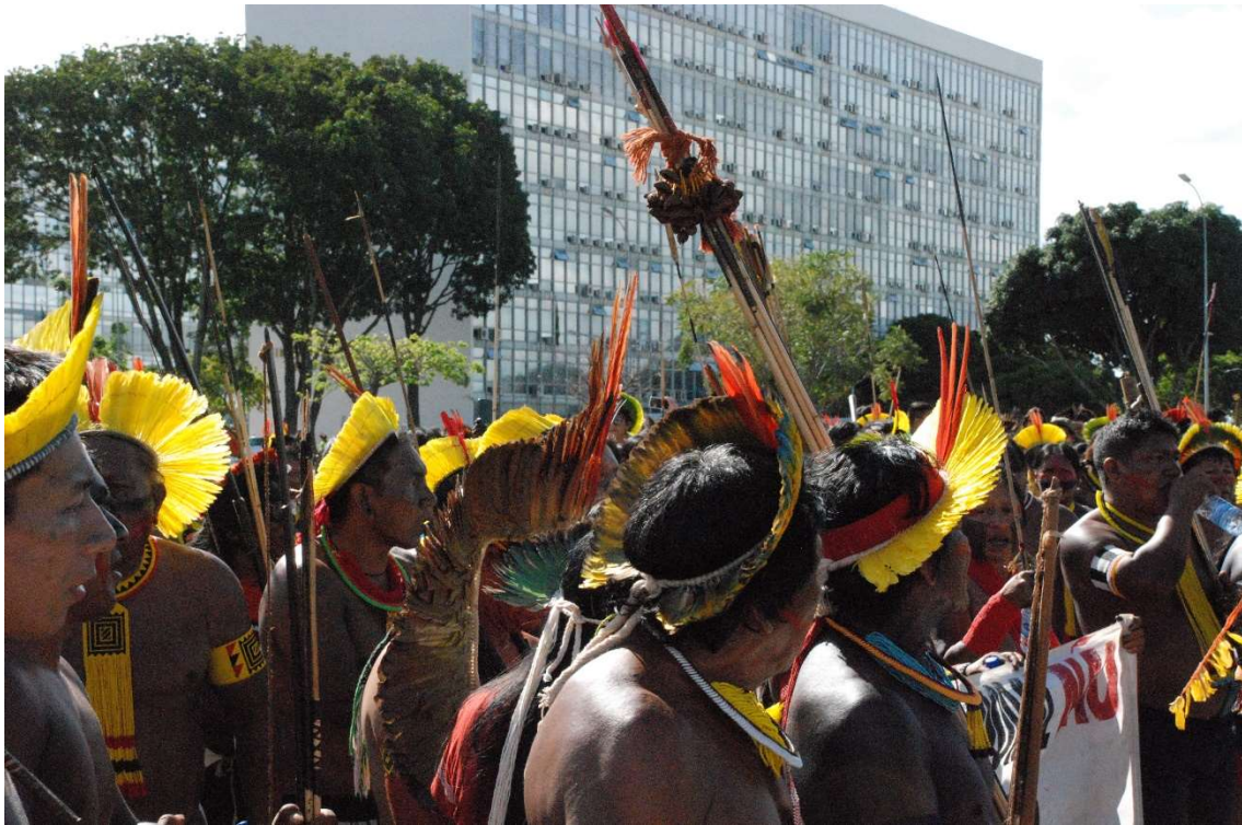
Figura 28 - Homens Kayapó em marcha - 2023