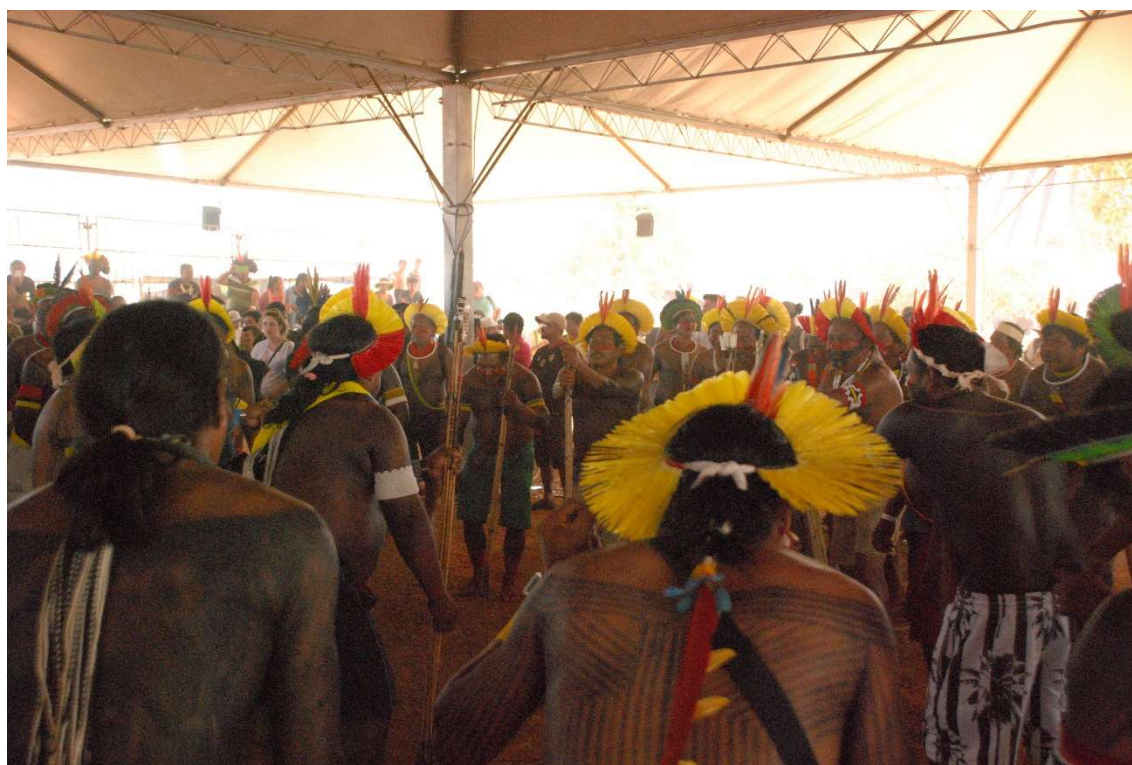
Figura 23 - Homens Kayapó cantando - 2023