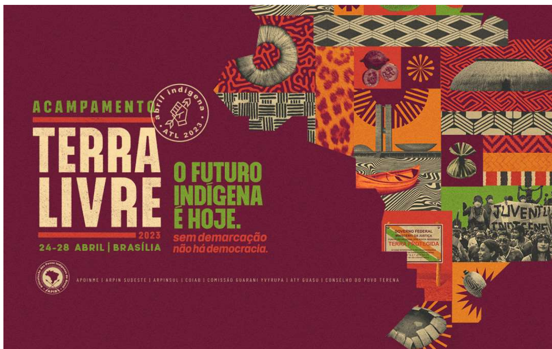
Figura 11- Divulgação do 19º Acampamento Terra Livre – 2023

celebradas durante a décima nona edição (2023). Para além da celebração pelas conquistas no âmbito da política institucional com as vitórias eleitorais das parentíssimas 22 Sonia Guajajara e Célia Xacriabá, foi possível retomar as articulações com o governo que não aconteciam desde 2016.