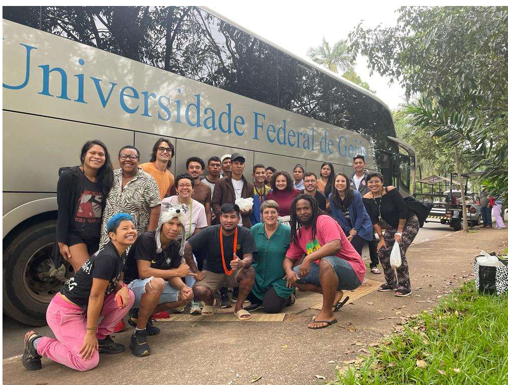
Figura 12 - Grupo de estudantes da UFG e a professora responsável por acompanhar a viagem para Brasília - 2023