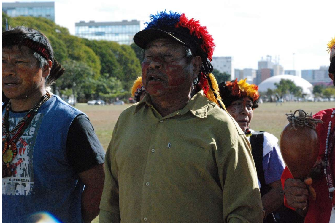
Figura 34 - Ñhanderu e sua reza 2 - 2023