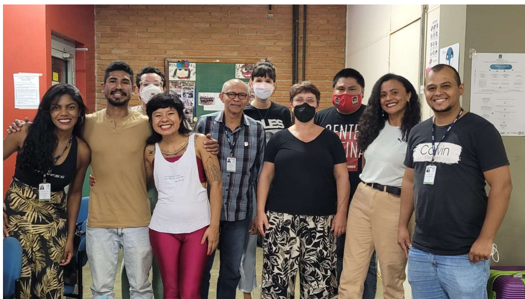
Figura 2 - Reunião com a SIN sobre os detalhes da viagem – 2022

O transporte para o ENEI foi viabilizado pela Universidade Federal de Goiás (UFG) através da Secretaria de Inclusão e Permanência (SIN) que solicitou uma reunião para apresentar as condições para a disponibilização do ônibus e a professora que seria responsável pelo ônibus, condição a qual todos os estudantes já estão familiarizados. Foi um momento de apresentações, diálogos, mas também de uma certa exigência de uma devolutiva do Encontro como uma contrapartida da viabilização do ônibus.