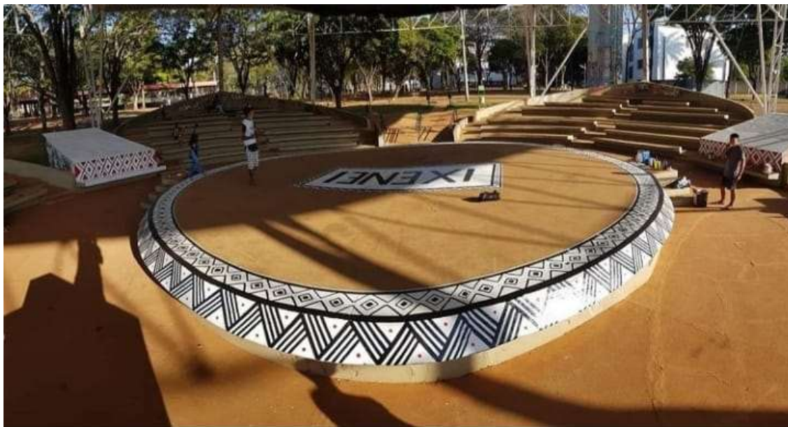
Figura 7 - Teatro de arena da UNICAMP - 2022

encontro como um espaço de resistência. O coletivo Awuê Heruê da Aldeia Boca da Mata - Pataxó, iniciou o ato para oferecer bons dias na língua pataxó. Foi um ritual com cânticos e instrumentos característicos. Entre as letras dos cânticos destacam-se os seguintes trechos: “Eu sou guerreiro pataxó”, “A nossa força vem da mata”, “Eu estou cantando pra floresta”, uma revelação da resistência que defendem os povos e comunidades indígenas no Brasil e da relação ser humano-natureza. (Relatório Final IX ENEI, p. 10, 2022)