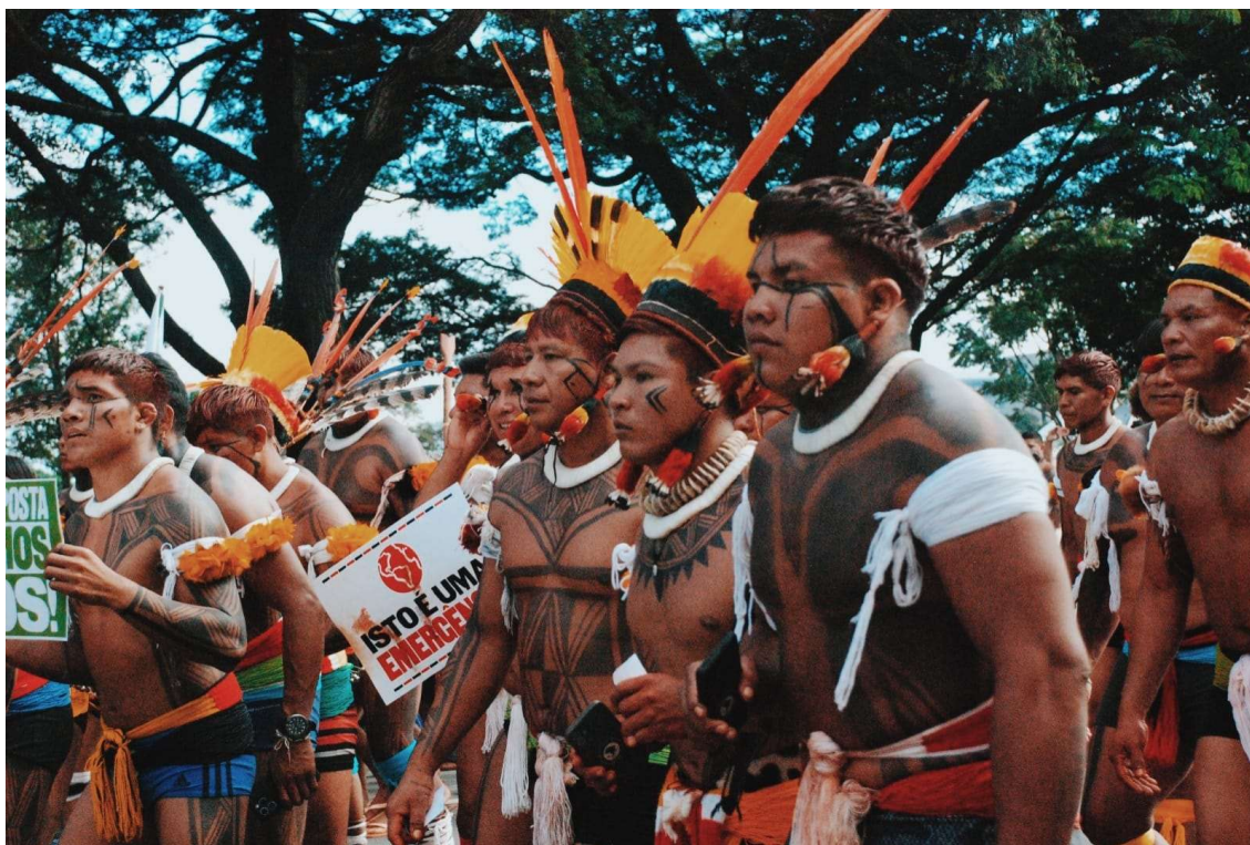
Figura 20 - Homens Waurá em marcha no ATL - 2023