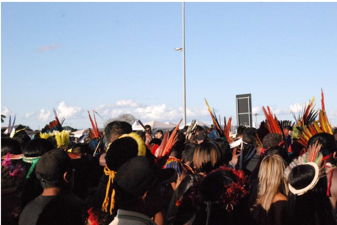
Figura 17- Marcha do primeiro dia de ATL - 2023