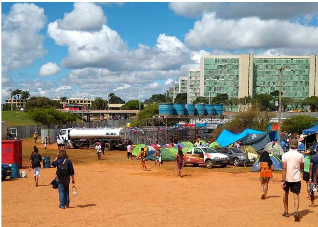
Figura 13 - Estrutura para os banhos durante o ATL – 2023