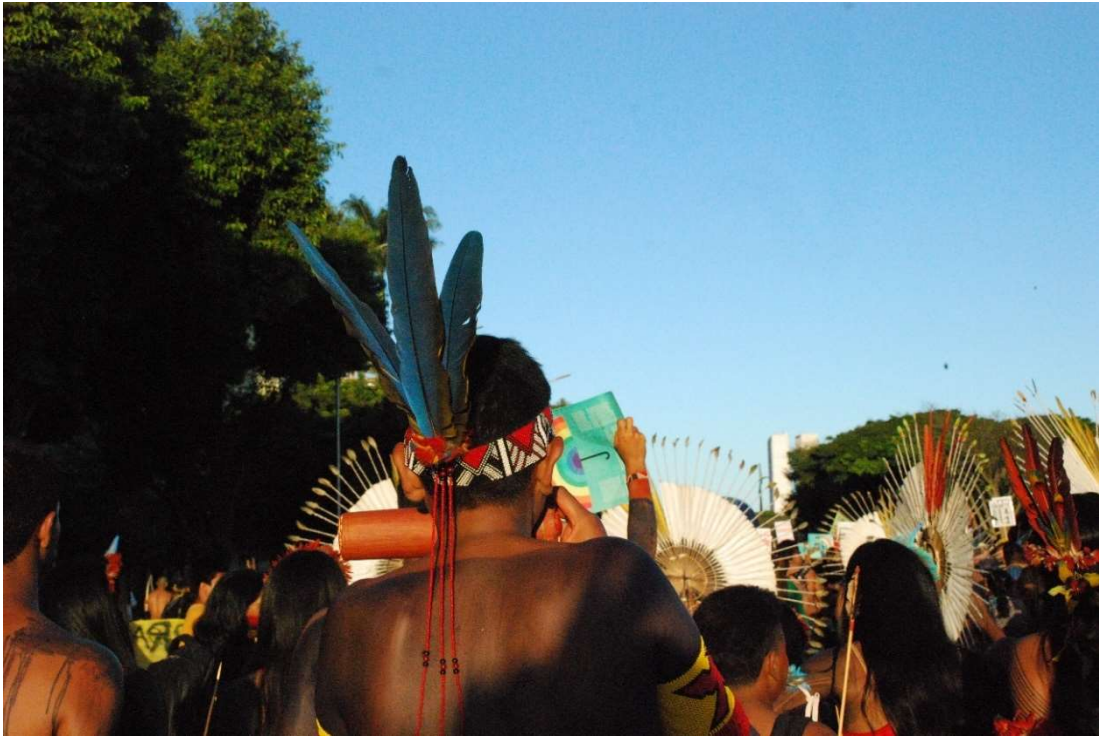
Figura 16 - Marcha do primeiro dia de ATL – 2023