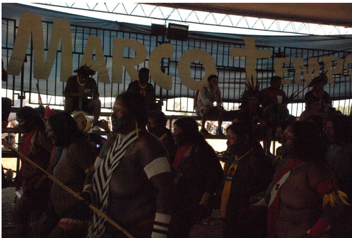
Figura 22 - Menire durante a preparação para a votação do Marco Temporal- 2023

Quando o governo viola os direitos do Povo, a revolta é para o Povo e para cada agrupamento do Povo o mais sagrado dos direitos e o mais indispensável dos deveres. (Declaração de Direitos (do homem e do cidadão), França, 1793)