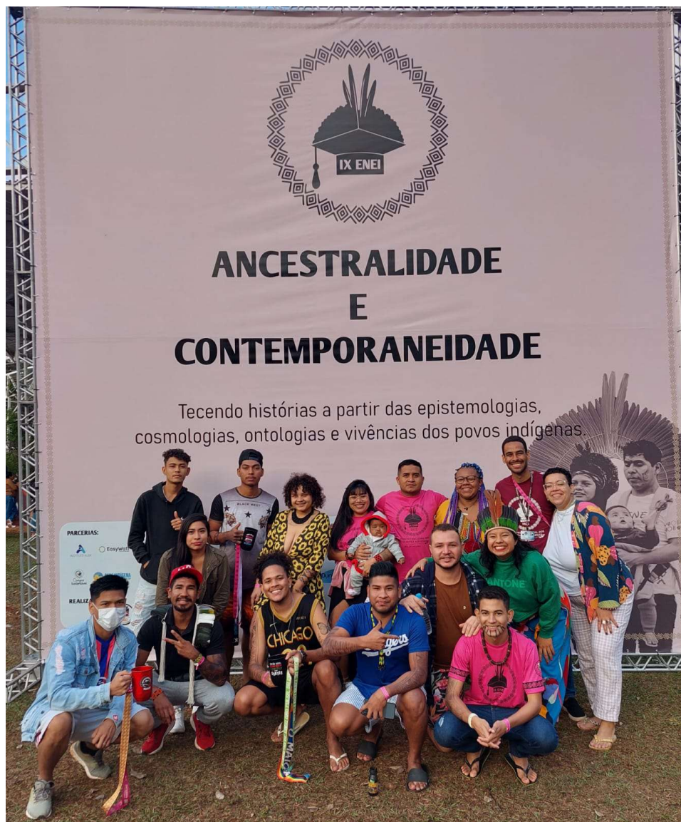
Figura 8 - parte do grupo de discentes da UFG no último dia do ENEI – 2022