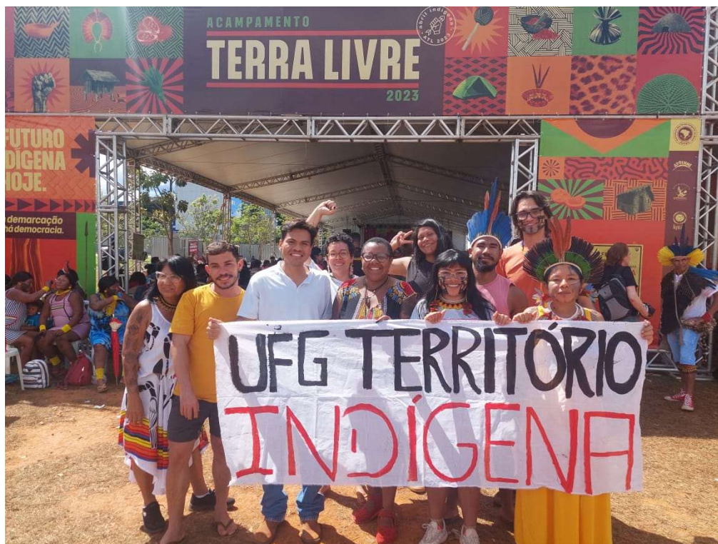
Figura 14 - Parte do grupo de discentes da UFG – 2023

A volta sempre é sempre silenciosa, pois num misto de cansaço e do que significa voltar para Goiânia, para UFG e para a rotina não há muita alegria.