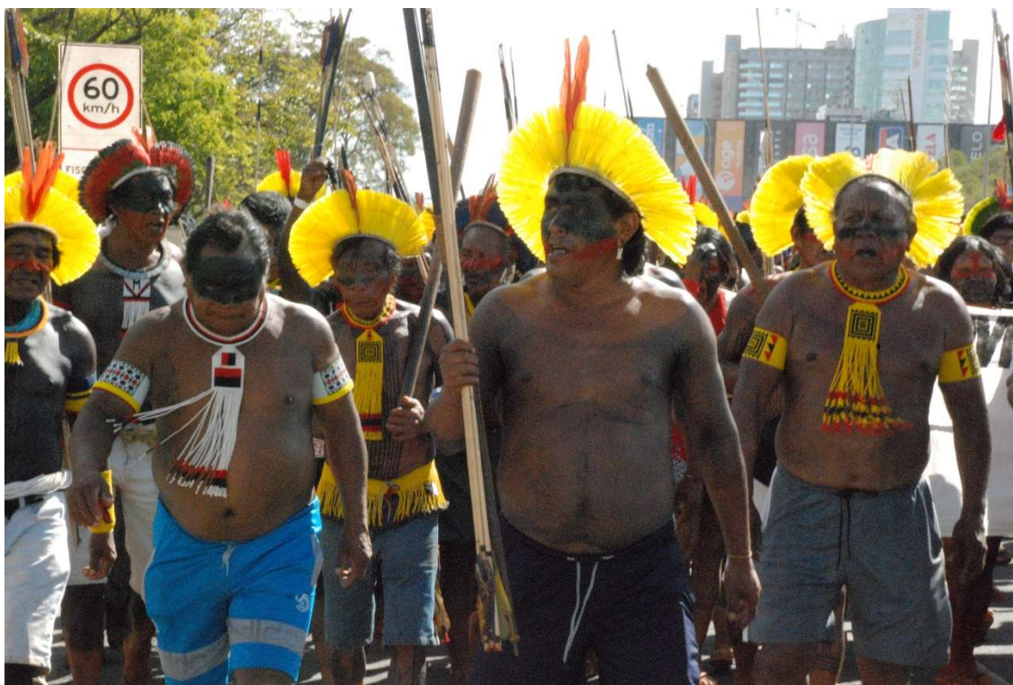
Figura 27 - Homens Kayapó em marcha para o gramado da esplanada - 2023

Corremos pela avenida, de olho no relógio, mas sem deixar ninguém para trás. Apesar do tempo apertado para chegarmos até o cercado que separa o gramado do Congresso e do STF, era mais importante que todos chegassem juntos, principalmente por conta da via que não havia sido fechada anteriormente por isso o bloqueio acontecia a medida em que a marcha avançava. Ao chegarmos no gramado novas pulseiras foram distribuídas para que outro pequeno grupo pudesse ir até a porta do STF e acompanhar a votação do lado de fora, sem telão só pela transmissão de canais do YouTube como seria para quem ficasse no gramado.