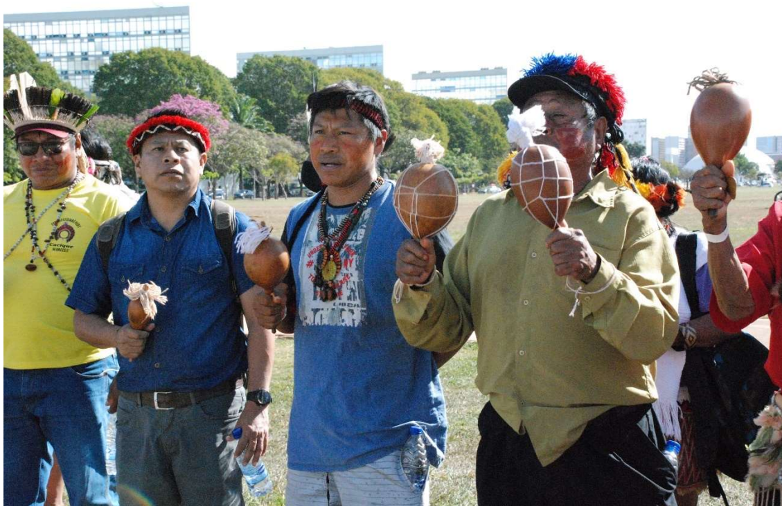
Figura 33 - Ñhanderu e sua reza - 2023