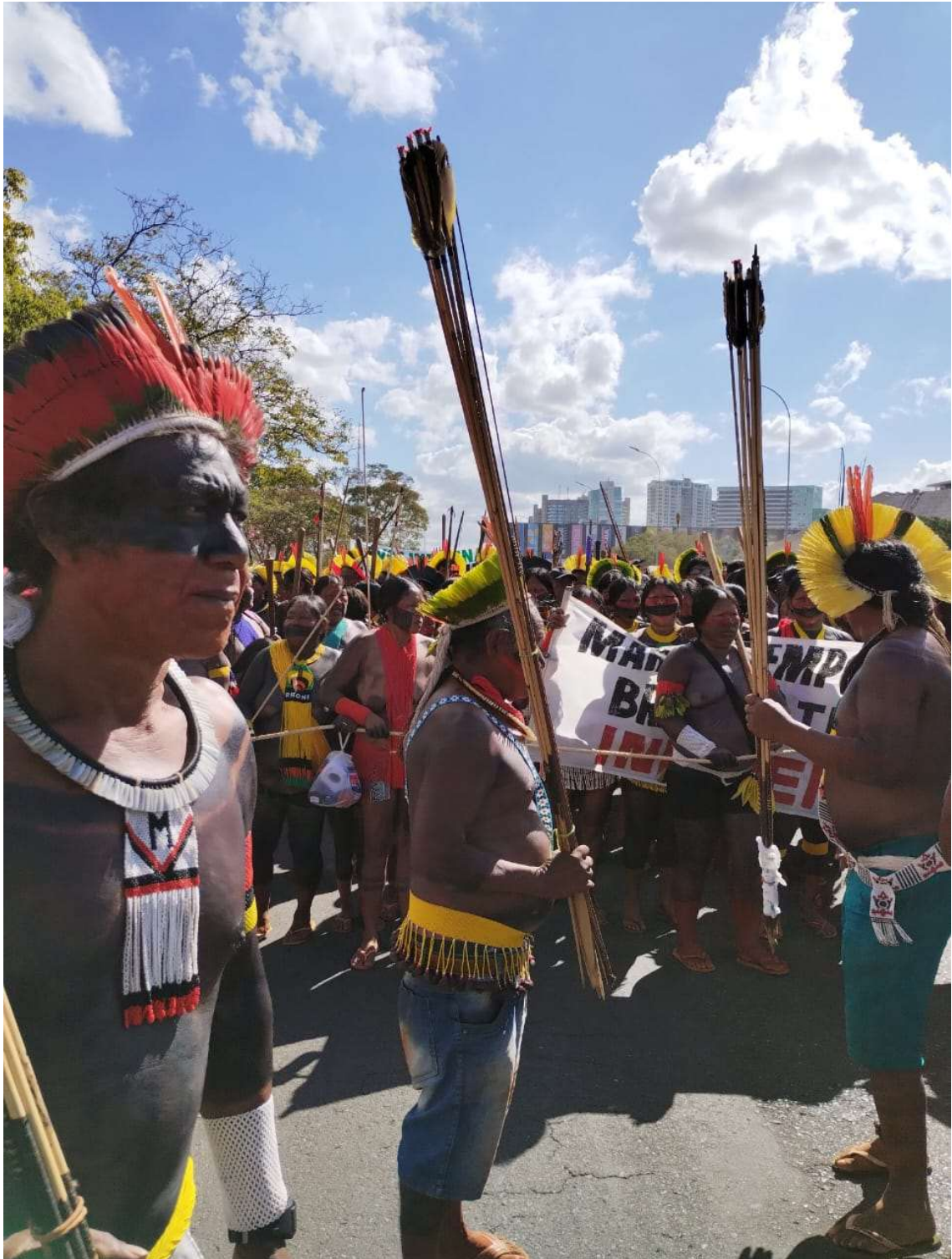
Figura 30 - A resistência Kayapó - 2023