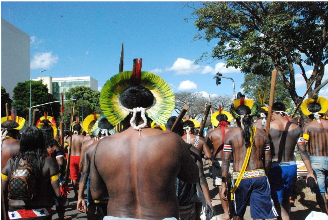
Figura 29 - A marcha até o gramado da esplanada - 2023