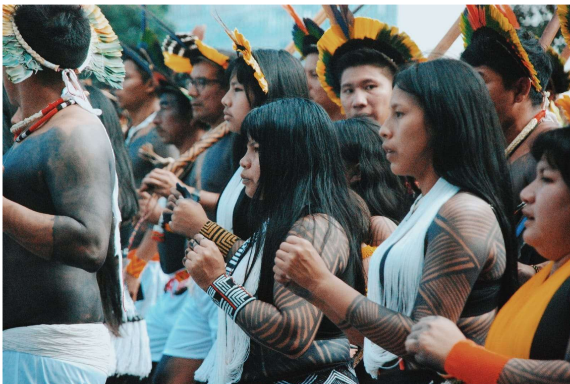
Figura 18- Mulheres em marcha - 2023