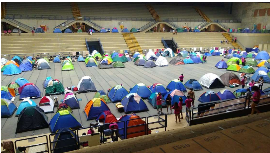
Figura 5 - Parte do acampamento no ginásio da UNICAMP - 2022

Ao chegarmos no ginásio, que ainda estava relativamente vazio, pudemos escolher a melhor localização (apesar do ginásio estar muito bem preparado para nos receber, lugares estratégicos como as tomadas, foram bem disputados) e decidimos ficarmos juntos. Enquanto as caixas de som e os celulares eram carregados, montamos nossas barracas e a medida que um terminava ajudava o outro e todo mundo terminou meio junto e com muita pressa já que a pequena festa que havia sido interrompida no ônibus, tinha planos de continuar ali mesmo nas imediações do ginásio, até o dia raiar.