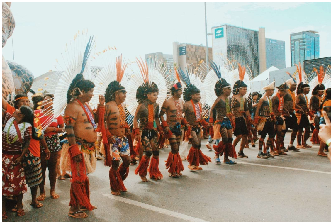
Figura 19 - Homens do povo Iny em marcha - 2023