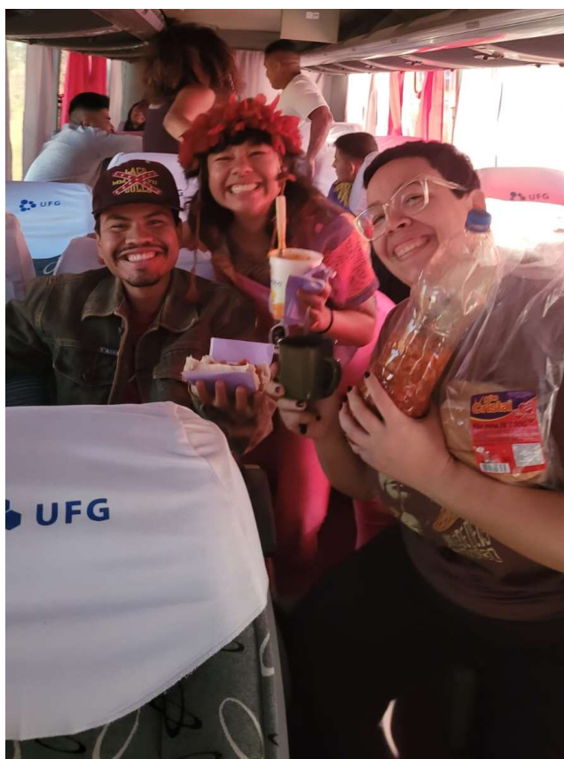
Figura 4 - o lanche coletivo e cachorro quente na garrafa