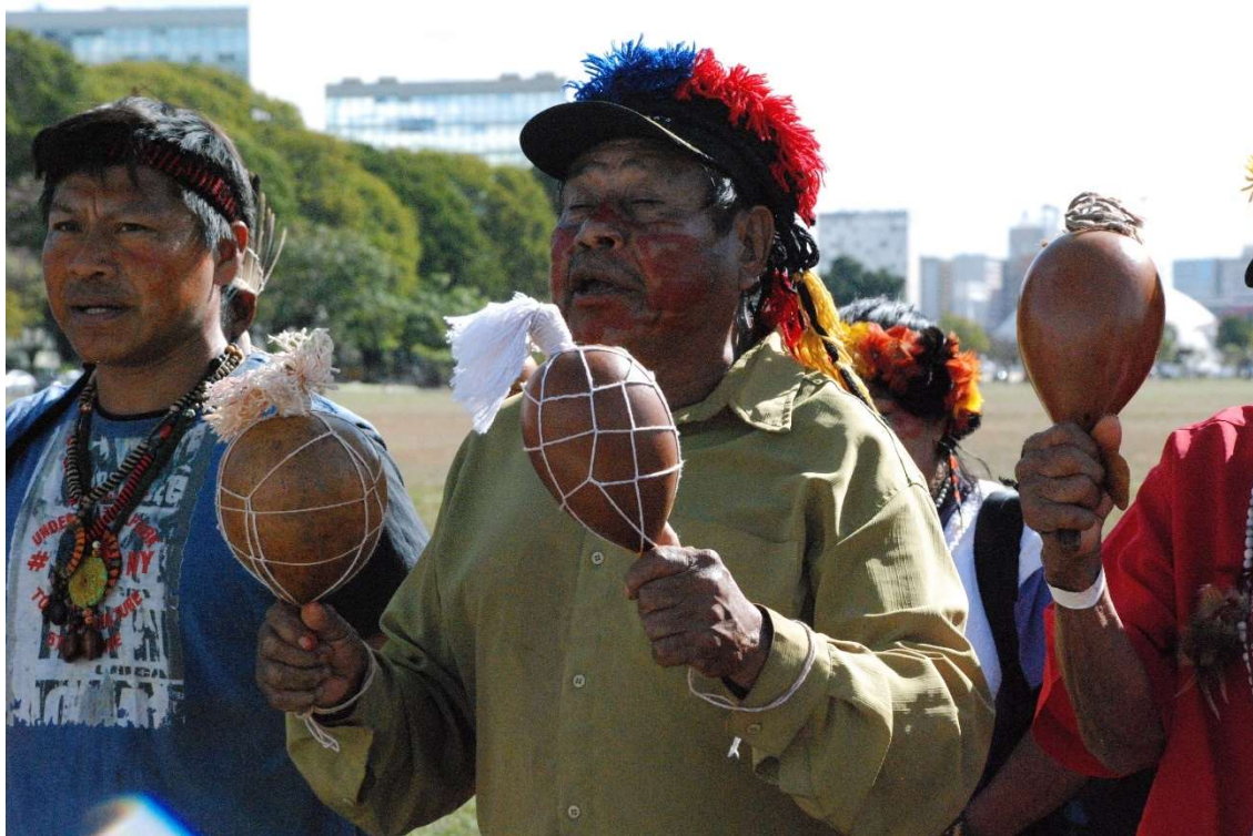
Figura 32- Ñhanderu Guarani - Kaiowá - 2023