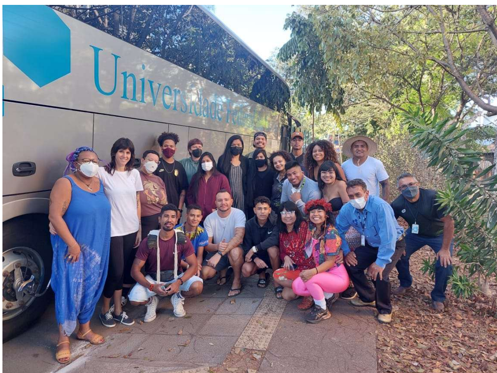
Figura 3 - Grupo de estudantes juntamente com a professora e os motoristas – 2022

O receio sobre minha participação teve um curto período de duração pois ao entrar no ônibus e começar a interagir com as pessoas, compartilhando as expectativas e ouvindo as histórias que surgiam de mobilizações anteriores o cenário era bem semelhante ao da militância estudantil a qual eu estava familiarizada, mas era mais acolhedor e animado. Registramos a saída como havia sido combinado com a SIN, embarcamos e em menos de cinco minutos, uma fome coletiva se manifestou e de grande parte das sacolas, saíam bolachas, frutas, paçoca de carne de sol feita pelo pai de uma das pessoas, e meu cachorro quente. Xícaras, pratos, colheres, potes de manteiga, margarina e sorvete brotavam de todos os lugares e eram compartilhados com quem não tinha. Aquele momento foi o prenúncio do que estava por vir