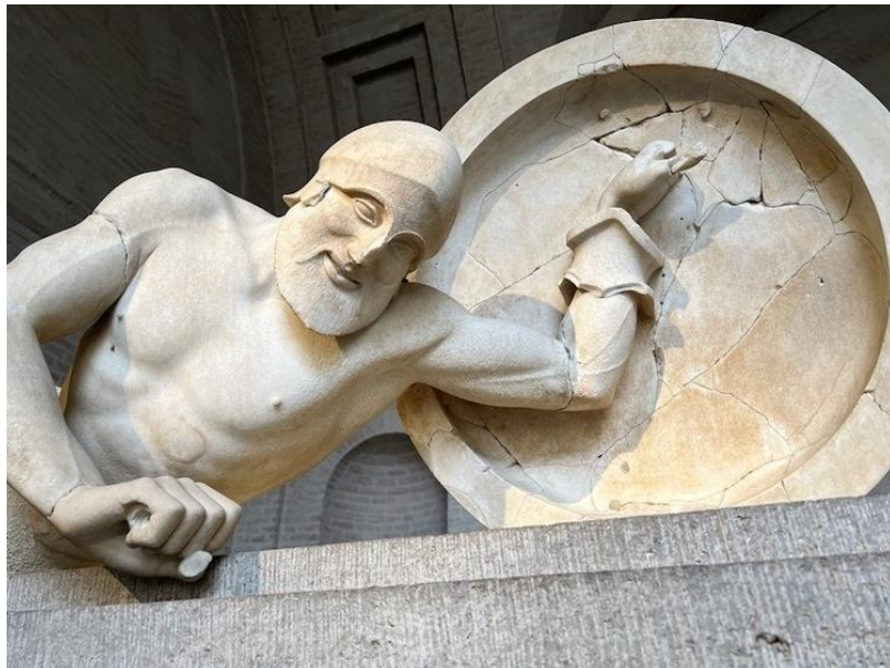
Figura 2 - Estatua Egina