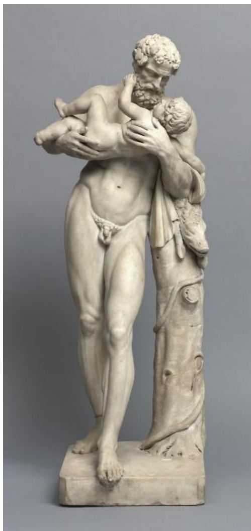
Figura 7 – Jovem fauno com Dionísio