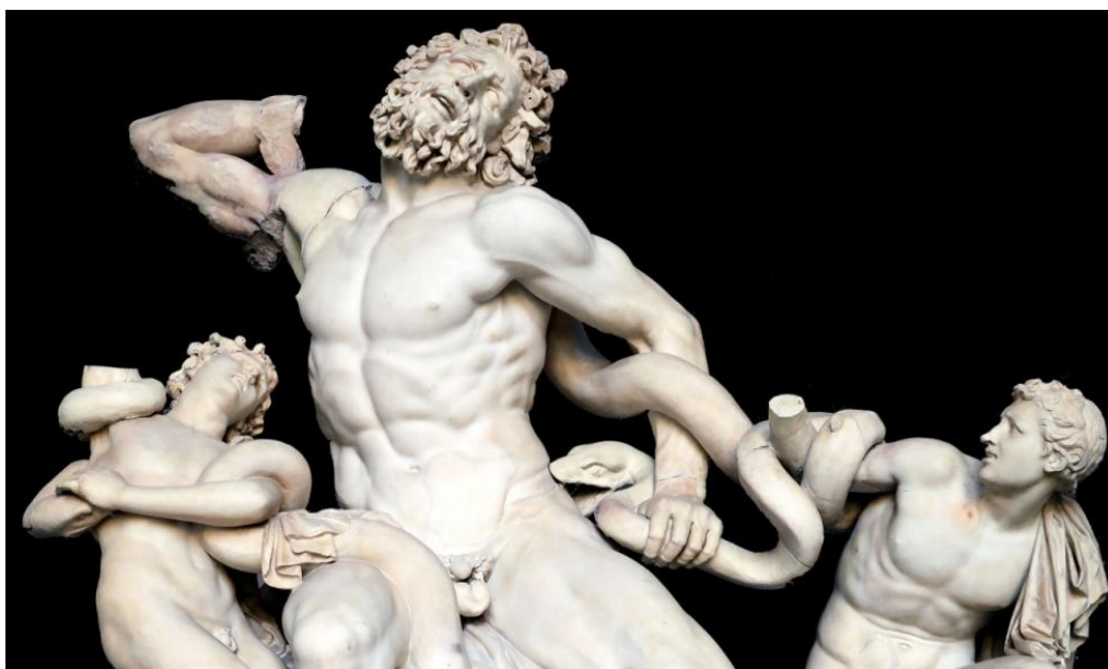
Figura 9 - Laocoonte