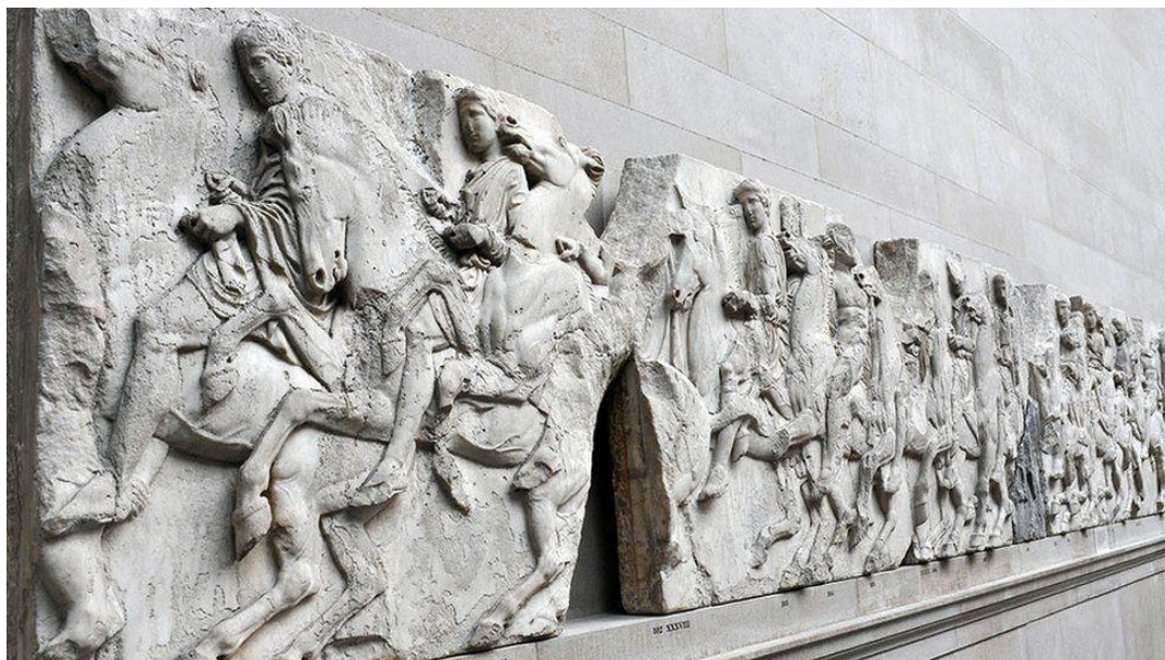
Figura 3 - Fachada Parthenon