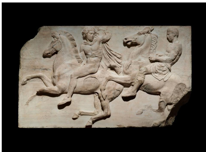
Figura 6 – Cavaleiros friso Parthenon

Fonte: Museu Britânico: https://www.britishmuseum.org/ Acesso: 3 de julho 2023