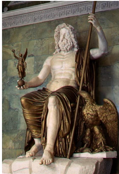
Figura 1 - Zeus de Fídias: cópia romana.