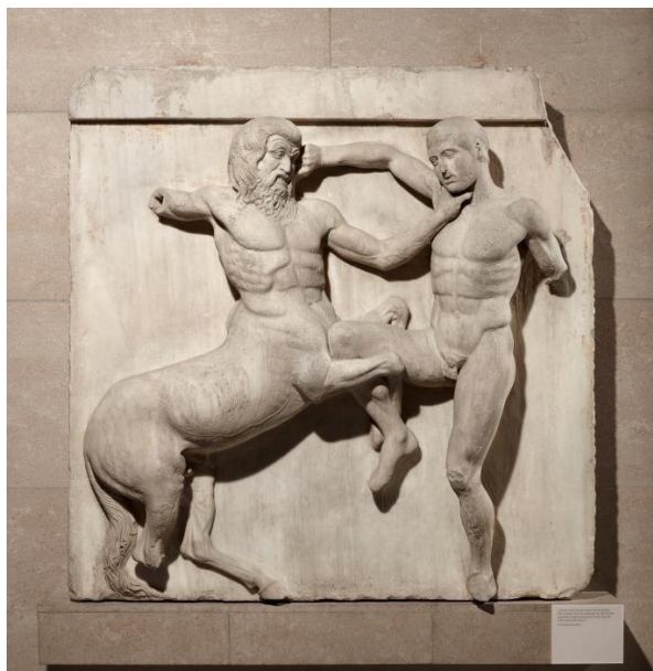
Figura 5 – Friso com Centauro