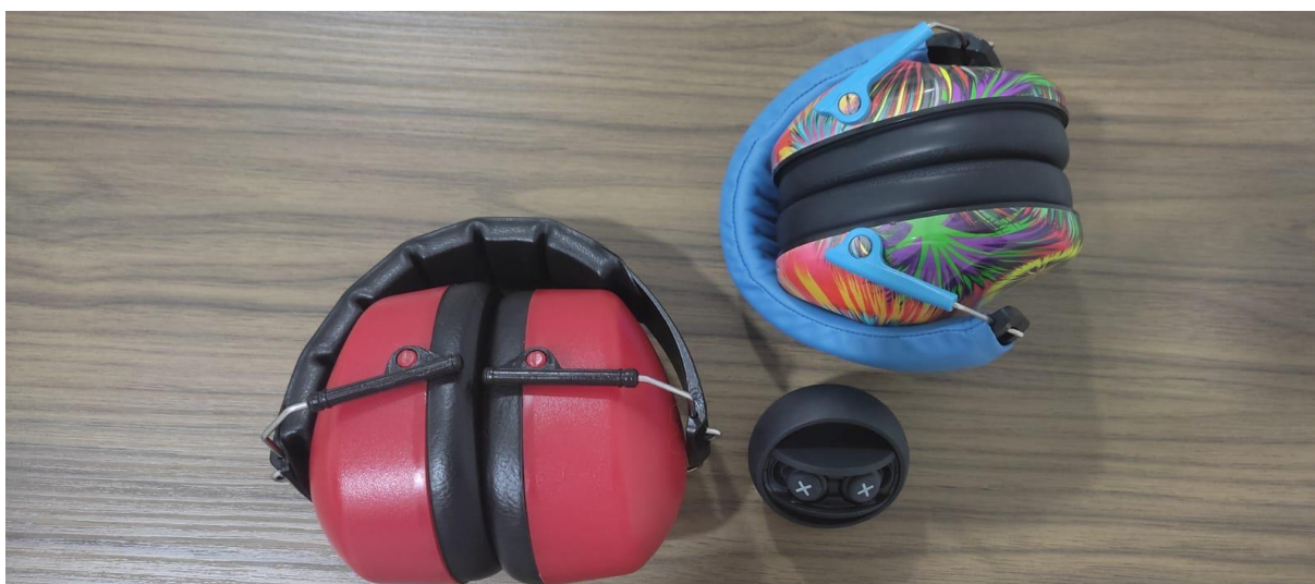
Figura 4: Abafadores de ruído.