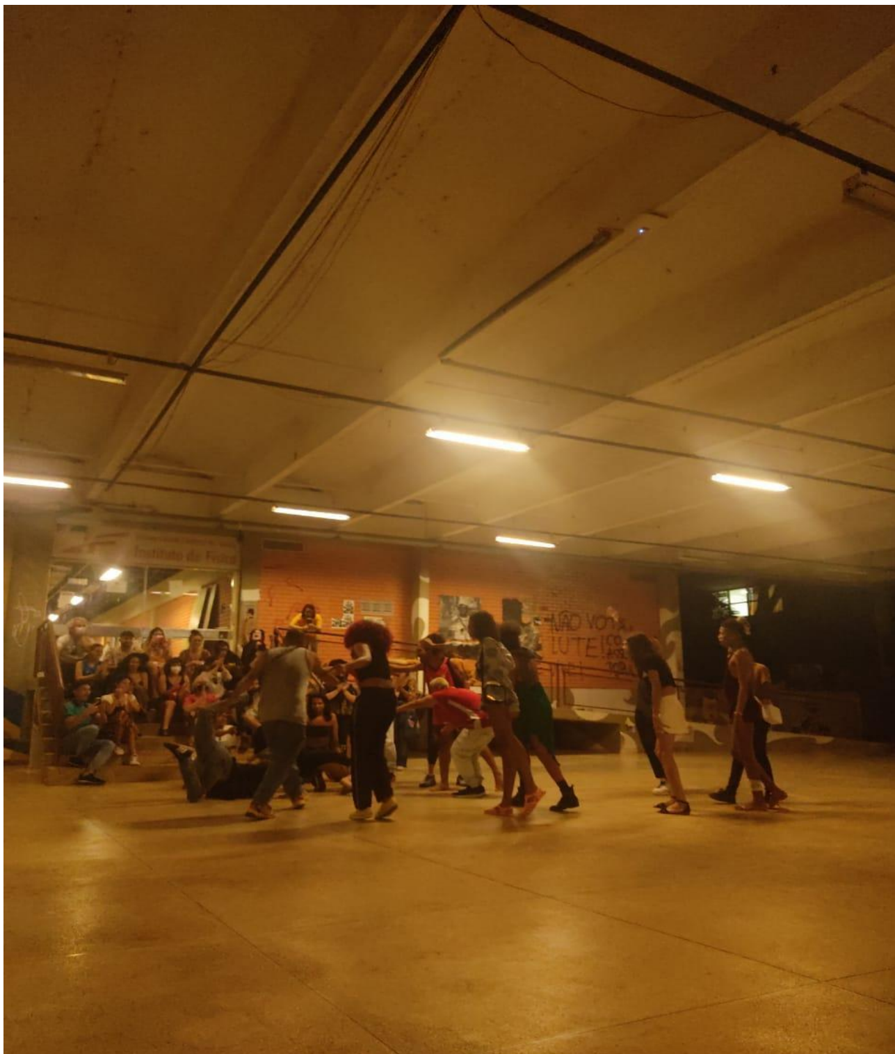
Figura 1: Evento da Cultura de Baile/ Ballroom realizada no pátio Humanidades I, campus Samambaia UFG na noite do dia 12 de dezembro de 2022.