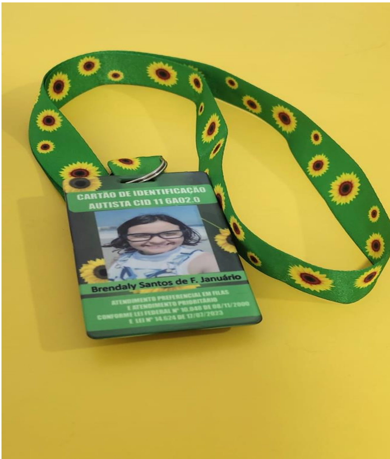
Figura 3: Cartão de Identificação – cordão de girassol.