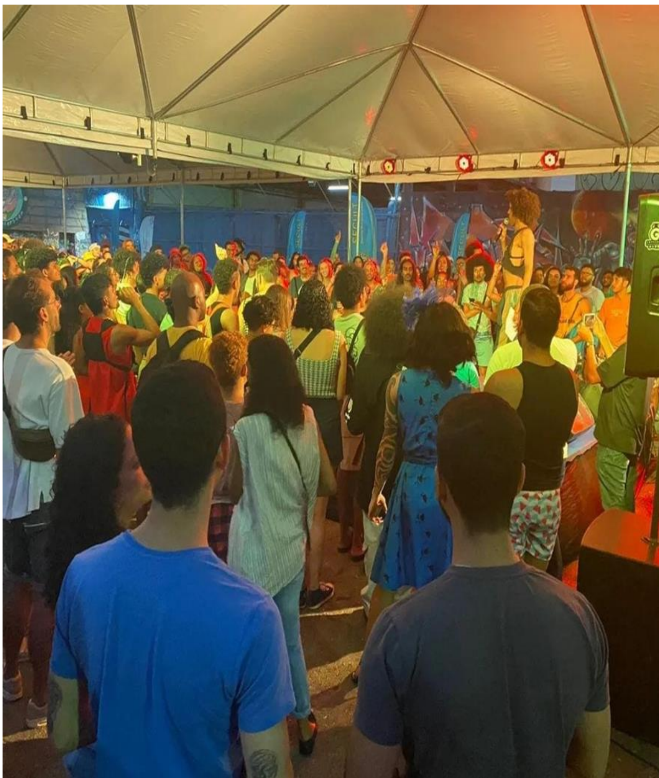
Figura 2: Início do evento Cultura de Baile/ Ballroom realizado no dia 30 de abril de 2023 - Setor Central de Goiânia.