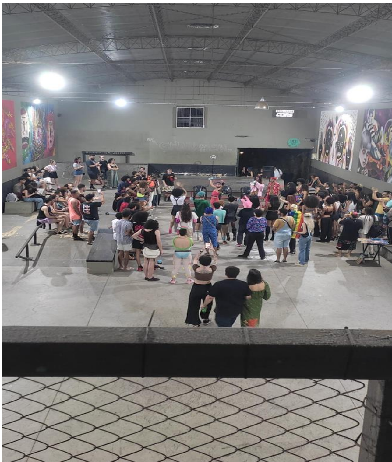
Figura 5: Início de evento da Cultura de Baile/ Ballroom , realizada no dia 18 de fevereiro de 2023 - Setor Central.