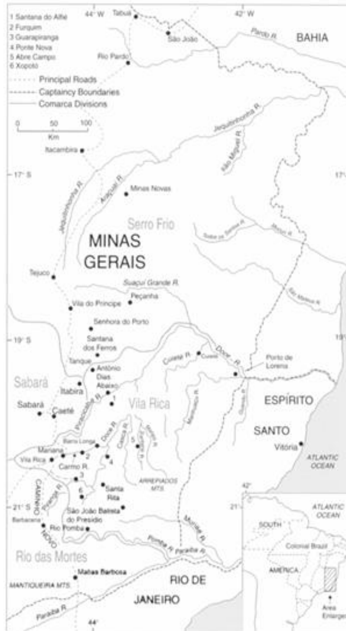
Figura 2: Mapa da Capitania de Minas Gerais produzido por Hal Langfur, com destaque para a comarca de Vila Rica