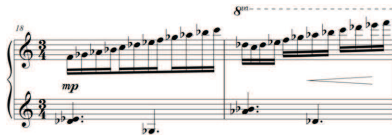
Exemplo 11: Uso do modo Fá frígio nos compassos 18 e 19 em Três Micro-Peças - Lúdico , para piano solo de Ronaldo Miranda