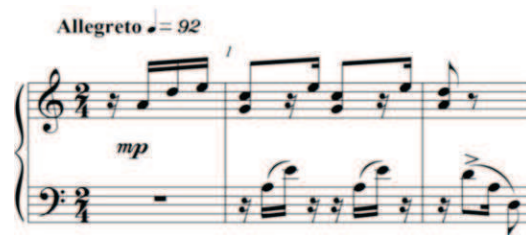
Exemplo 10: Uso do modo Ré dórico no início da Suíte n.º3 - II movimento para piano solo de Ronaldo Miranda

Quanto aos modos eclesiásticos, Miranda, por exemplo, utiliza o modo lídio em Festspielmusik para remeter às suspensões das escalas de tons inteiros. Em outras obras, encontram-se o seu uso com outra função como o modo dórico na Suíte n.º3 para piano solo e o modo frígio na terceira peça das Três Micro-Peças .