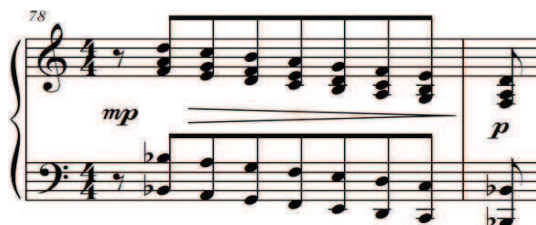
Exemplo 8: Sucessão de acordes diatônicos descendentes (clave de sol) no compasso 78 da Suíte n°3 - I mov. para piano solo de Ronaldo Miranda

Miranda faz uso de sucessões de acordes diatônicos no quarto movimento de Festspielmusik e em sua Suíte n°3 , para piano solo.