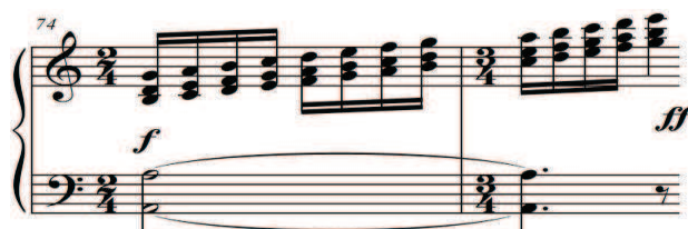
Exemplo 9: Sucessão de acordes diatônicos ascendentes (clave de sol) no compasso 74 da Suíte n°3 - IV mov. para piano solo de Ronaldo Miranda