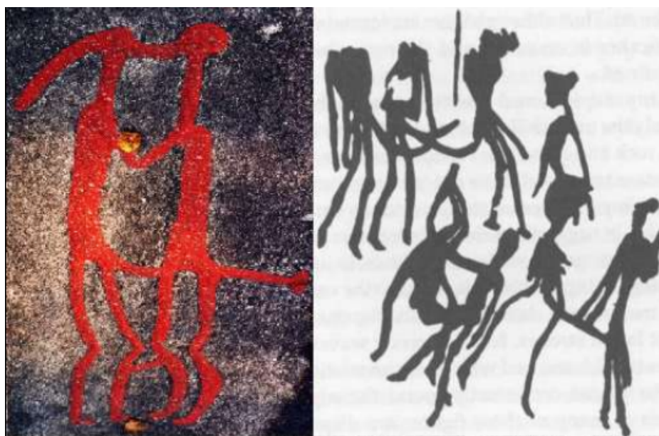
Figura 1: Registros rupestres que exibem práticas homoeróticas: à esquerda, na Suécia; à direita, pintura rupestre encontrada no Zimbábue e que foi digitalizada (Justamand, 2021, p.9).

desde milhares de anos atrás, publicar suas práticas sociais e sexuais, ao deixar marcadas as rochas para a eternidade. Assim, se em muitas cenas, como as de caça e de rituais não evidenciamos marcações de ordem sexual, em algumas pinturas as marcações sexuais ficam evidentes, como meio de comunicação destas relações, observando-se, portanto, possíveis posições sociais e sexuais que reverberam a organização desses grupos humanos (Justamand et al., 2021, p.7).