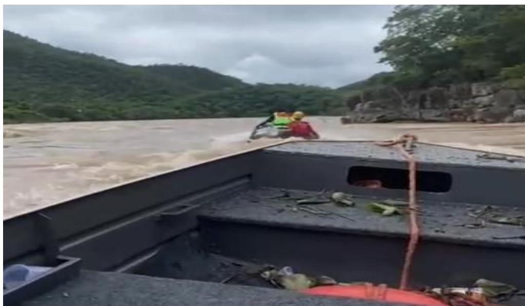
Foto: Quilombo Kalunga, Vão do Moleque, janeiro de 2021.