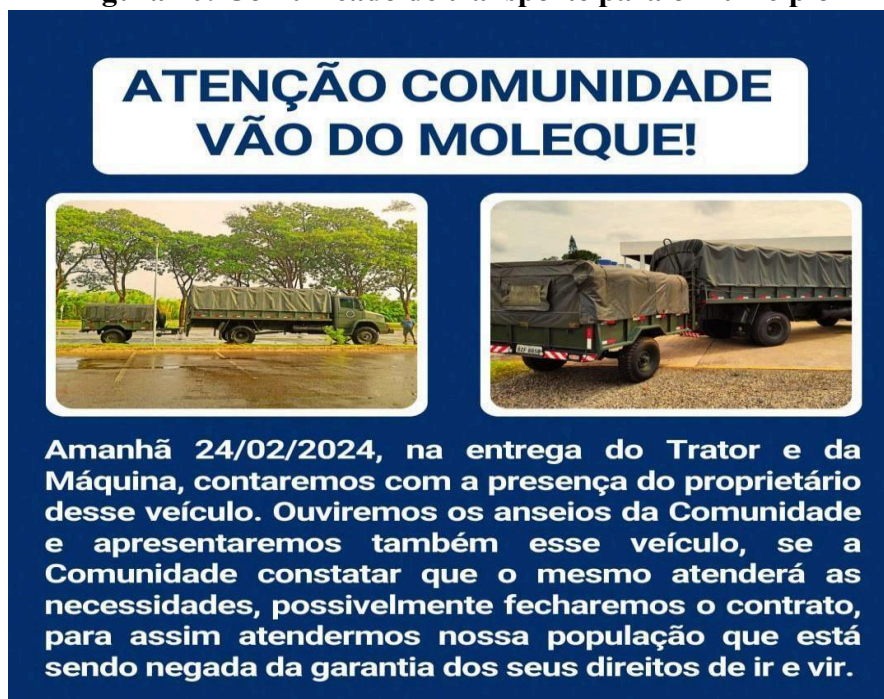
Figura 20: Comunicado de transporte para o município