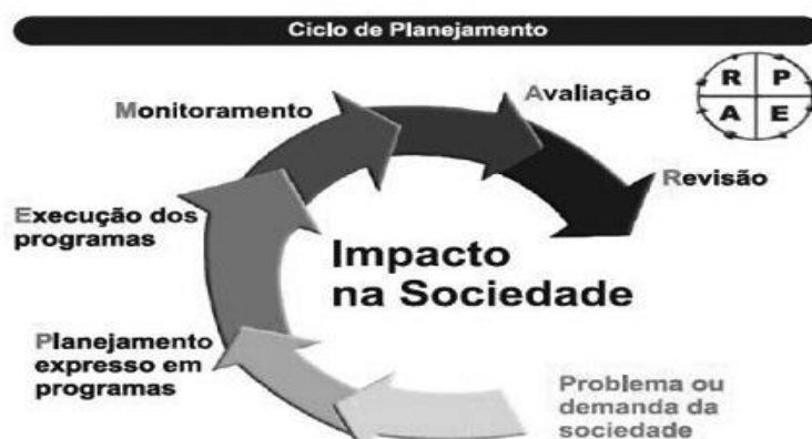
Figura 18: Ciclo de planejamento

Fonte: (Alexandre Melo Medeiros apud Secchi, 2015, p. 53)