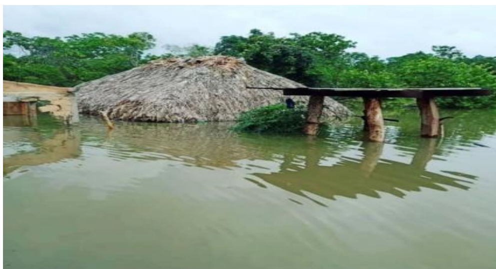
Foto: Quilombo Kalunga, Vão do Moleque, janeiro de 2021.