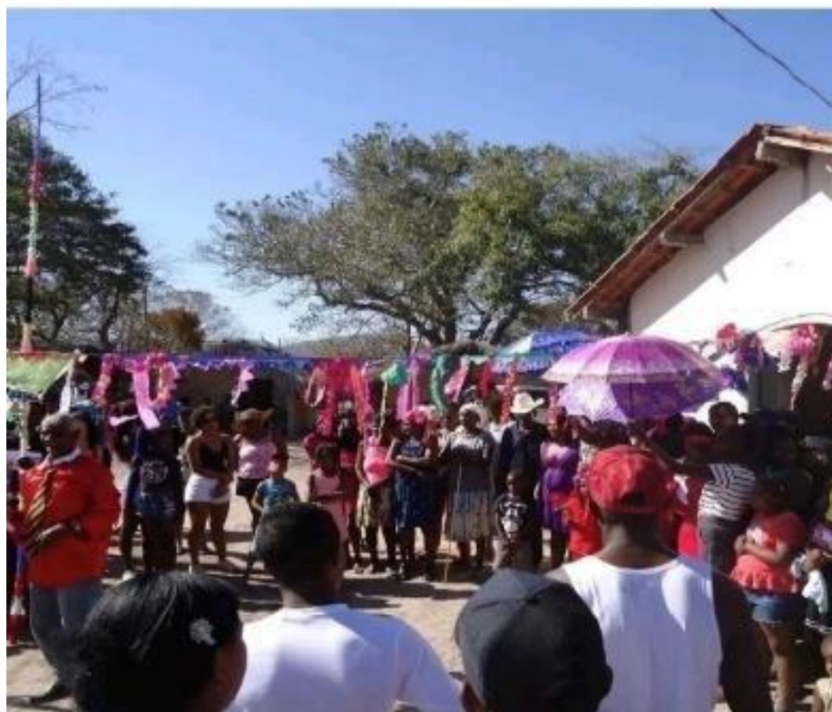
Foto: Festejo Romaria no Vão de Almas. Adaptado pelo autor, agosto de 2022.