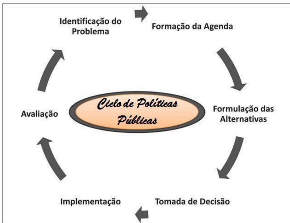
Figura 17: Ciclo de políticas públicas