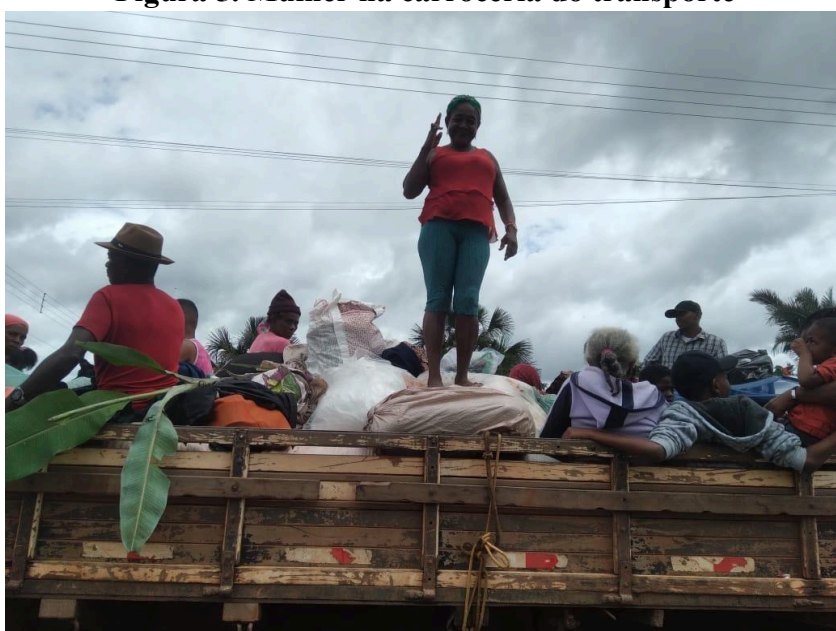
Figura 5. Mulher na carroceria do transporte

17 de dezembro de 2022.