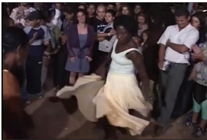
Foto: Festejo Romaria no Vão de Almas. Adaptado pelo autor, agosto de 2022.

Como podem observar nas imagens acima, as comunidades quilombolas Kalunga são