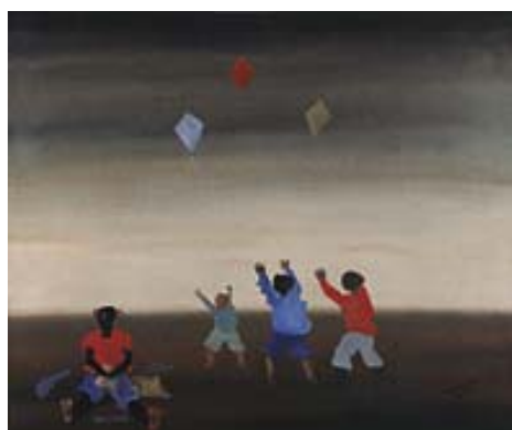
ANEXO U – Meninos Soltando Papagaios