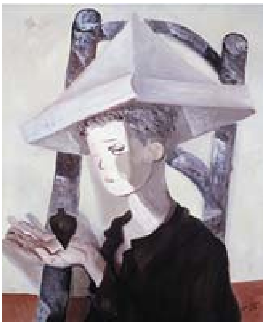
Menino com o Pião - 1947