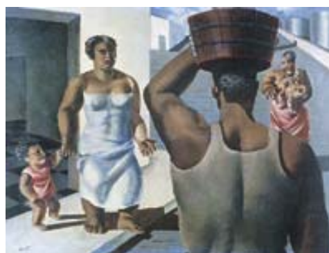
ANEXO M – Sorveteiro