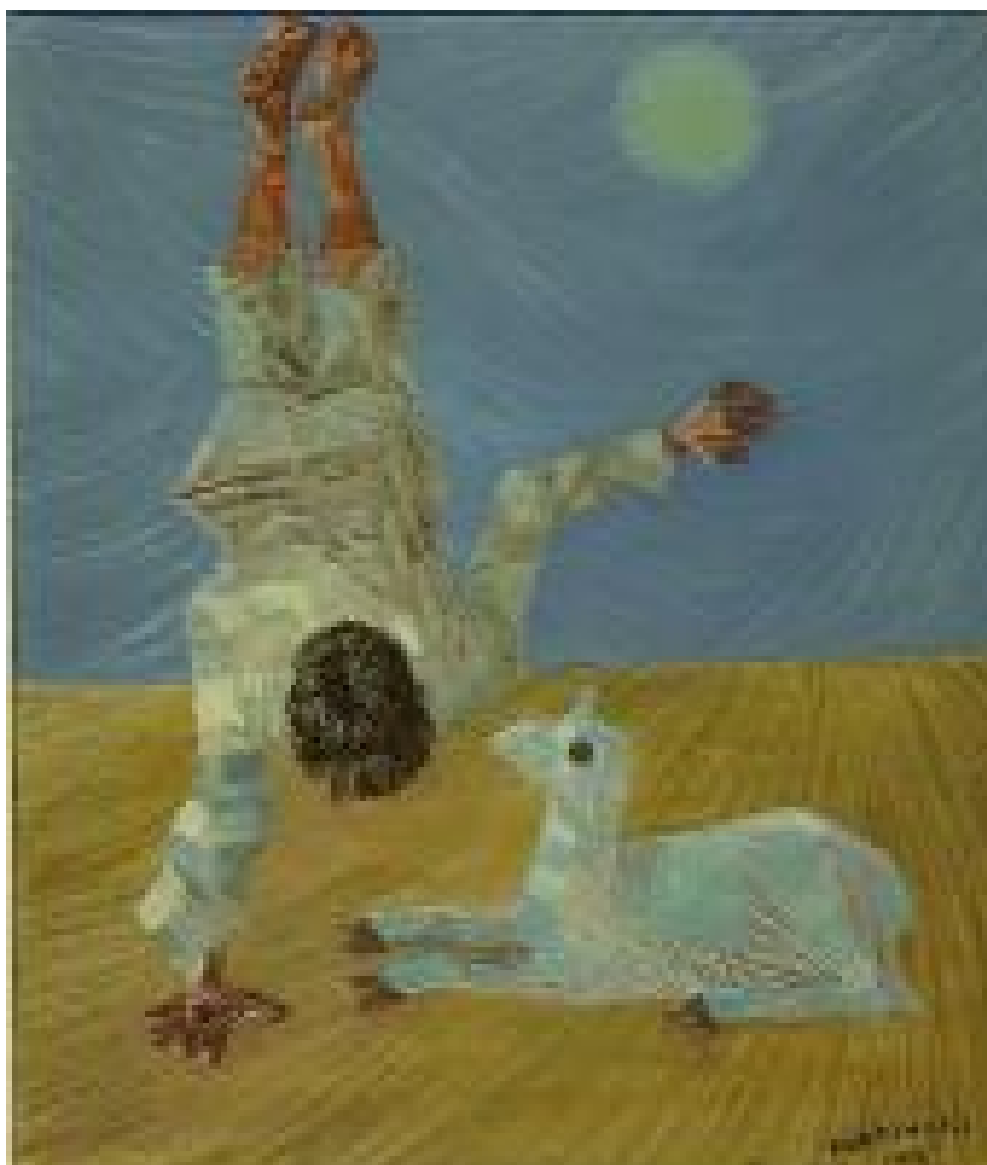
Plantando Bananeira - 1956