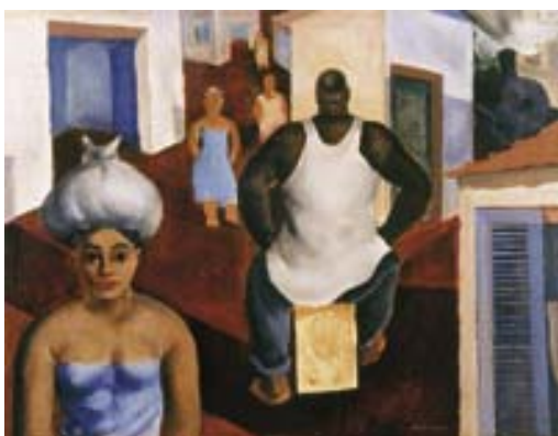
ANEXO L – Estivador