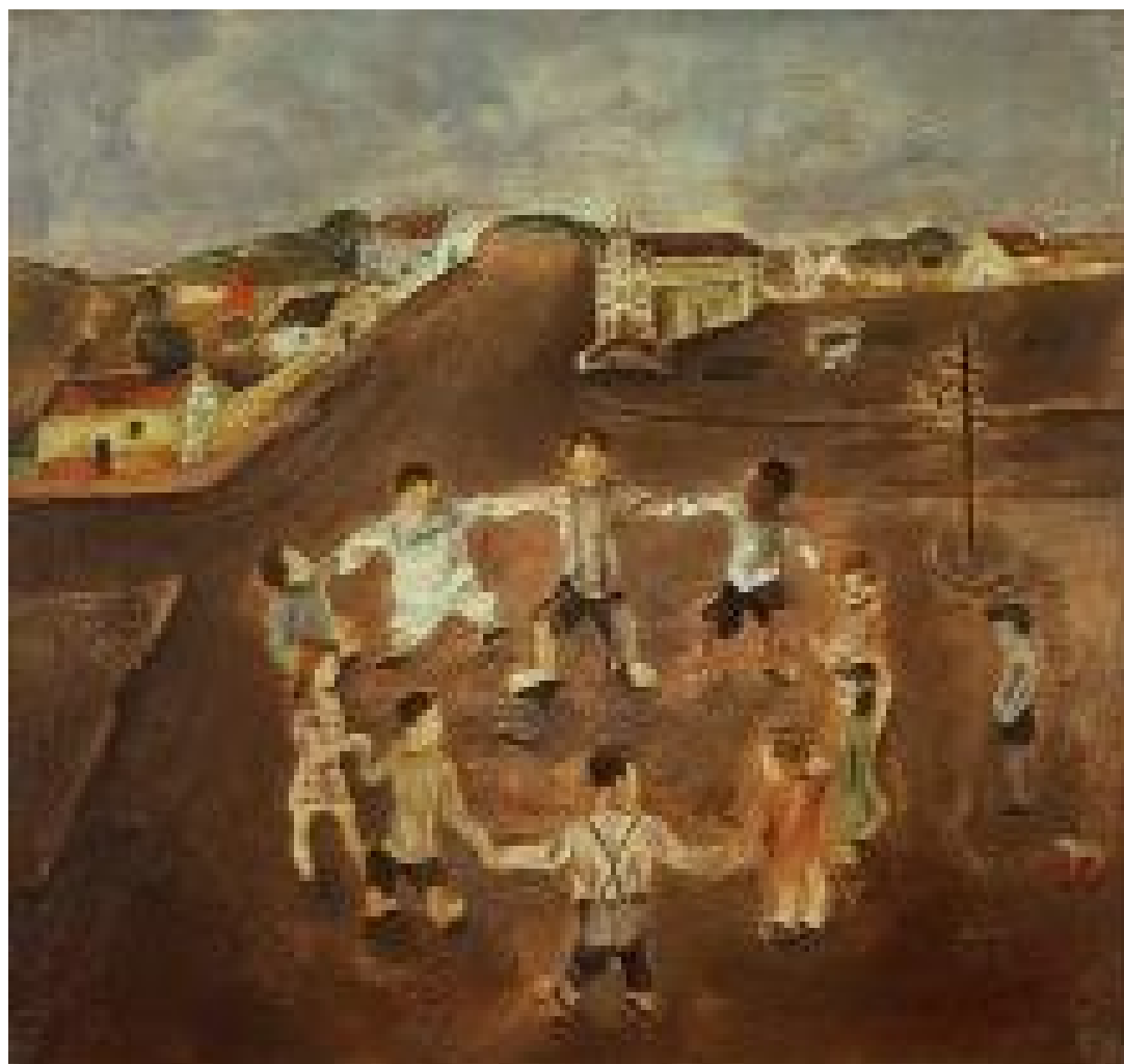
Ronda Infantil -1932