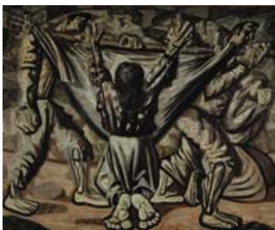
ANEXO Q – Enterro na Rede