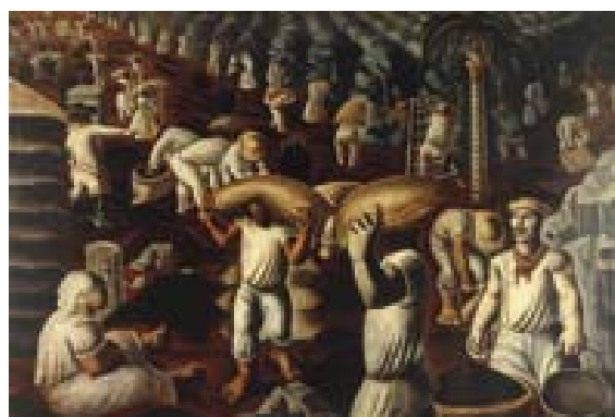
ANEXO O – Café