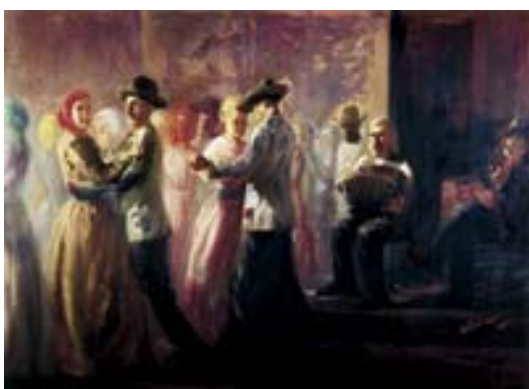
ANEXO F – Baile na Roça