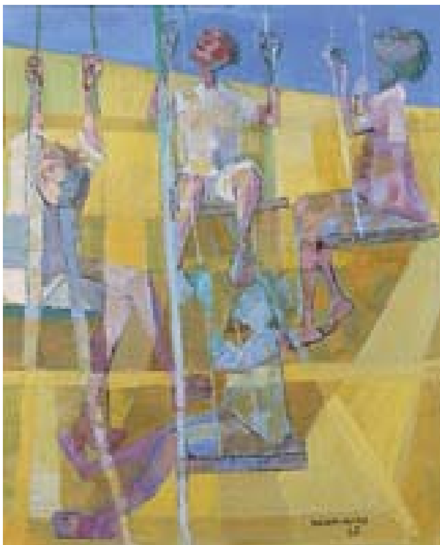
Meninos no Balanço - 1960