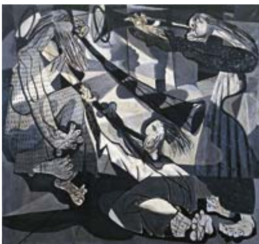
ANEXO J – As Trombetas de Jacó