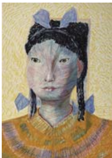
ANEXO Y – Meninas com traças e laços azuis