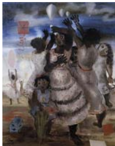
ANEXO S – Grupos de Meninas