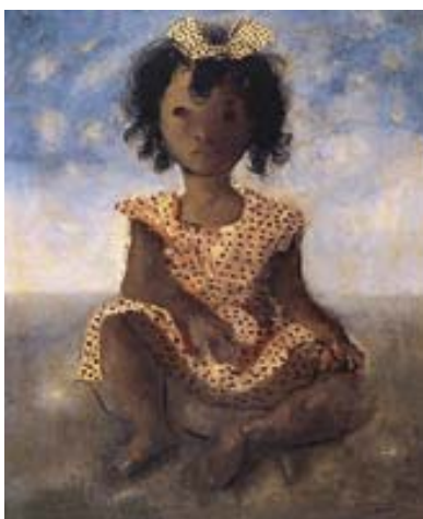
ANEXO R – Menina Sentada