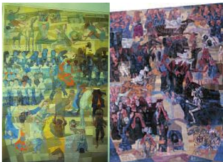
ANEXO B – Painéis Paz e Guerra