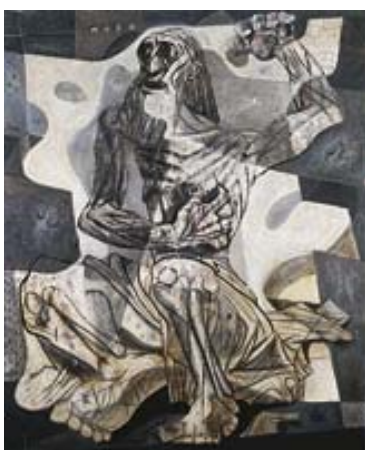
ANEXO H – O Profeta