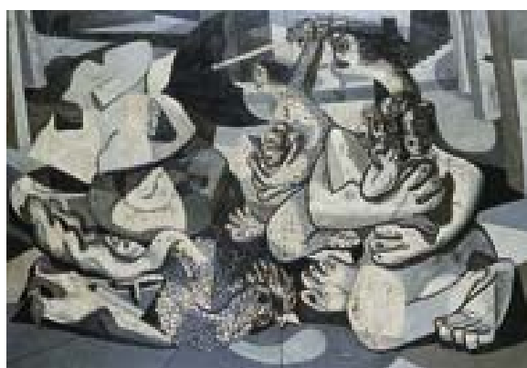
ANEXO I – O Último Baluarte