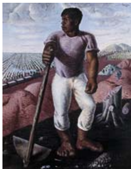
ANEXO K – O Lavrador de Café