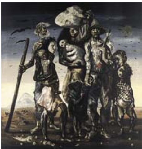
ANEXO P – Retirantes