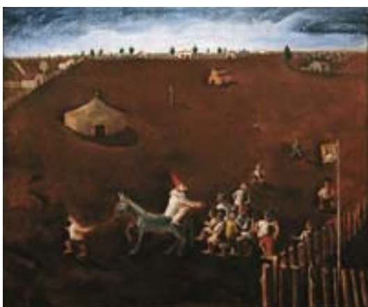
ANEXO D – Circo