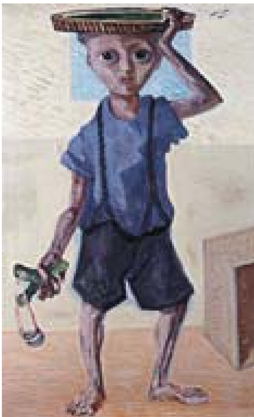
Menino com Estilingue - 1947