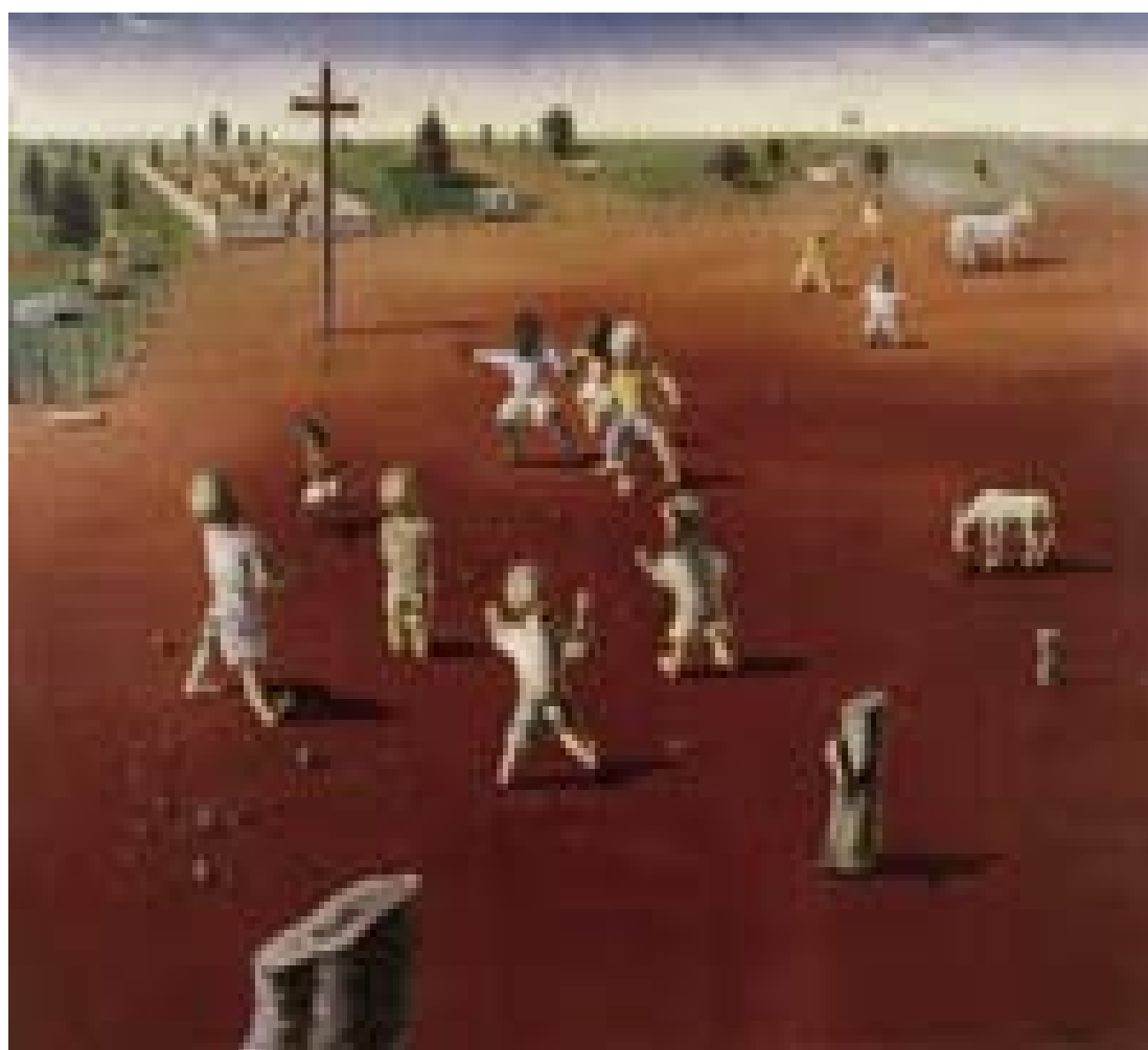
Futebol - 1935