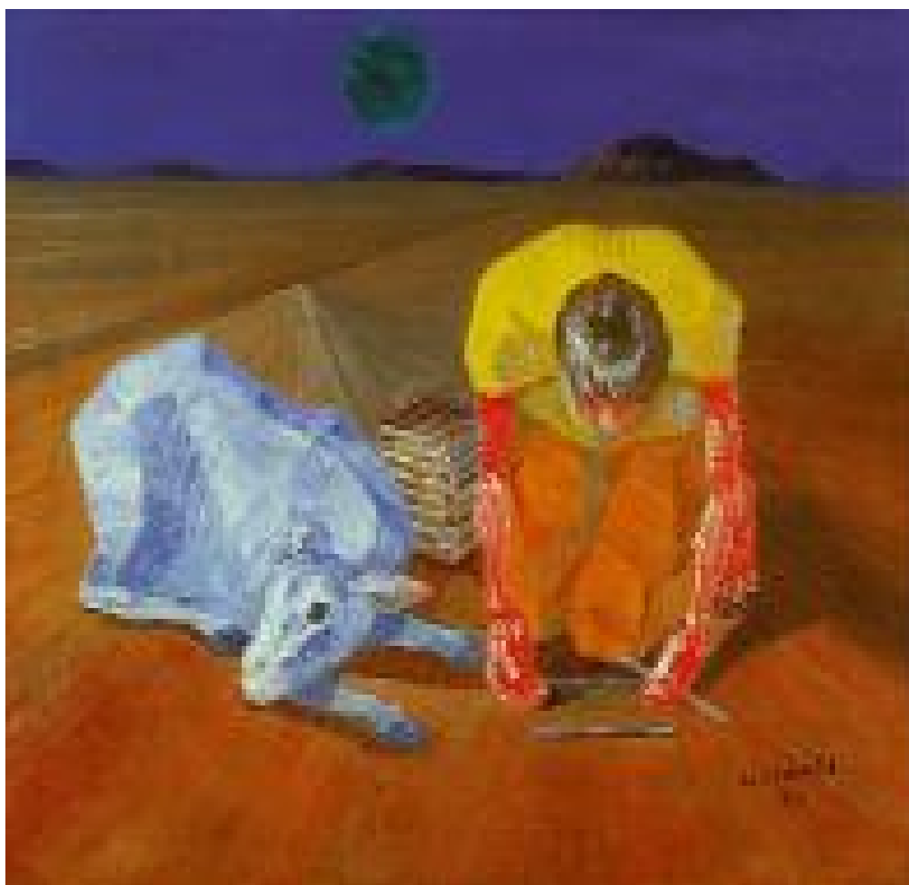
Menino com Carneiro - 1954