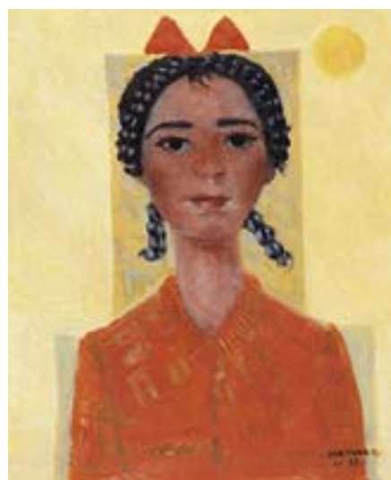
ANEXO Z – Menina com laço