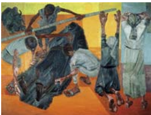
ANEXO V – Preparando Enterro na Rede