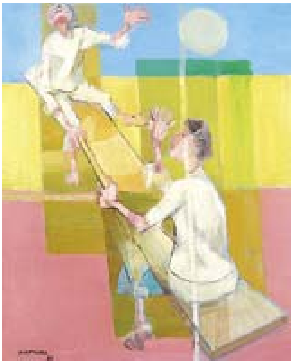
Meninos na Gangorra - 1960