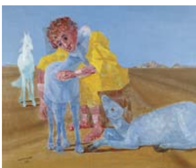
ANEXO A' – Os Carneirinhos