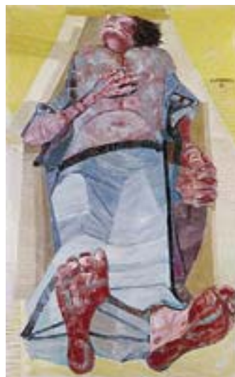
ANEXO X – Retirante Morto