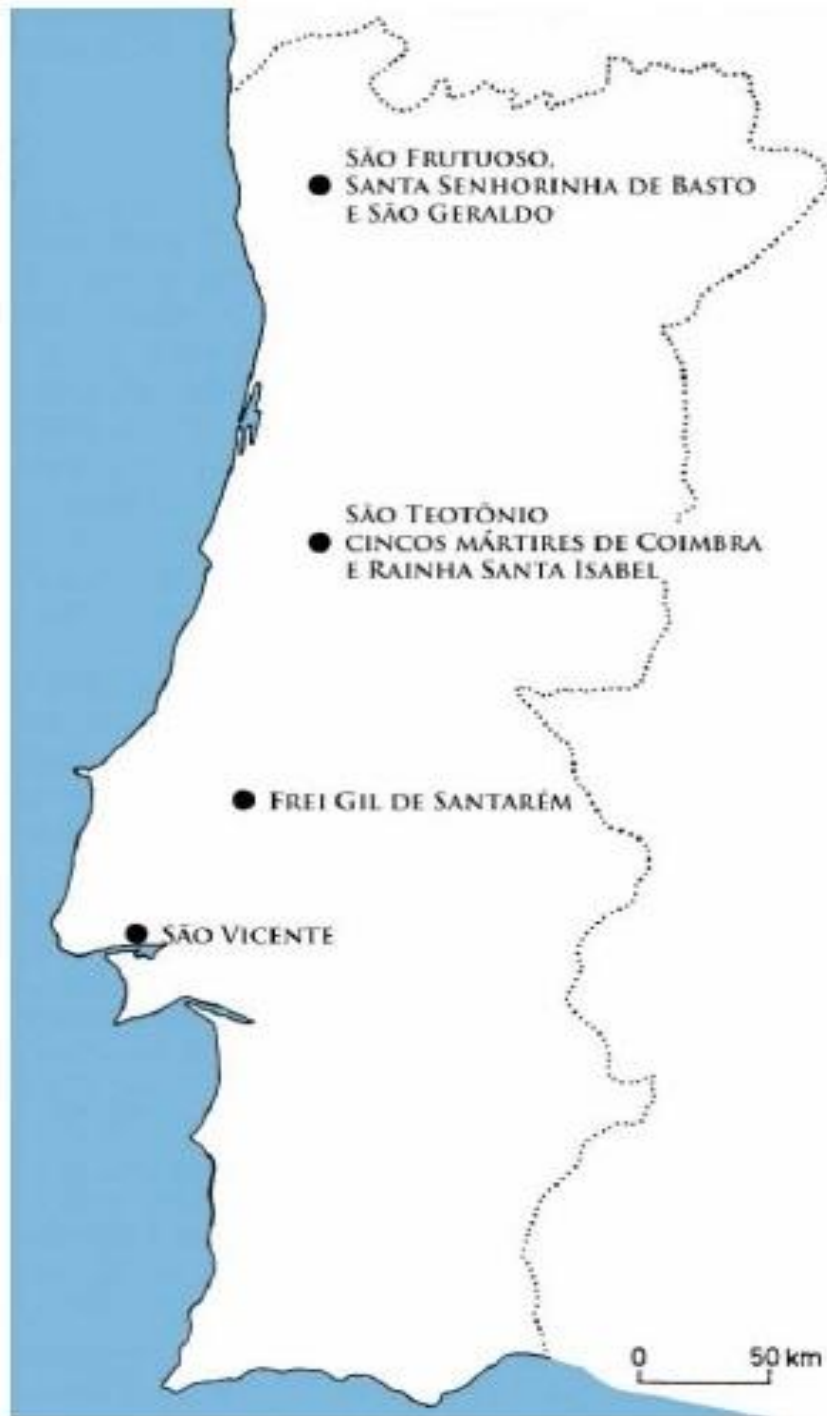
Mapa 01 - Pólos de peregrinação no Portugal medieval

Fonte: MIRANDA, Bruno Soares. Peregrinações portuguesas a Nuestra Señora de Guadalupe . 2011. 119f. Dissertação (Mestrado) - Programa de Pós-Graduação em História Social da Faculdade de Filosofia, Letras e Ciências Humanas. Universidade de São Paulo, 2011, p.43.