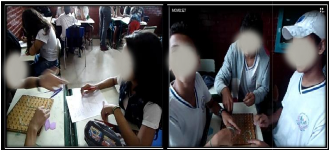
Figura1 – Alunos desenvolvendo atividade com o Geoplano

Em meio a essas dificuldades apresentadas pelos alunos, o professor procurou passar por cada um dos grupos várias vezes, explicando novamente a proposta da atividade, lendo os relatos, perguntando se tudo o que tinham feito estava realmente relatado na ficha, e conduzindo-os a refletir sobre a importância de escrever e contar o que tinham feito, até mesmo para que aprendessem com os próprios erros.