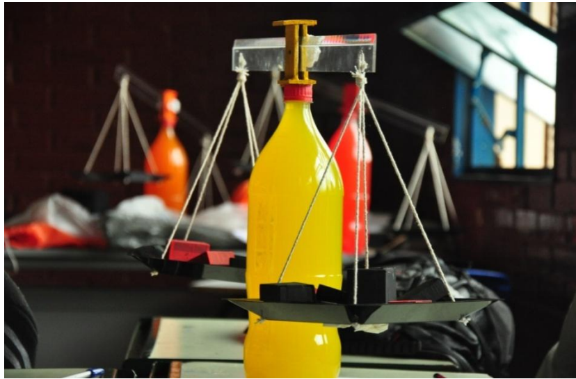
Figura 2 –Balança artesanal confeccionada para o desenvolvimento de atividades envolvendo equações.