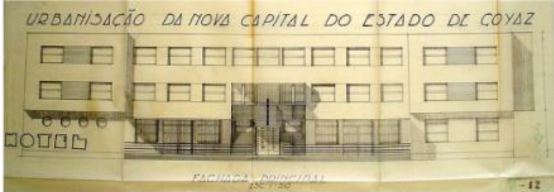
Figura 2 – Projeto original de Attilio Corrêa Lima para o Grande Hotel (1933/1935). Fachada Principal

Fonte: Acervo Família Corrêa Lima apud Diniz (2007, p. 175).