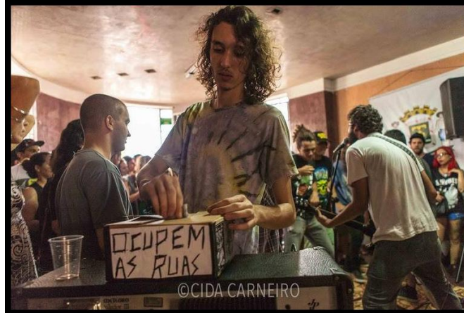
Figura 13 – Evento Ocupem as ruas no Grande Hotel (2016)

O impacto cultural do Ocupem as Ruas foi significativo: além de ressignificar o Grande Hotel como espaço de sociabilidade (Figura 13), o projeto contribuiu para ampliar o repertório cultural da população, estimulando a participação cidadã e o engajamento com práticas culturais diversificadas.