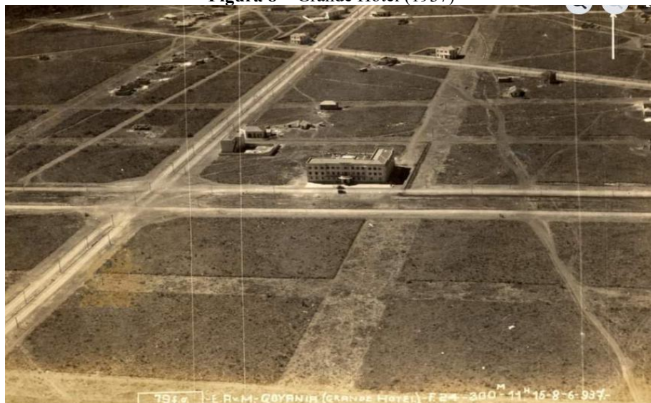
Figura 8 – Grande Hotel (1937)

Assim, o edifício (Figura 8) exemplifica esse conceito, não se destacando apenas como cartão-postal e símbolo arquitetônico que desejava romper com o passado colonial, buscando inserir Goiás na lógica do progresso nacional, mas também como local de convivência social. O Grande Hotel abrigava bailes, festas, encontros políticos e a hospedagem de visitantes ilustres, funcionando simultaneamente como vitrine do projeto urbanístico em desenvolvimento e espaço de interação social, evidenciando a importância da sociabilidade na consolidação da nova capital.