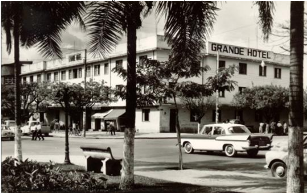
Figura 5 – Grande Hotel (1960)