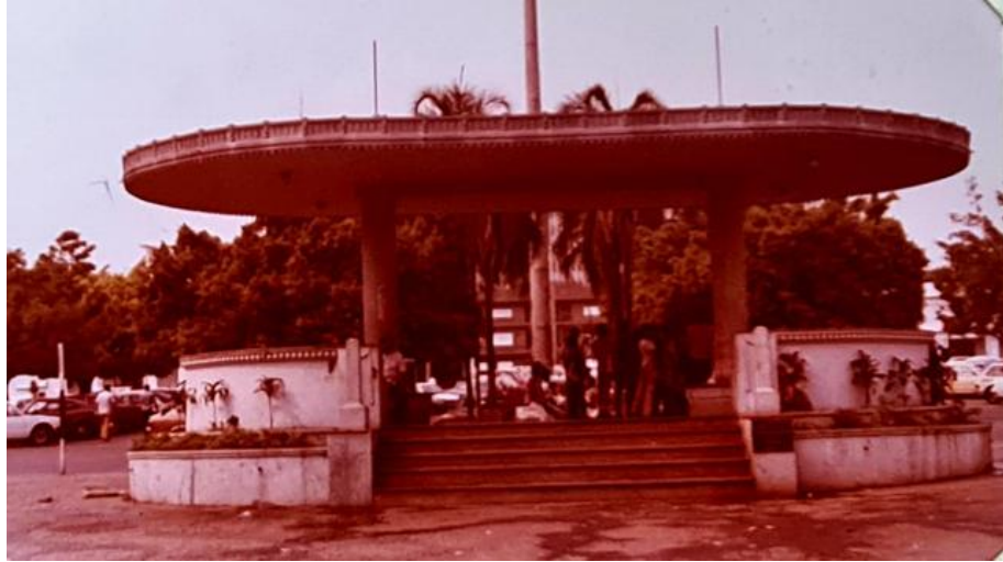
Figura 7 – Coreto da Praça Cívica (1980)