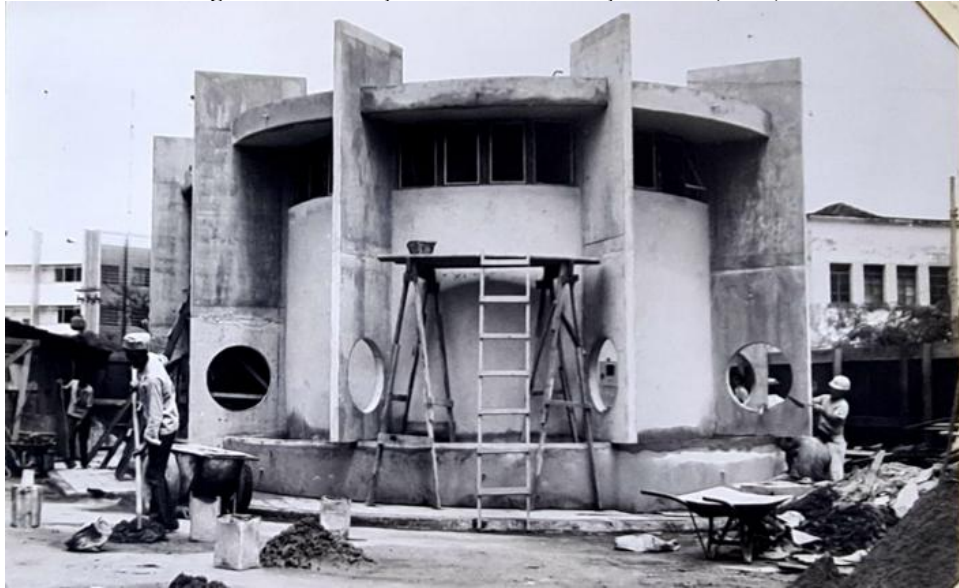
Figura 6 – Mutilação do Coreto da Praça Cívica (1975)