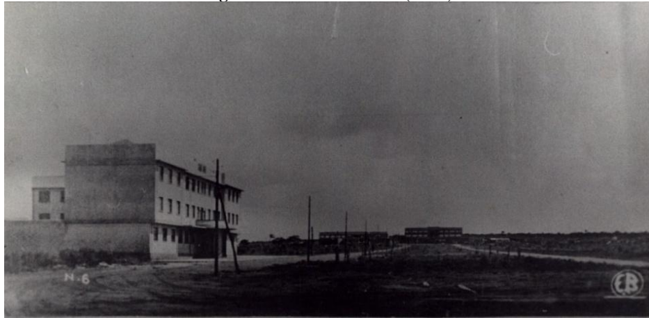
Figura 1 – Avenida Goiás (1936)