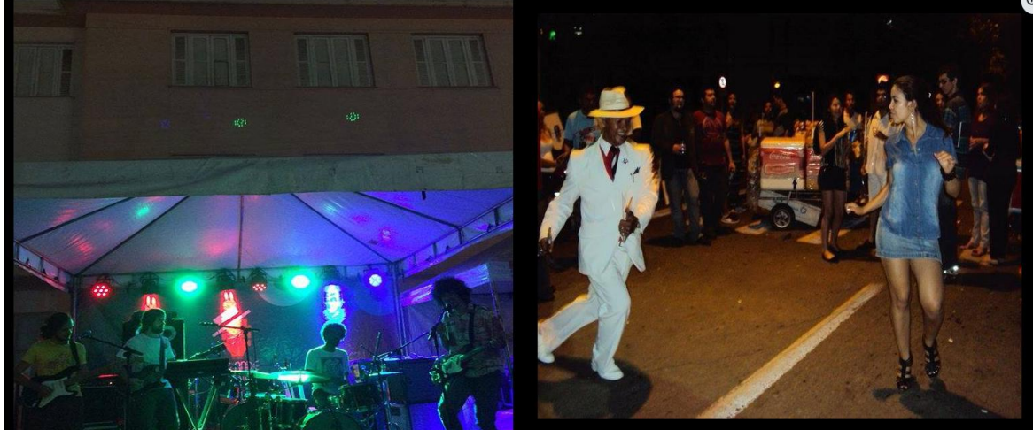
Figura 11 – Grande Hotel vive o Choro (2018) – (A) Apresentação da banda Boogarins (B) Público no evento

O Chorinho (Figura 11) pode ser compreendido como uma prática cultural acessível e inclusiva, marcada pela gratuidade e pela ausência de restrições à participação. Ao possibilitar que qualquer pessoa acompanhasse as apresentações, o projeto reforçava dimensões coletivas e democráticas da experiência musical. Embora o nome remeta a um gênero específico, o projeto acolheu outros estilos e promoveu artistas locais por meio da iniciativa.