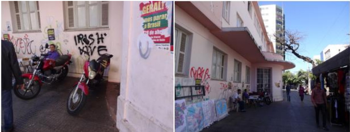
Figura 14 – Grande Hotel — Parte externa (2017)