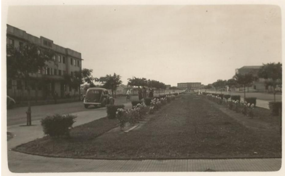
Figura 9 – Avenida Goiás [c. 1940]