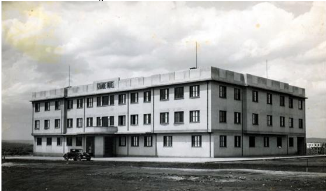
Figura 3 – Grande Hotel – edifício finalizado