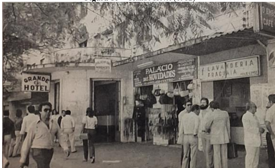
Figura 10 – Grande Hotel (1982)

Segundo Williams (1979), essa fase do Grande Hotel pode ser compreendida a partir das categorias de cultura que ele propõe. O dominante ainda se manifestava no prestígio do edifício como cartão-postal da cidade. O emergente se revelava nas novas formas de uso, mais práticas e menos simbólicas, como o aluguel a terceiros e a subdivisão em lojas (Figura 10), que incorporaram o prédio ao cotidiano urbano. Ao mesmo tempo, persistia o residual, expresso nas lembranças e narrativas dos primeiros anos de glória, evocando o prestígio inicial do hotel mesmo quando este se tornava menos evidente.