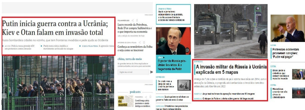
Figura 2 - Área de coleta do corpus nos portais jornalísticos