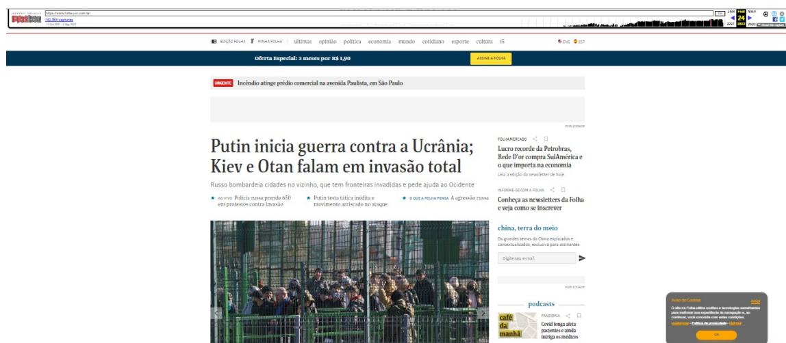
Figura 1 - Registro de página do WayBack Machine

As matérias do corpus foram coletadas por meio do repositório disponibilizado pelo sítio eletrônico WayBackMachine . Segundo Santos (2015), o sítio é uma ferramenta disponibilizada pelo portal Internet Archive , uma entidade sem fins lucrativos que, desde 1996, compila atualizações diárias de diversas páginas da internet. Segundo o acadêmico, a ferramenta é particularmente útil para a pesquisa na área do ciberjornalismo, já que a quantidade de informações disponibilizadas nos bancos de dados dos veículos digitais é extensa e seus portais estão sujeitos a atualizações constantes. Ainda, as páginas arquivadas no WayBackMachine registram visualmente os portais no momento da coleta, permitindo a visualização de sua estética e, no caso de veículos jornalísticos, a hierarquia visual das matérias, conforme Figura 1.