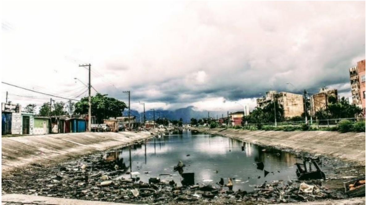
Figura 7. Canal do fundo, hoje sem barracos.

(Circular). Último beco à esquerda, sentido canal e maré, este que hoje virou a rua do canal, a rua do lado de cá (sentido insular) do canal, com calçada e tudo. Na foto abaixo se vê tal canal, da rua 8 em direção à Alcides, o lado em direção insular é o direito da imagem, e o lado em direção à Maré é o esquerdo. Todo esse canal era coberto/ocupado por barracos, e essas ruas não existiam, até pelo menos 2004-2005.