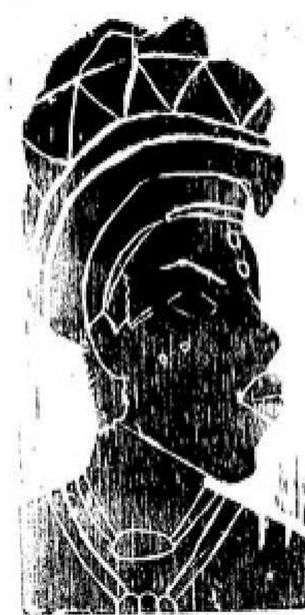
Figura 12. Xica Manicongo