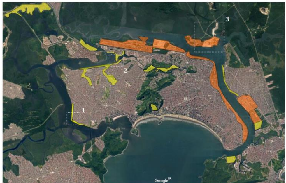
Figura 5: Imagem de satélite da Ilha de São Vicente e arredores com marcação de áreas de moradias sem saneamento básico (amarelo) e áreas portuárias (laranja).