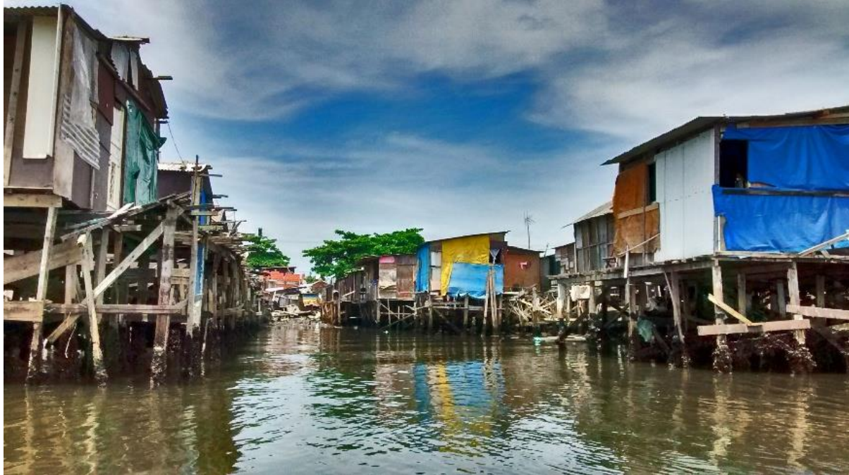
Figura 1. Maré, o Mar Pequeno passando ao fundo da Ilha de São Vicente-SP.