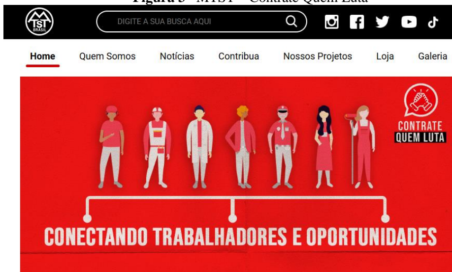
Figura 3 –MTST – Contrate Quem Luta

O Contrate Quem Luta (CQL) é uma iniciativa que visa conectar trabalhadores(as) sem-teto a oportunidades de trabalho. A plataforma representa uma ponte revolucionária que une profissionais cadastrados nos territórios de atuação do MTST a clientes em busca de serviços na construção civil, manutenção, tarefas domésticas e diversas outras áreas.