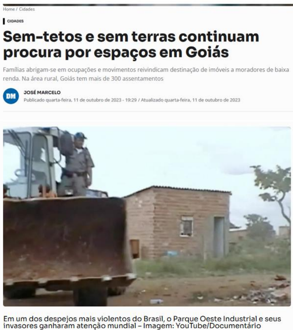
Figura 2 – Notícia publicada no Diário da Manhã sobre atuação do MTST