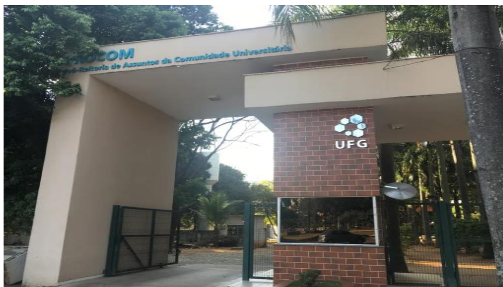
Imagem 13: Atualmente, entrada da Universidade Federal de Goiás – UFG, no setor central.