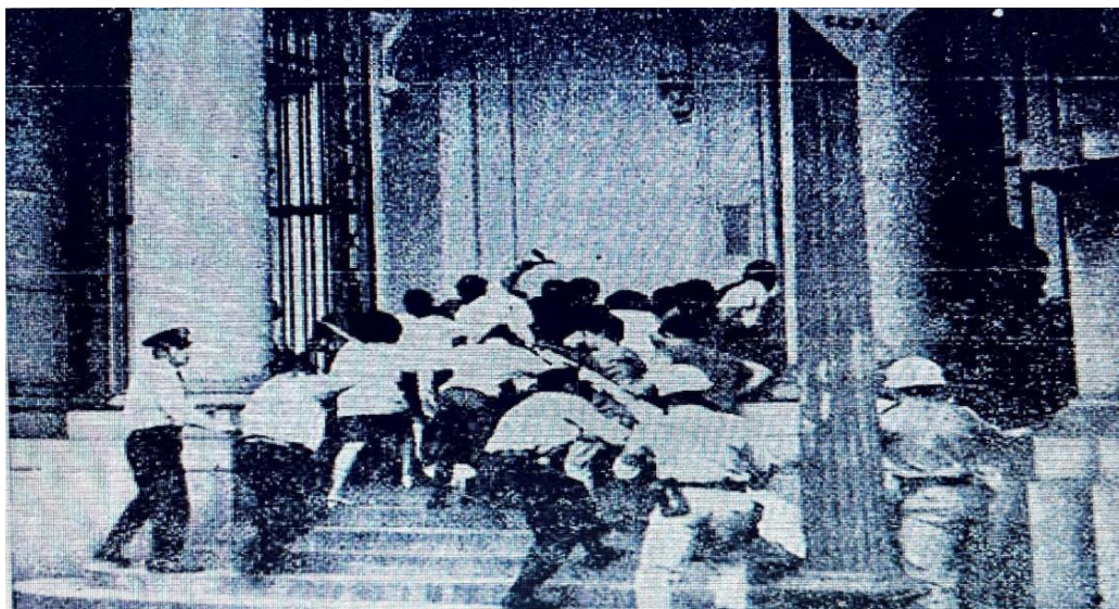
Imagem 4- Perseguidos por cassetetes até mesmo na Catedral, os estudantes gaúchos, ao sair, decretam a greve geral.

Fonte: Jornal do Brasil, Rio de Janeiro, 13/05/1967, 1º Cad., p. 7. 53