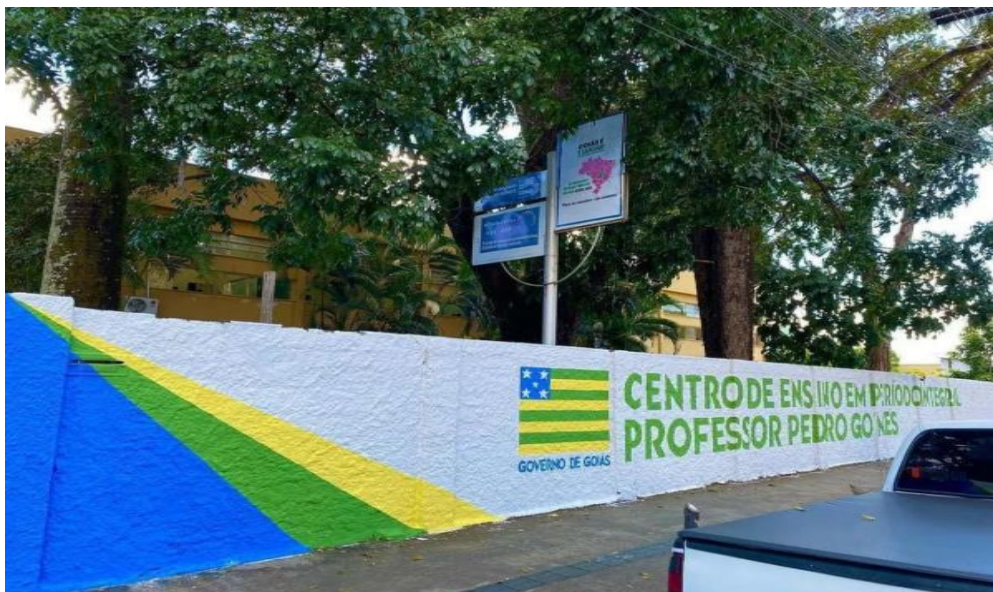
Imagem 10- Atualmente, entrada do CEPI- Centro de Professor Pedro Gomes.