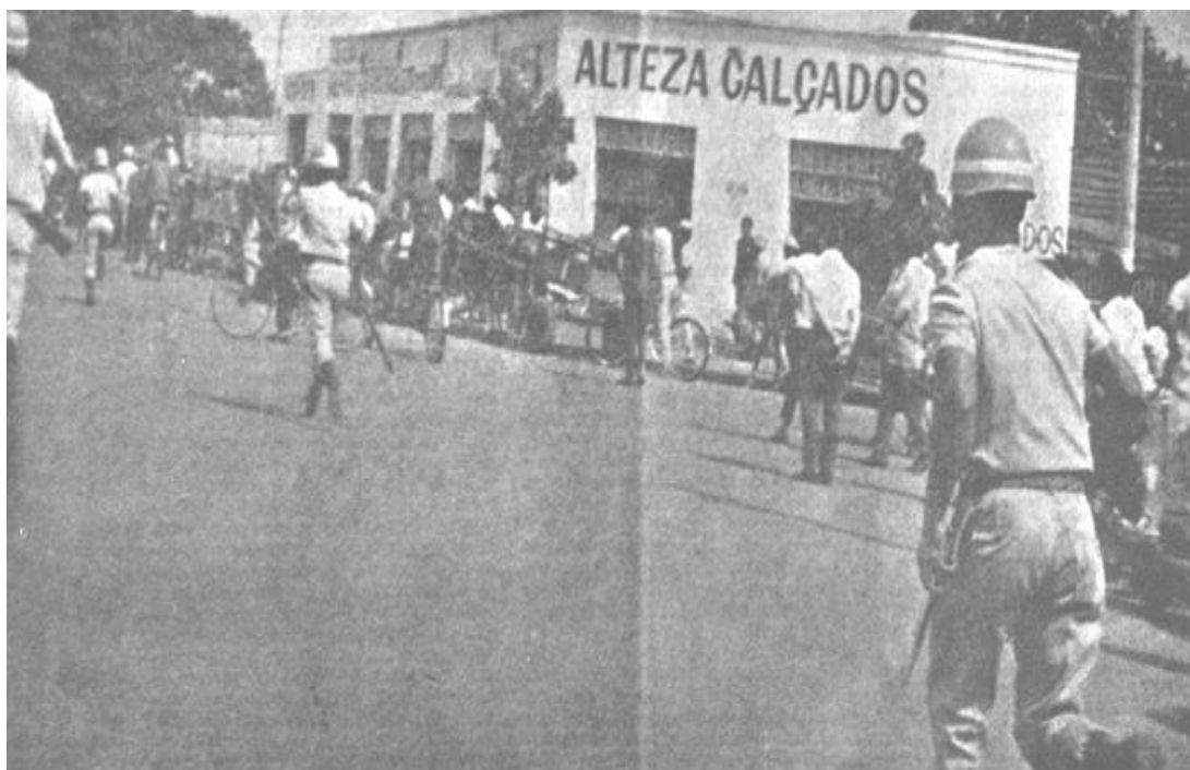
Imagem 1 – Policiais perseguem estudantes no centro da capital goiana.

Quanto à observação de Keides Vicente (2006), a rua é vista pelos ex-militantes, estudantes e jovens universitários como um espaço de fuga, protesto e manifestação. Em alguns casos, ocorriam confrontos com a repressão policial. A fotografia a seguir flagra policiais em perseguição a estudantes.