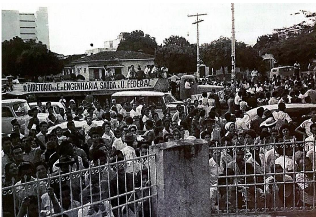
Imagem 11: Estudantes em apoio à criação da UFG, na Praça Cívica em 18/12/1960.