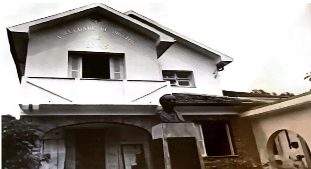
Imagem 12: Sede da Faculdade de Direito em Goiás, de 1937 a 1966- Rua 20, nº 17, setor central. Década de 60- Sé. XX.