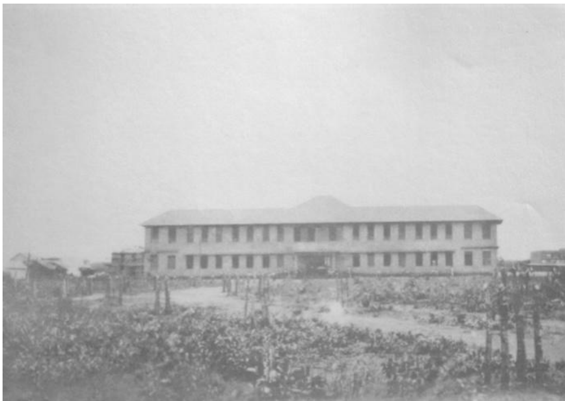
Imagem 7- Em 1937, foi registrado o progresso das obras de construção do prédio do Liceu. 72