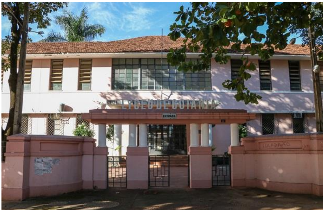
Imagem 8- Atualmente, entrada do CEPI- Centro de Ensino em Período Integral Lyceu de Goiânia.