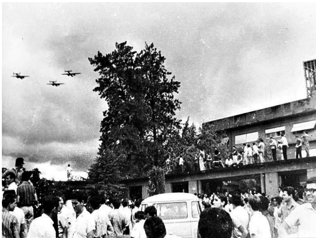
Imagem 3- Ameaça de bombardeio e Praça Cívica lotada, com caças em voos rasantes para pressionar e aterrorizar o governador Mauro Borges e a multidão que se aglomerou em apoio a esse governo.