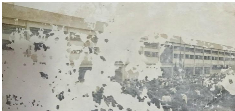
imagem 9- Prédio próprio do Colégio Estadual Professor Pedro Gomes, em imagem de 1966.

75