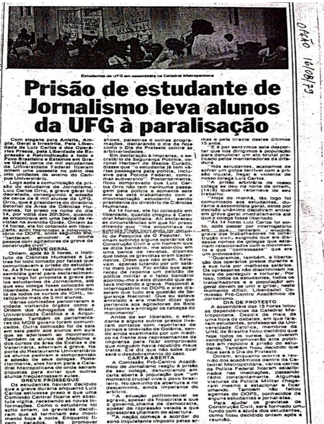
Imagem 2- Prisão de estudante de Jornalismo leva alunos da UFG à paralisação.

20