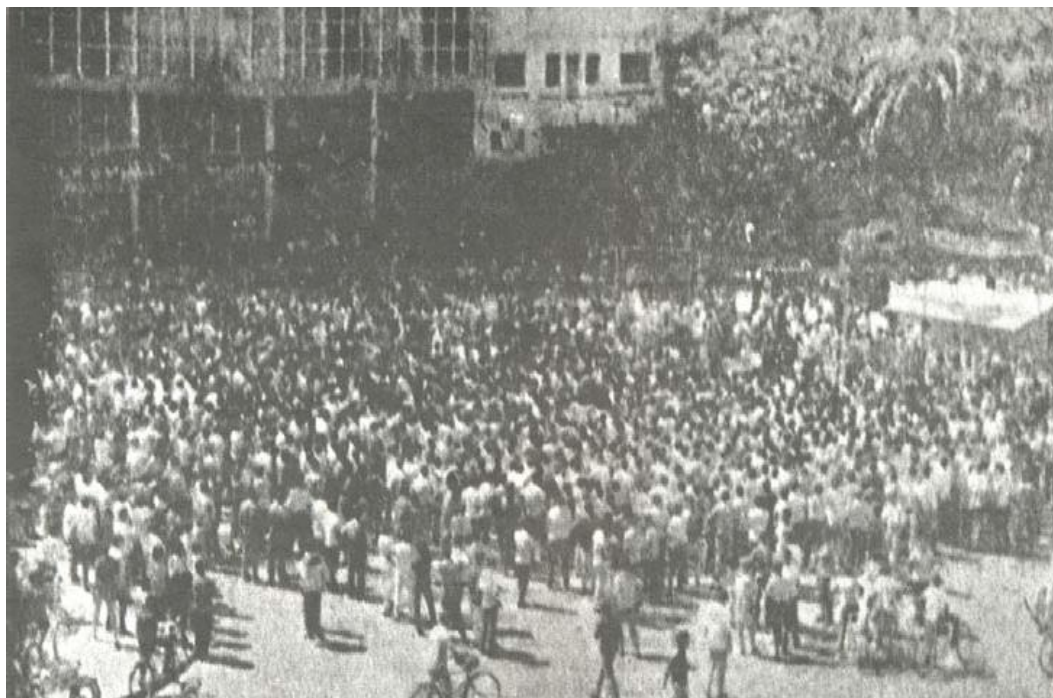
Imagem 6 – Praça dos Bandeirantes tomada por estudantes.