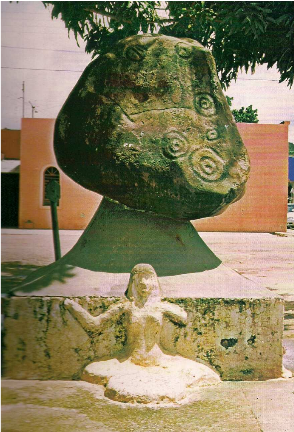
FIGURA 4: Pedra S. S. Arraya – Marco inicial de Barra do Garças (VARJÃO, 199-?, p. V)