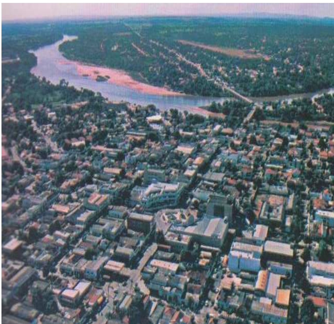
FIGURA 3 – Vista Aérea de Barra do Garças – MT (VARJAO, 199-?, p. IV).

pousou na localidade, denominada por ele de Aragarças, e inaugurou o “marco zero” da Expedição. Em seguida, em 4 de outubro de 1943, sob orientações desse ministro, o presidente Vargas criou, sob o decreto n°. 5.878, a Fundação Brasil Central. A este órgão foi delegada a missão daquela expedição e, também, desbravar e colonizar as regiões do Brasil Central e Ocidental, ou seja, as dos altos rios Araguaia e Xingu (idem).