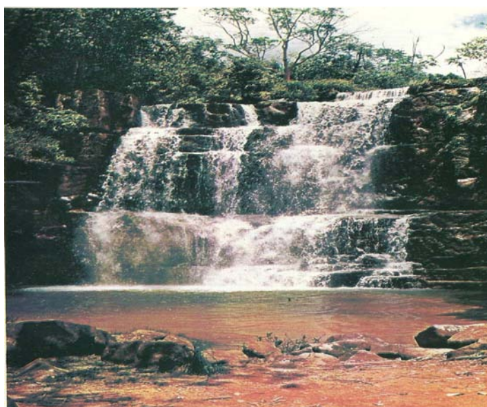
FIGURA 5: Cachoeira do Parque Serra Azul (VARJÃO, 199-?, p. XV).

O Parque Estadual da Serra Azul é narrado por Varjão como lembrança de um lugar utilizado pelos indígenas, e, ao mesmo tempo, como atrativo turístico da cidade. Trata-se de um espaço muito frequentado pela população local e por turistas – devido às cachoeiras, mirante e discoporto – que Varjão rememora em sua literatura e faz reaparecer na memória do leitor a lembrança de experiências que este vivenciou nesse lugar.