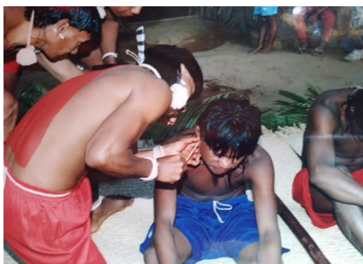
FIGURA 13: O ritual xavante de furação de orelha (Dapõ' redzapu).

Foto: Me. Salvador – Salesiano Dom Bosco (SDB), 2005.