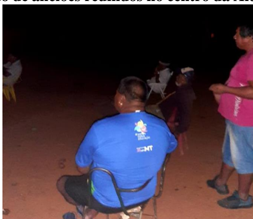
FIGURA 4: Foto de anciões reunidos no centro da Aldeia Sangradouro – MT.

Quando eu era criança e tinha entre um e quatro anos de idade, primeiramente, eu aprendi a falar a língua materna. Naquele tempo, comecei a ouvir os gritos dos pássaros, o som da água, dos ventos balançando as árvores iluminadas à noite pelo brilho das estrelas. Na mesma época, também escutava os anciões conversando sobre a história antiga de nosso povo. Abaixo, reproduzo foto de um exemplo de situação em que os anciões se reúnem no centro da aldeia: