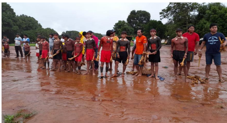
FIGURA 12: Adolescentes e seus padrinhos dos clãs Öwawe e Pö´redza´õnõ do grupo: Nõdzo´u e Tsada´ró.