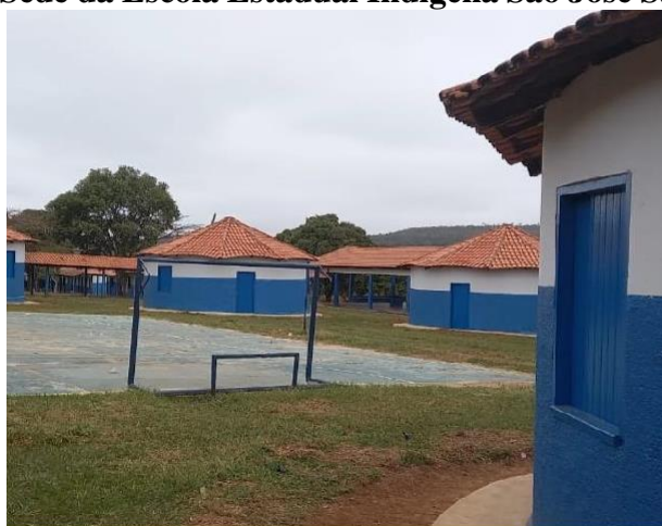
FIGURA 15: Sede da Escola Estadual Indígena São José Sangradouro em 2022.