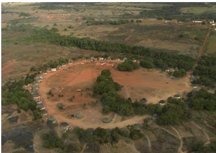
FIGURA 3: Vista aérea da Aldeia Sangradouro-MT.

Fonte: Foto de Divino Tserewahu Tsereptsé , 2001.