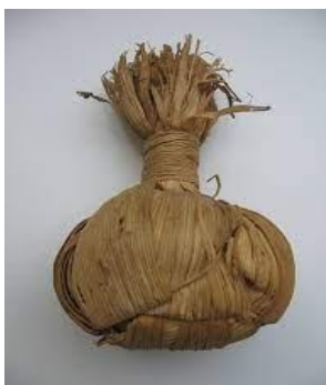
FIGURA 6: Tóbda'é (peteca): brinquedo muito apreciado pelas crianças e que faz parte da cultura Xavante.

Na cultura do povo Xavante, como eu já disse, existe uma brincadeira que se chama tóbda'é . Trata-se de um jogo de peteca, um brinquedo que usamos no jogo tradicional do povo e esse é considerado o jogo das crianças. Ele é muito valorizado na cultura do povo Xavante. Essa brincadeira das crianças é muito importante para todos nós e é para passar para a nova geração. Para o jogo, a peteca é confeccionada com a palha do milho, a folha seca lisa, que se chama wa'rudumhö nōdzö , o milho Xavante. Veja a foto, a seguir: