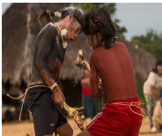
FIGURA 9: ói´ó (luta de raiz praticada na infância pelos meninos Xavante).