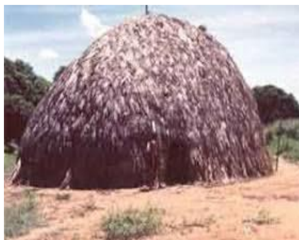
FIGURA 14: Sede da Escola Estadual Indígena São José Sangradouro em 1994.