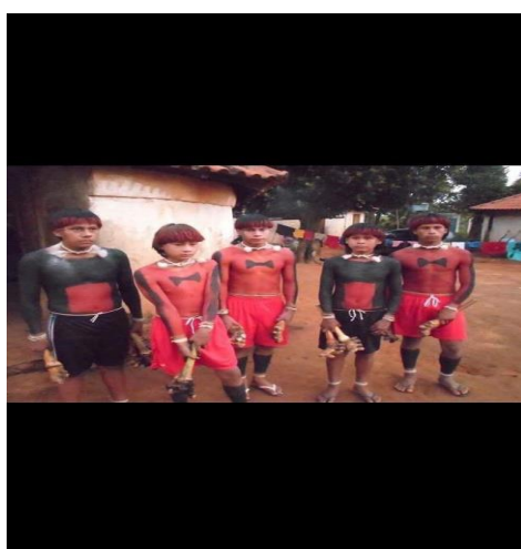
FIGURA 11: Clã: Öwawe - Grupo: Anãrówa e Abare´u.

respeitado e considerado cuidadoso da aldeia, porque toda a comunidade considera o espaço dos dirigentes da festa, juntamente com os padrinhos. Por isso, é muito importante para nós falarmos da casa dos adolescentes . Dentro dela, não dormem meninas, só os padrinhos dormem juntos com os wapté (adolescentes). A seguir, na Figura 10, temos a imagem de cinco representantes do clã Öwawe , pertencentes ao grupo Anãrówa e Abare´u , os quais estavam na casa de adolescente Hö :