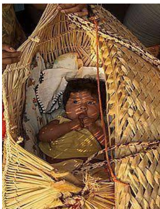
FIGURA 8: Criança do clã Öwawe

Quando eu era criança, meu pai sempre me passava raízes e às vezes bebia e passa no para adquirir força de guerreiro para ficar mais corajoso. É da cultura Xavante: quando uma criança nasce, o pai tem que passar raízes para ela adquirir forças de guerreiro. Dos 0 aos 5 meses, essa criança está no ciclo da fase como clã owawe ou clã po´redza´õnõ :