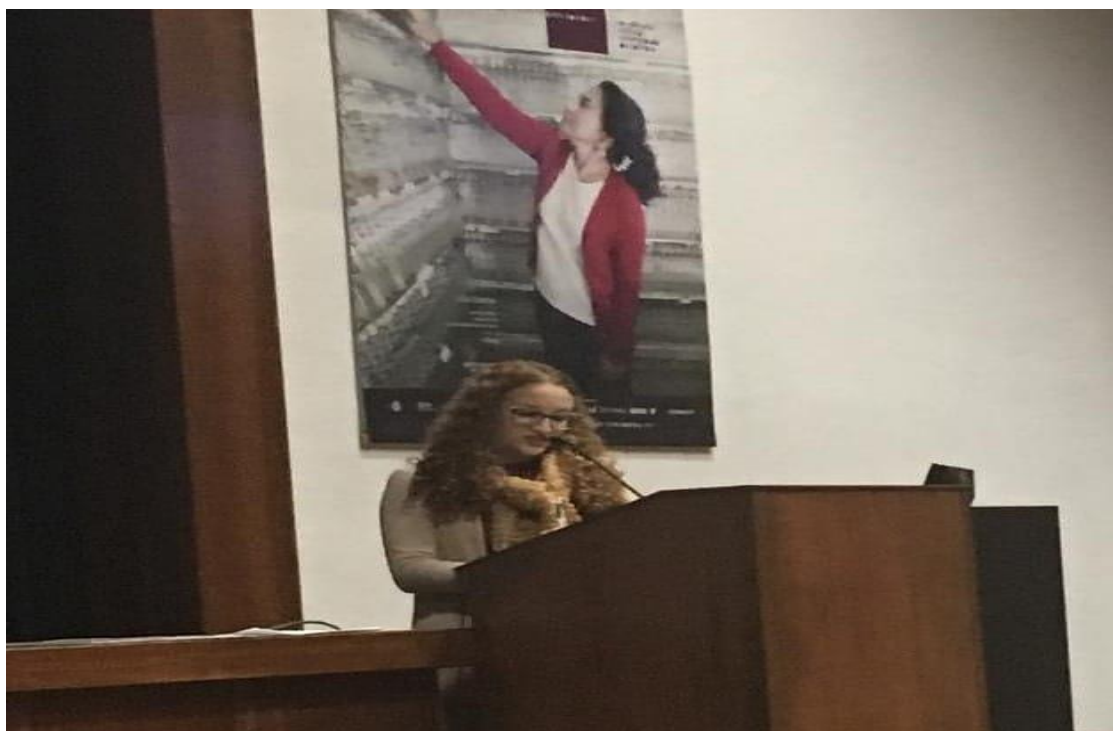
Figura 5 - Apresentação do artigo “Arte e Denúncia do Conflito na Obra de Pedro Tierra”, da autora, dentro da temática quilombola, no IV Congresso Internacional de Direitos Humanos de Coimbra, Portugal. Refletindo colonialidades.

A partir disso, façamos essas reflexões: E hoje, os negros são livres? Os Povos colonizados são livres? Ainda existe criminalização por racismo? O que a colonização escravista, capitalista, racista e patriarcal causou nos territórios dominados?