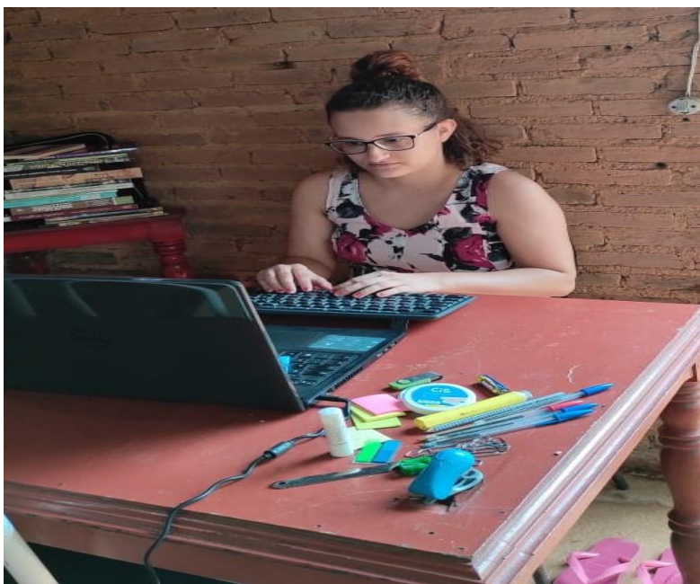
Figura 9 - Cenário de escrita, Quintal dos pais da autora, Cidade de Goiás-GO.

Os Kalunga são um Povo da terra, que não se resume a trabalhadores rurais negros ou comunidade negra descendente de pessoas escravizadas. O Quilombo Kalunga é lugar de re-existências, lutas e moradia. Lugar de memória histórica, identidade e cultura. É uma comunidade com cultura própria, ao contrário da sociedade de classes, vivendo práticas que contrariam o sistema colonialista/moderno/capitalista (BAIOCCHI, 2013).