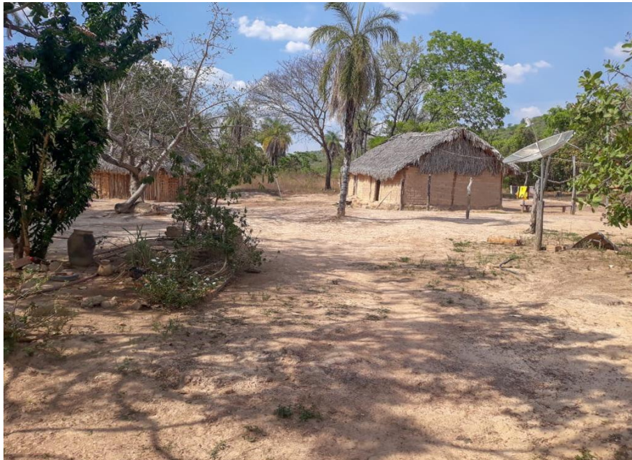
Figura 1 - Comunidade Kalunga, Núcleo Diadema, Teresina de Goiás-GO.

GRATIDÃO AO POVO KALUNGA, EM ESPECIAL, ÀS MULHERES E HOMENS DOS NÚCLEOS EMA, DIADEMA, ENGENHO II E VÃO DO MOLEQUE, CUJA LUTA E REEXISTÊNCIAS SÃO A RAZÃO DE SER DESSE TRABALHO.