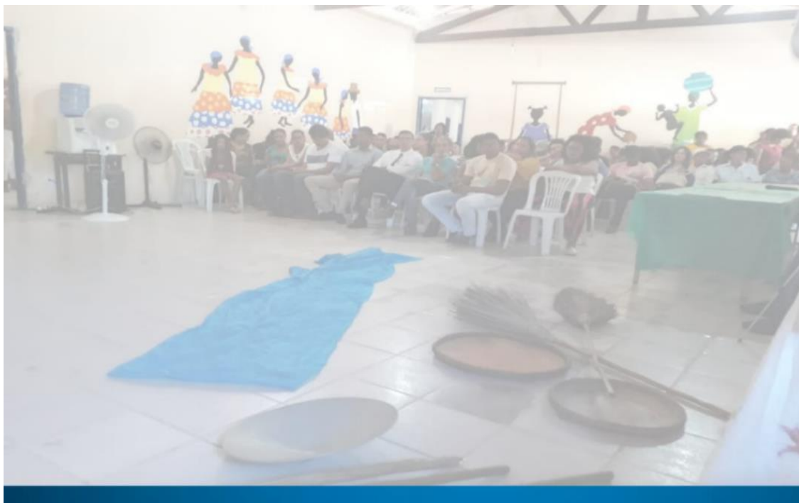
Figura 8 - Assembleia de votação do Regimento Interno da Associação Quilombo Kalunga (AQK).

Como capítulo que traz sobre o que é Ser Kalunga, os principais conflitos internos e externos em que esse Povo está envolvido na atualidade, bem como o direito de consulta e consentimento e a construção de seu protocolo de consulta, também pretende, sobretudo, dar voz àquelas e àqueles que são as sujeitas e os sujeitos protagonistas da História: as e os Kalunga.