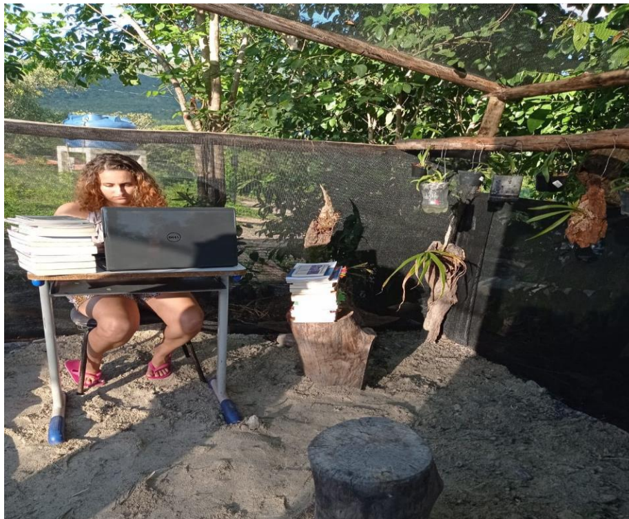
Figura 7 - Cenário de escrita, Orquidário, Chácara Três Palmeiras, Cidade de Goiás-GO.