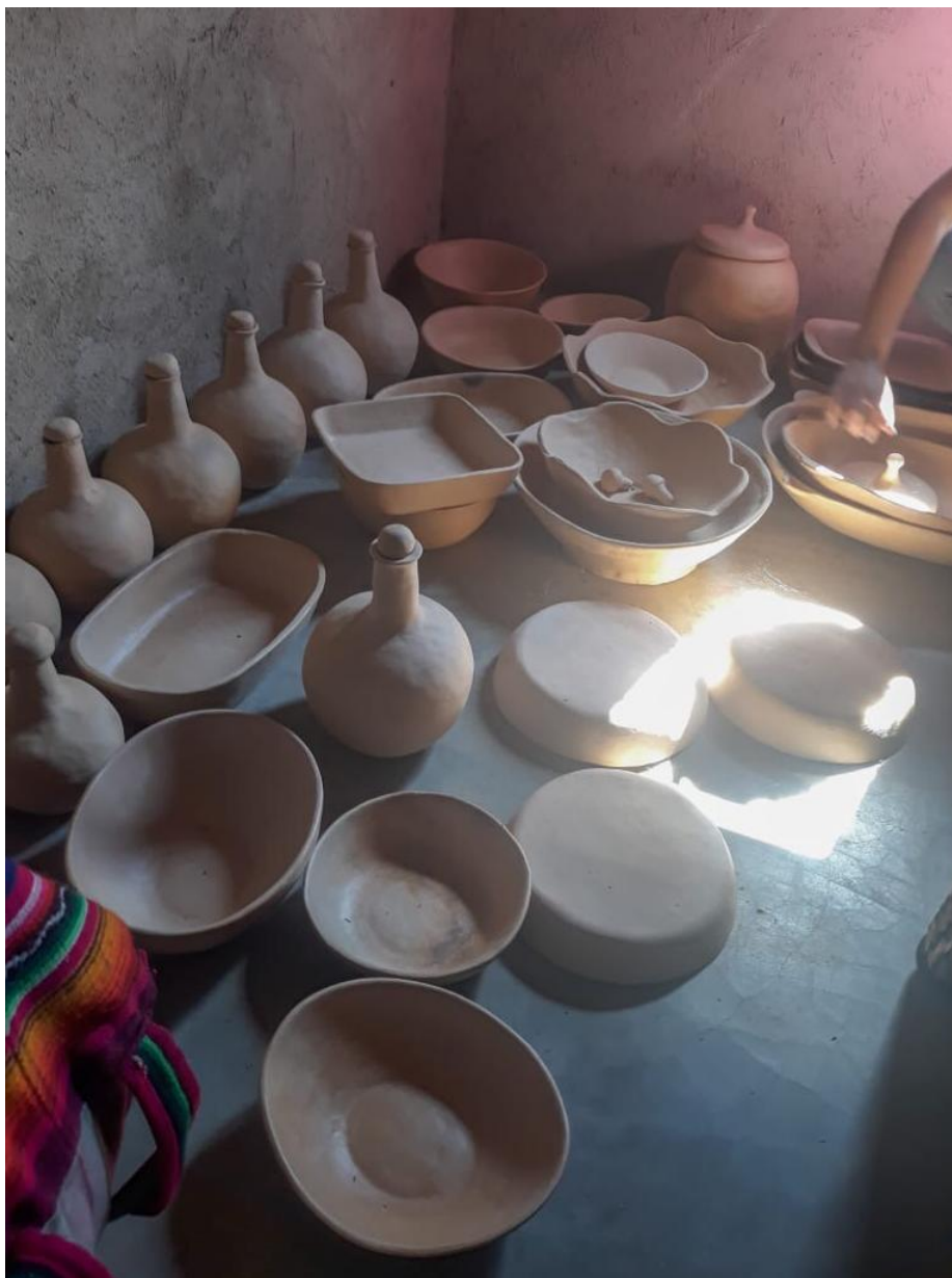
Figura 3 - Produção de artesanato de barro, Comunidade Kalunga, Núcleo Ema, Teresina de Goiás-GO.

Keywords: Agrarian Law. Modernity. Consultation and Prior, Free and Informed Consent. Quilombola Peoples. Consultation Protocols.