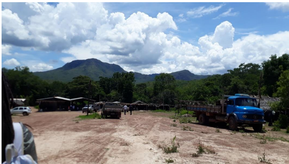
Figura 11 – Comunidade Kalunga, Núcleo Vão do Moleque, Cavalcante-GO.