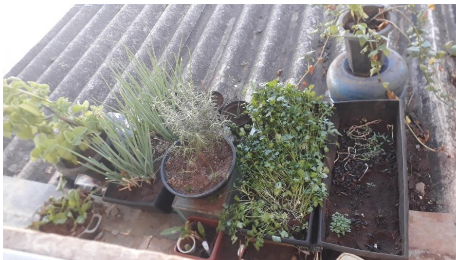
Figura 10 - Jardim de telhado, Representando a Inspiração da escrita, Residência da autora, Goiânia-GO

Todo esse conjunto possibilitou o início de uma nova caminhada, essa Dissertação representa uma semente que foi plantada e começa a crescer, já que vai se estender ao projeto que será desenvolvido no âmbito do Doutorado em Direito na Pontifícia Universidade Católica do Paraná, no qual a autora pretende pesquisar e viver os temas dos Povos, dos feminismos latino-americanos, do direito à alimentação e da agroecologia.