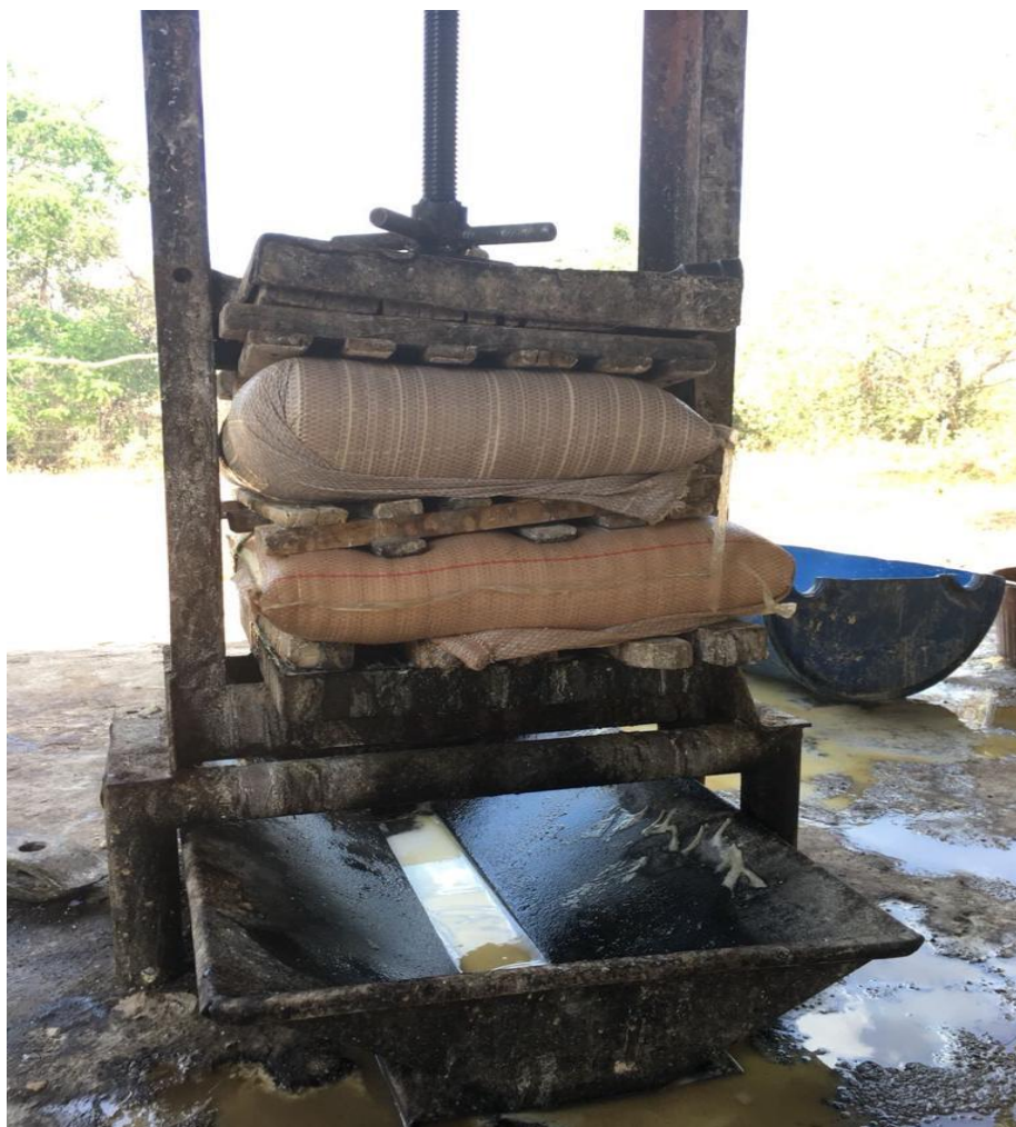
Figura 2 - Produção de farinha de mandioca, Comunidade Kalunga, Núcleo Diadema, Teresina de Goiás-GO.