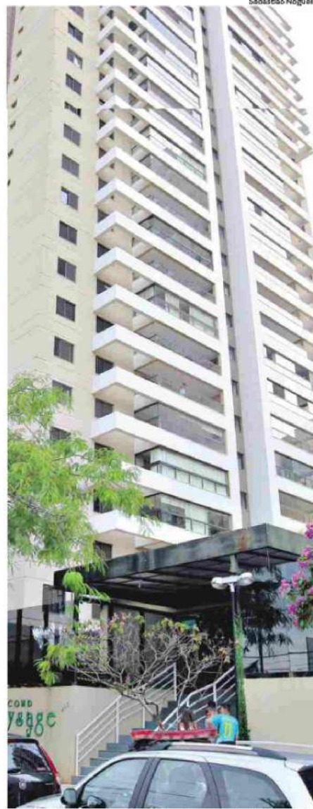
Prédio onde aconteceu o crime está localizado na Vila Alpes, na capital