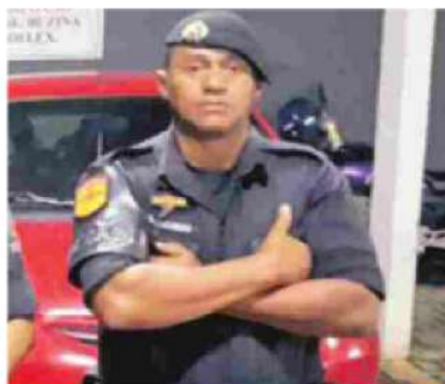
Policial da Rotam atirou no rosto da noiva e depois disparou contra a própria cabeça em distribuidora