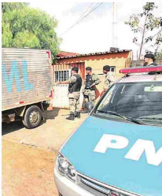
Viaturas do IML e da Polícia Civil em casa onde diarista morreu após incêndio no quarto