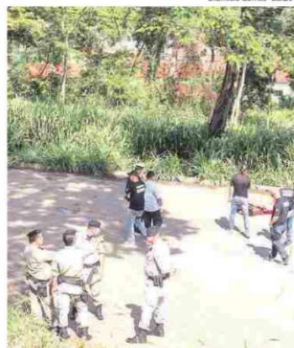
Policiais no local onde adolescentes foram assassinadas