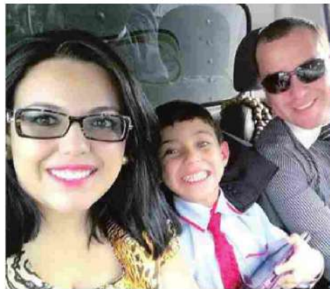
Casal estava junto havia cerca de 10 anos e tinha um filho de 6

NO CONDOMÍNIO ENA EMPRESA DA FAMÍLIA, VÍTIMAS ERAM CONHECIDAS COMO TERNAS, ATENCIOSAS, EDUCADAS E RESPEITOSAS