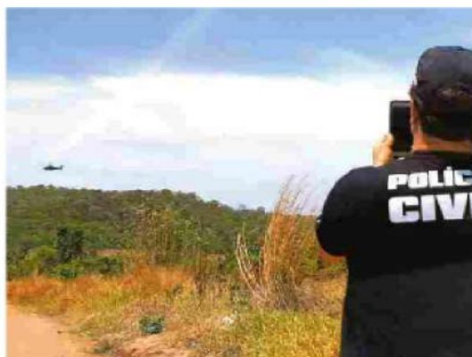
Policial observa local onde corpo foi encontrado na Serra das Areias