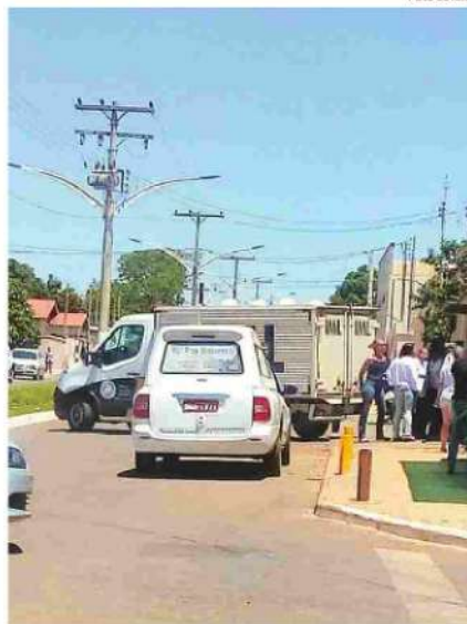
Viatura da IML faz a retirada do corpo de Caillane Marinho da casa