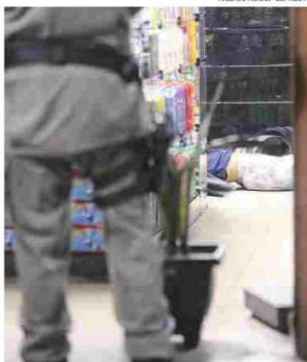
Corpo de jovem no chão de farmácia: execução