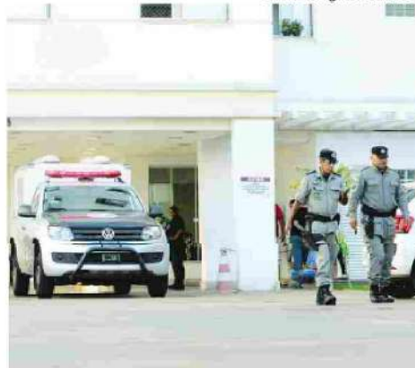
PMs no prédio onde os três corpos foram encontrados no sábado