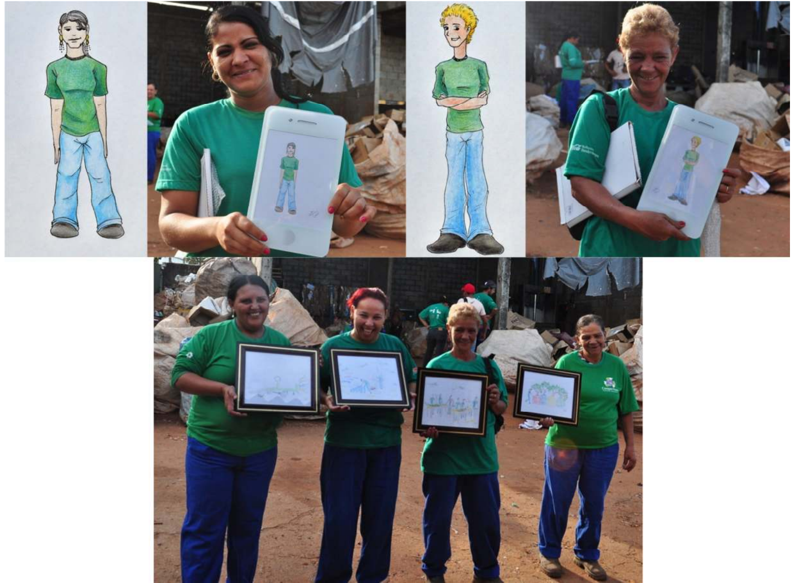
Registros dos presentes, 2015.