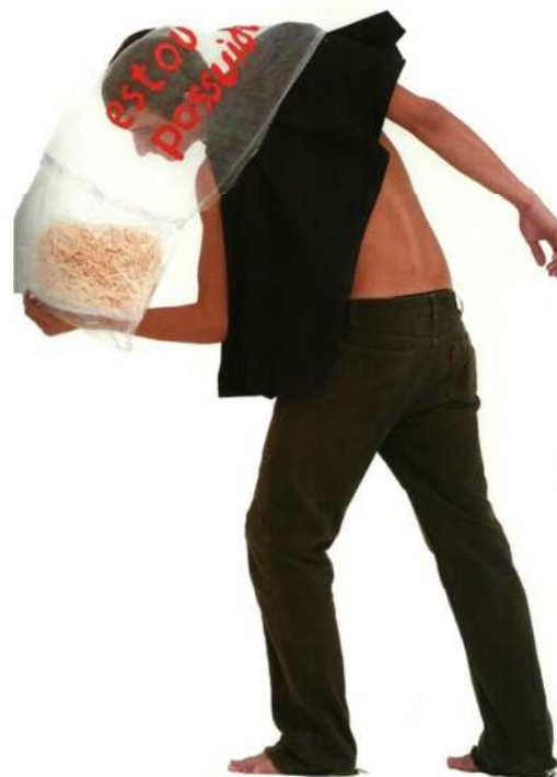
FIGURA 46 – OITICICA, Hélio. Parangolé P17 Capa 13 “ Estou Possuído ”, 1967.

participações realizadas em seus “Parangolés” (Figura 46) 26 – criados após um envolvimento do artista com a comunidade do Morro da Mangueira no final da década de 1960. Trata-se de tendas, estandartes, bandeiras e capas feitas para serem vestidas, que misturam elementos diversos como cor, dança, poesia e música, convergindo em uma manifestação cultural coletiva e performática (OITICICA, 2006).