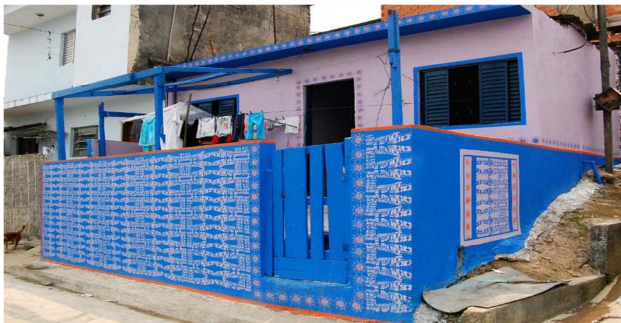
FIGURA 47 – NADOR, Mônica. Paredes Pinturas, 2009; Fonte: < http://www1.folha.uol.com.br/folha/ilustrada/ult90u493861.shtml >. Acesso em: Outubro de 2015.

dentro de comunidades periféricas. Um exemplo é o trabalho realizado no bairro Jardim Santo André, na região metropolitana de São Paulo, onde o seu projeto “Paredes Pinturas” (2009) modificou fachadas de mais de 30 casas, pintadas em conjunto com os moradores num ato de gastar as tintas onde realmente era necessário, trazendo a população da comunidade para próximo de discussões artísticas e coletivizando a autoria de um trabalho (Figura 47) 28 .