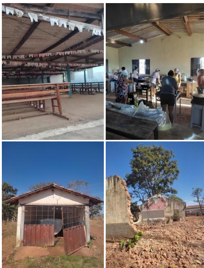
Figura 2: O arredor da Igreja de São José Operário (barracão e cantina acima, tanque de expansão e grupo demolido abaixo)

O grupo era uma sala de aula ampla, com quadro negro à frente, carteiras escolares, vitrôs do lado direito, uma área grande e espaçosa na entrada e uma cozinha com fogão à lenha num cômodo ao lado.