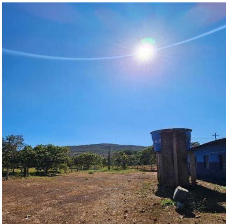
Figura 8: Vista frontal da Igreja de São José Operário