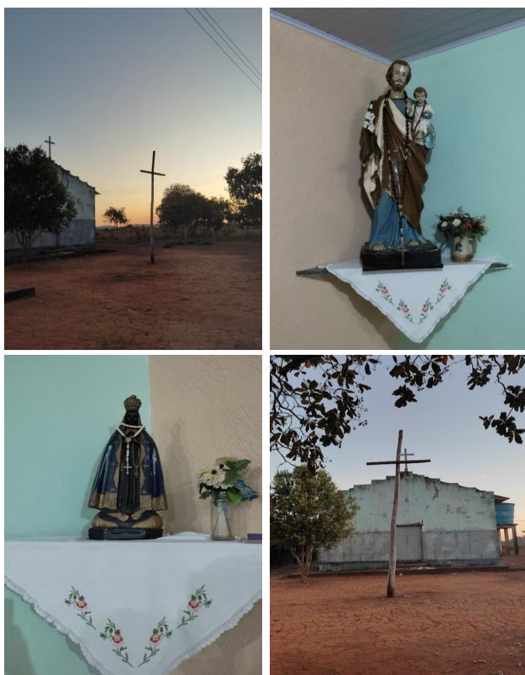
Figura 1: Igreja de São José Operário