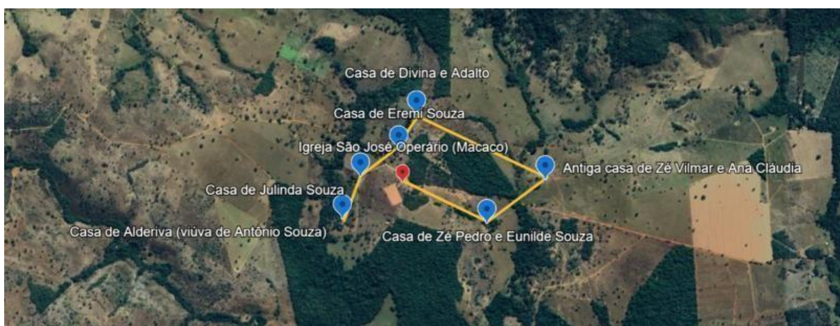
Figura 4: Local da pesquisa

Os moradores da comunidade do Macaco têm suas terras nos arredores da igreja de São José Operário, construída a muitas mãos por volta dos anos 1970. A igreja de São José