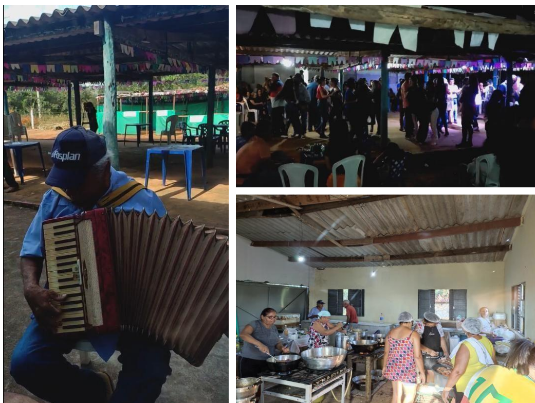
Figura 3: Festa em Louvor a São José Operário

A Festa em Louvor a São José Operário movimentava a comunidade inteira. Escolhia-se o festeiro e festeira da festa com um ano de antecedência. Vinha gente de tudo que é canto se juntar mais uma vez com os baianos, amigos antigos, ex-moradores, parentes que foram para a cidade. Durante o final de semana da festa, aconteciam as competições de truco, o campeonato de futebol com as comunidades vizinhas, as modas de viola e sanfona. Era chegar meados de abril para todo mundo se mobilizar na organização e preparativos da festa de barraquinha. Em 2025, a festa foi interrompida porque o pessoal que sobrou no Macaco já não tem mais condições de tocar a festa sozinhos e já nem veem mais motivos para festejar. Os velhos que sobraram no Macaco não estão com saúde suficiente para isso. É uma tradição que chega ao fim.