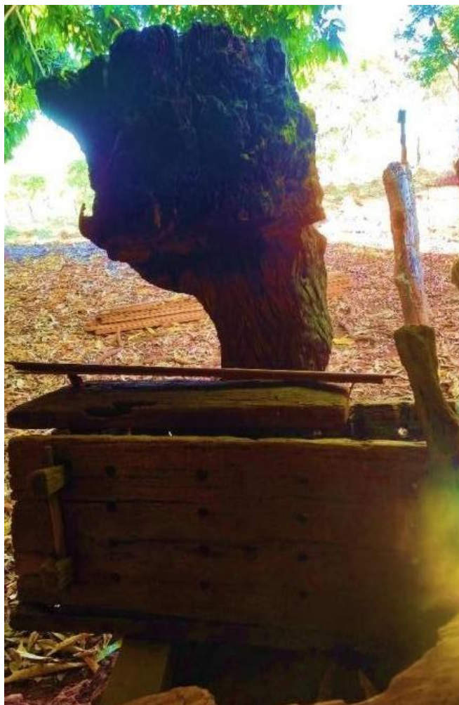
Figura 14 - Prensa para a secagem da mandioca