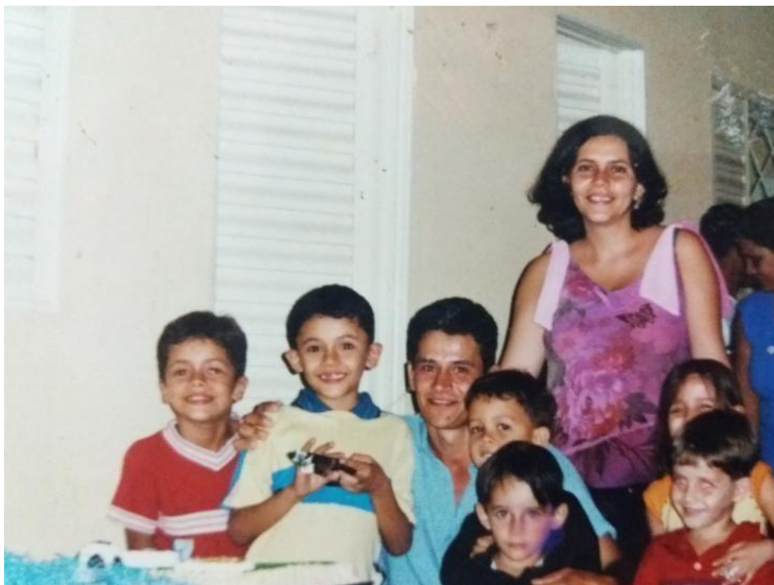
Figura 18: Registro das comemorações dos meus 7 anos

– Édouard Louis, Lutas e metamorfoses de uma mulher .