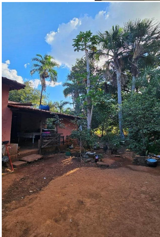
Figura 6 - Casa de Tiareta Fonte: Arquivo pessoal, 2023.