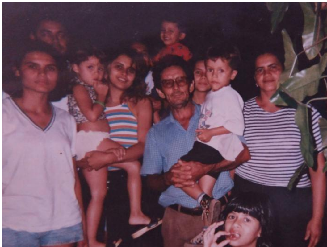
Figura 1: Meus avós, pais, tios, primos e eu

Em seu texto Existencial Sociolinguistics: The Fundamentals of the Political Legitimacy of Linguistic Minority Rights , David Balosa (ano) delinea a abordagem que chamou de “sociolinguística existencial”. Nele, o autor defende a indissociabilidade entre o tratamento da linguagem e o tratamento dos seres humanos, conclamando agentes públicos particulares para “transformar o tratamento discriminatório dados às línguas e aos povos minorizados em um tratamento de equidade e diversidade para a diversidade linguística e cultural, visando à dignidade humana” (Balosa, 2022, p. 148, tradução minha). Nesse sentido, a sociolinguística existencial se mostra comprometida com a legitimidade dos direitos das minorias linguísticas a partir da defesa intransponível da dignidade humana, ideia que o autor desenvolve com base na filosofia, ou seja, “articulando a dignidade humana como matriz para a análise das questões linguísticas e de avaliação da política e planejamento linguísticos em sociedades multiculturais/multilíngues” (Balosa, 2022, p. 153, tradução minha).