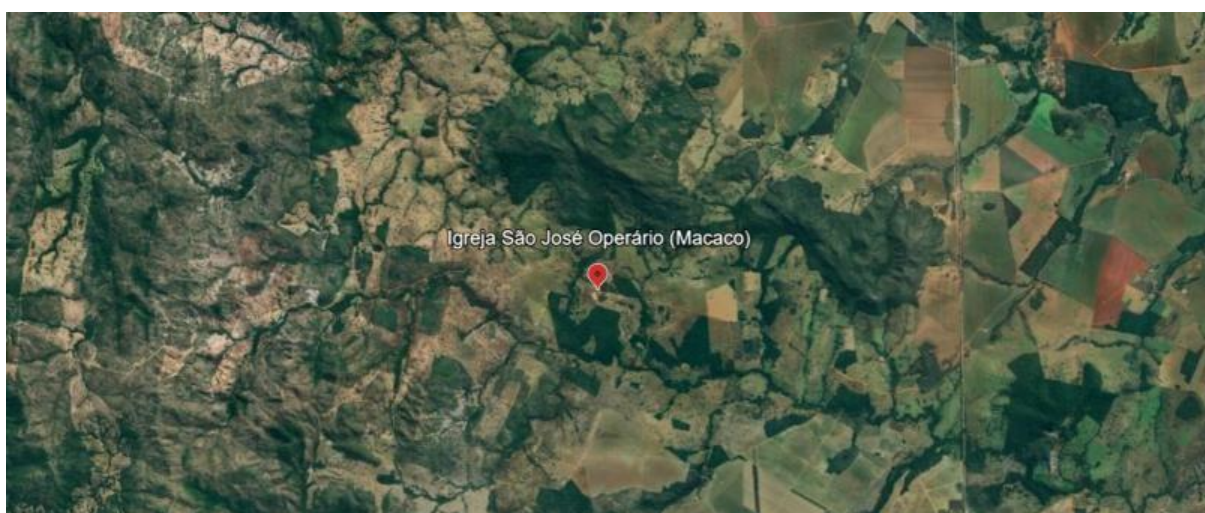
Figura 3: Vista aérea do Macaco e entorno

Jacaré ou Lages, Baianos, por ter com esta nomeação uma história íntima, pois foi nela que vivi dos sete aos catorze anos. Guimarães Rosa questiona seu leitor se “vê aonde é sertão? Beira dele, meio dele?” e penso no Macaco, nome que cresci ouvindo os dali dizerem ao se referirem à comunidade, formada por diferentes famílias que se entrelaçam aqui e acolá e que formam um mapa socio-diverso da região rural de Uruaçu, no Norte de Goiás. Era também no Macaco, na cachoeira, que eu e meus primos íamos nos refrescar sempre que um adulto pudesse nos acompanhar. Dessa forma, tenho com o nome algum vínculo afetivo, ainda que tenha consciência de que o Macaco pode ser entendido como uma área muito maior do que a delimitada para esta pesquisa.