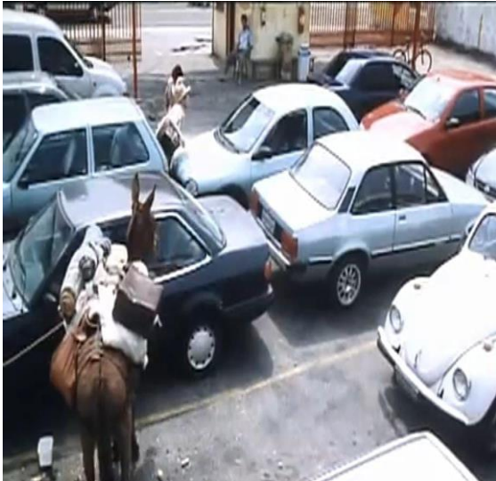
Figura 09: O engarrafamento