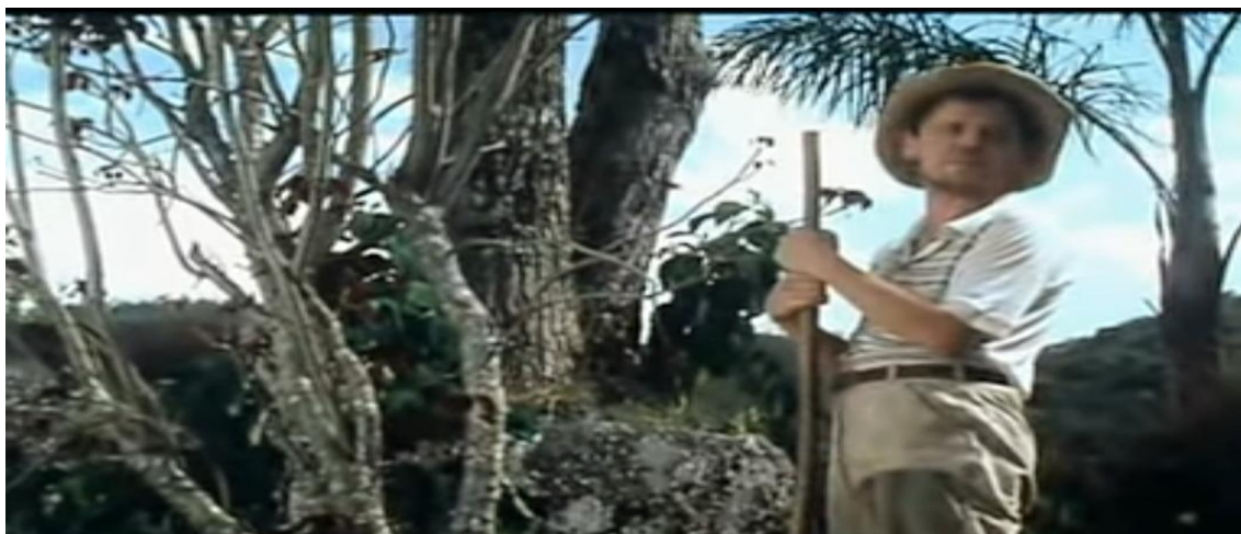
Figura 1: O olhar, o lamento e a esperança.