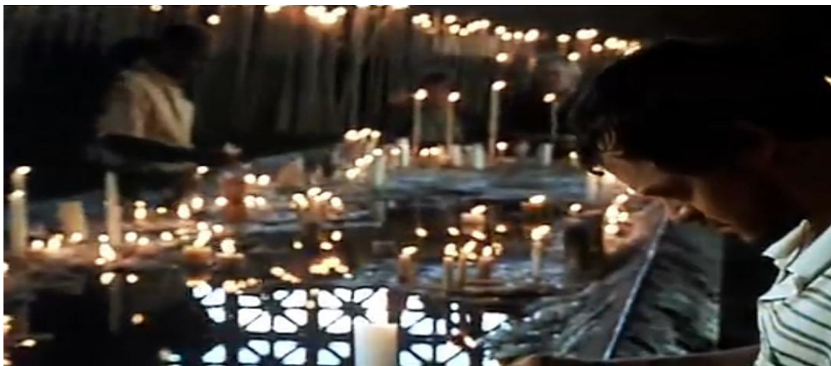
figura13: O fiel e a santa mãezinha

Todos os caminhos levam ao catolicismo, essa é uma das teses estéticas do filme Tapete Vermelho . Sua cidade cinematográfica tem a igreja católica no centro, que providencia a cura e as respostas. A santa concede providências (figura 13), o aconchego da mãe acalma o coração do filho desesperado. O pedido por intercessão vem junto com uma nova promessa. Quinzinho promete voltar e entregar sua viola ao santuário como forma de pagamento da dívida. O destino, a sina e o fatalismo marcam o cristianismo popular.