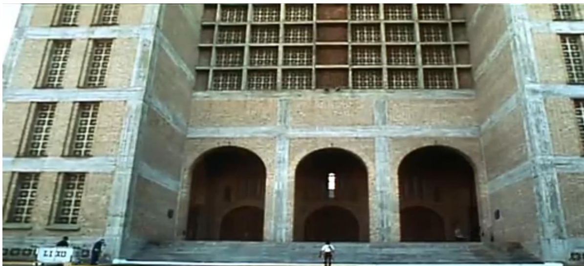
Figura 12: O fiel e a igreja

intercedido pelo viajante em outros momentos, como no filme O Auto da Compadecida , dirigido por Guel Arraes.