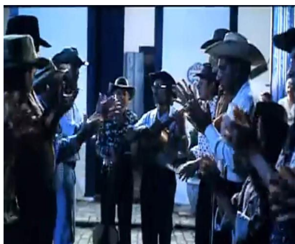
Figura 06: A catira