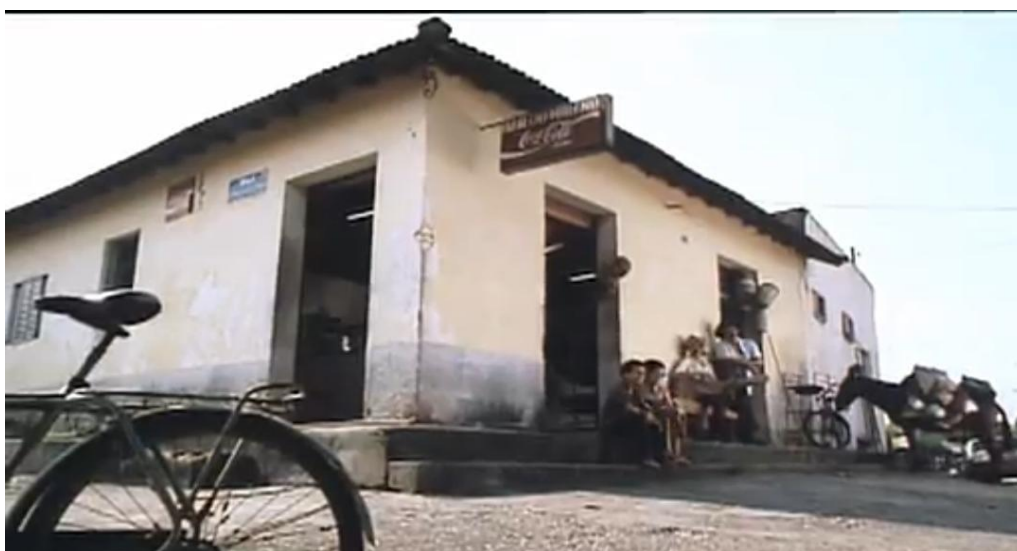
Figura 11: O armazém da memória

O armazém, o comércio é depósito de memórias, é um oráculo do passado. O armazém opõe-se ao shopping. Apresenta-se, no filme (Figura 11), como ponto de encontro, lugar de parada e busca de orientação. Todas as respostas são obtidas no armazém. As prateleiras dos armazéns possuem lembranças miúdas, secas ou molhadas. São nesses lugares que encontramos o fumo de rolo, corda de bacalhau, botina, querosene e o litro de mel. Esses armazéns, também, conhecidos como vendas, são vistos nas roças. A caderneta anota a dívida do mantimento. Os balcões separam o comerciante e o freguês. O rádio chia músicas antigas, talvez o passado resmungue naquele chiado, e os chegantes apoiam-se com leve inclinação sobre a superfície. Ali contam histórias, pedem informações e tomam as doses de pinga.