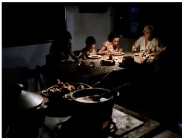
Figura 2: O pouso e a prosa