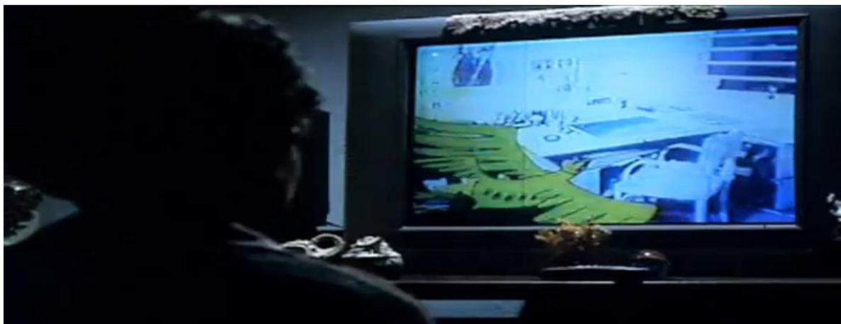
Figura 08: A janela e o pássaro