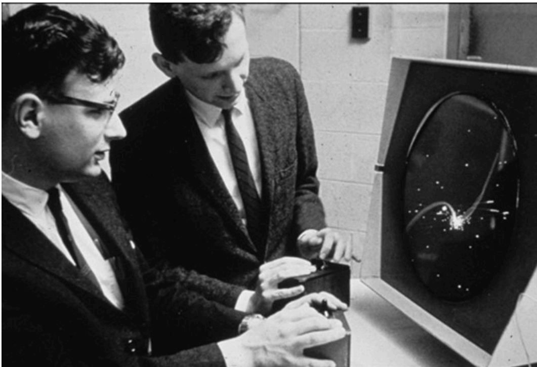
Figura 3 - Inicialmente concebido por Steve Russell, Martin Graetz e Wayne Wiitanen em 1961, Spacewar! é considerado um dos primeiros videogames para um computador digital” Disponível em:

Os jogos de guerra no espaço daquele período, certamente foram influenciados pela corrida espacial, bem como a polarização política da Guerra Fria. O que proporcionou em um conflito representado nos primeiros jogos no espaço. Em razão disso, o Spacewar! foi um jogo desenvolvido em 1961-1962 por Steve Russell com auxílio de outros cientistas colaboradores do Instituto de Pesquisa de Massachusetts (MIT), com base em progressos técnicos hackers anteriores, promoveram avanços significativos no desenvolvimento dos jogos eletrônicos executados em osciloscópios e computadores mainframes PDP-1 (Woodcock, 2019).