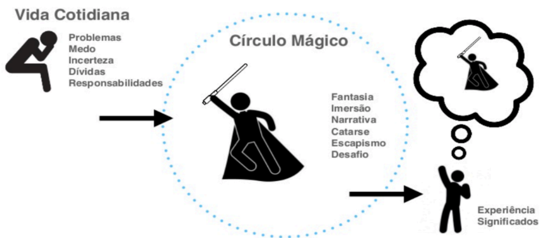
Figura 1. O círculo mágico.

Os jogos possuem significados que permeiam as esferas em todos os campos da vida social e cultural, em que um jogo acontece em suas dimensões circunscrita por normas, criatividade, cooperação, competitividade e a busca pela estética lúdica pelo qual Huizinga (2019) chamou de “círculo mágico”.