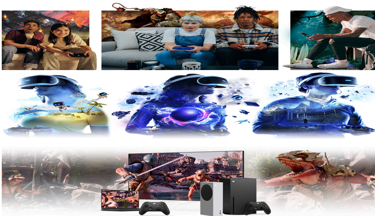
Figura 2 - As imagens retratam a interação com inúmeros computadores e consoles, bem como periféricos acessórios de comando e captação de audiovisual. Disponível em: https://www.xbox.com/pt-br/games/xbox-play-anywhere?icid=Cat-Xbox-CP2-R3-Play_Anywhere e

Essa relação é sustentada por estímulos sensoriais e cognitivos que orientam as ações dos jogadores e determinam a jogabilidade, isto é, o modo como se interage com as mecânicas, narrativas e ambientes virtuais (Chen, 2016; Esposito, 2005). A mecânica de um jogo equivale aos comandos que são dados por um controle que concede movimento aos avatares e objetos projetados nas telas, de tal modo que, por exemplo, é o comando para fazer o Mário pular, ou comando de movimentação de mira em um jogo de tiro e entre outros.