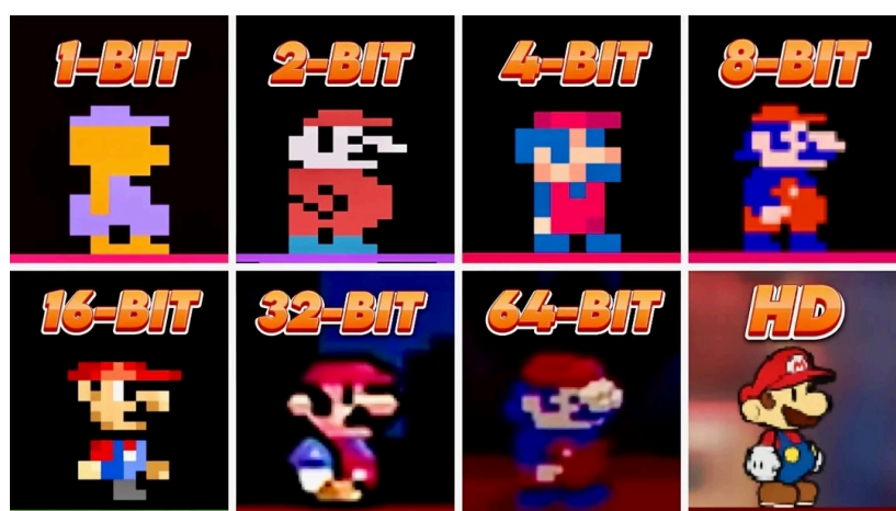
Figura 5. Representação comparativa de sprites digitais classificados por profundidade de bits (1-bit, 2-bit, 4-bit e 8-bit), ilustrando a discussão sobre a real profundidade gráfica dos chamados “pets 8-bit” no jogo Neopets. Fonte: Reddit (r/neopets), 2023. Link disponível:

Sobre as transformações gráficas dos jogos eletrônicos, o avanço tecnológico tem produzido aquilo que pode ser compreendido como um verdadeiro espetáculo da técnica, proporcionando aos consumidores experiências cada vez mais realistas, tanto em termos de qualidade visual quanto de efeitos sonoros. Nesse contexto, a representação da violência passou a ocorrer em jogos que apresentam elevado nível de detalhamento gráfico, com maior precisão de cores, iluminação e texturas, o que contribui para a intensificação da sensação de realismo. Essa experiência contrasta significativamente com as primeiras gerações de jogos digitais, marcadas por gráficos pixelados e limitados aos sistemas de 4 e 8 bits . A exemplificação desse contraste pode ser observada na figura a seguir: