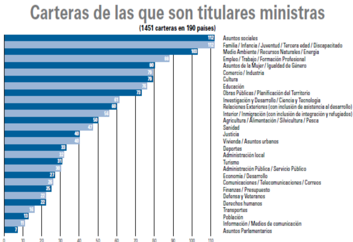
FIGURA 1. PASTAS COM TITULARES MINISTRAS