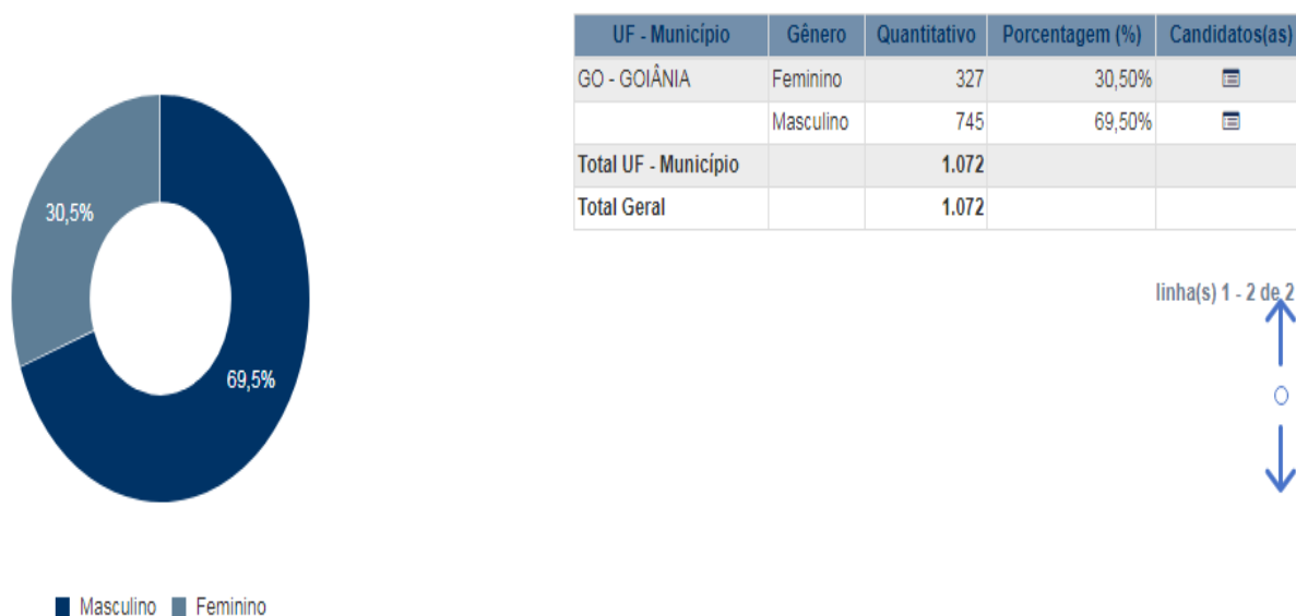
Figura 3 Candidaturas Gerais em Goiânia nas eleições de 2020

Conforme os dados do Tribunal Superior Eleitoral (TSE), nas eleições de 2020 em Goiânia, tanto ao cargo de prefeito quanto de vereador as candidaturas femininas não ultrapassaram o limite determinado pela legislação, como se vê no gráfico abaixo: