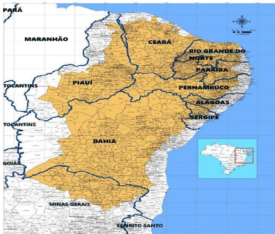
Polígono das secas Fonte: CARVALHO (2006).

Durval Muniz de Albuquerque Júnior (2021) analisa a construção da ideia de sertão no Brasil, destacando que, em 1969, o IBGE reconheceu o Nordeste como o único sertão do país. Esse reconhecimento é problemático, pois ignora semelhanças de outras regiões brasileiras com o Nordeste, além de refletir a visão histórica da marcha para o Oeste, onde a região era vista como "desbravada" e oposta ao litoral. O autor também observa que o sertão é frequentemente percebido como algo do passado,