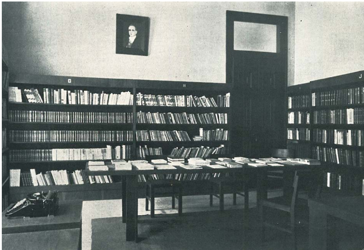
Foto de uma das salas de leitura do Instituto de Estudos Brasileiros, nas estantes os livros oferecidos pelo Brasil na ocasião do Duplo Centenário.