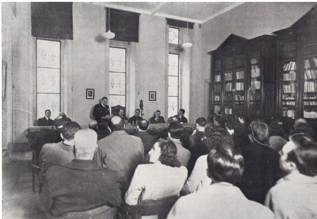
Foto de uma sessão do Instituto de Estudos Brasileiros em 22 de Janeiro de 1943.