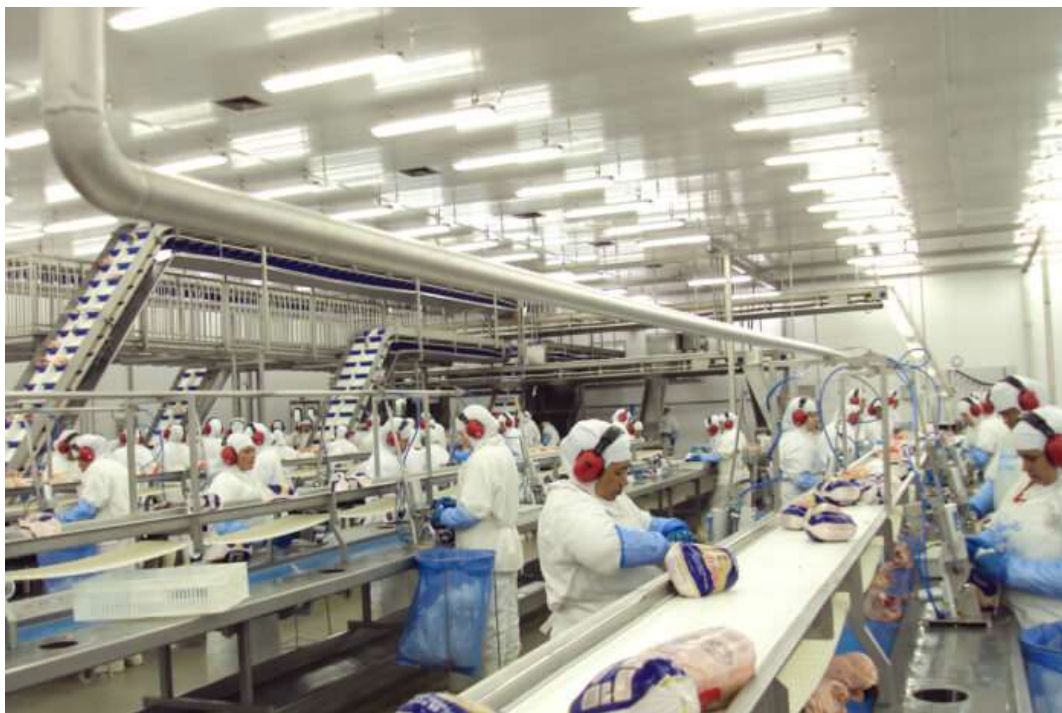
Figura 3: Linha de produção