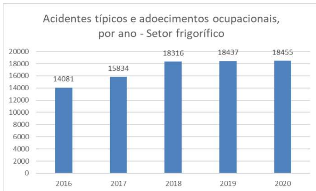
Tabela 4: Acidentes típicos e adoecimentos ocupacionais no setor frigorífico

Fonte: Comunicações de Acidentes de Trabalho (CAT)