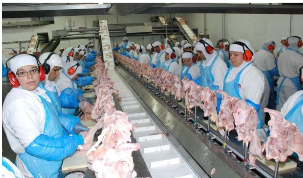
Figura 2: Linha de produção: setor de corte

Em 2011, a ONG Repórter Brasil expôs as condições de trabalho nos frigoríficos por meio do documentário Carne e Osso e o Caderno Temático Moendo Gente. O caráter de denúncia das duas obras nos revela a realidade da agroindústria do frio, e uma das características que nos chama a atenção é o papel da mulher trabalhadora rural nestes locais. Observa-se que as mulheres laboram em locais estratégicos da linha de produção, quais sejam: setores conduzidos por esteiras mecânicas e/ou correntes cujas atividades concentram-se na desossa, cortes e embalagens, como podemos observar abaixo: