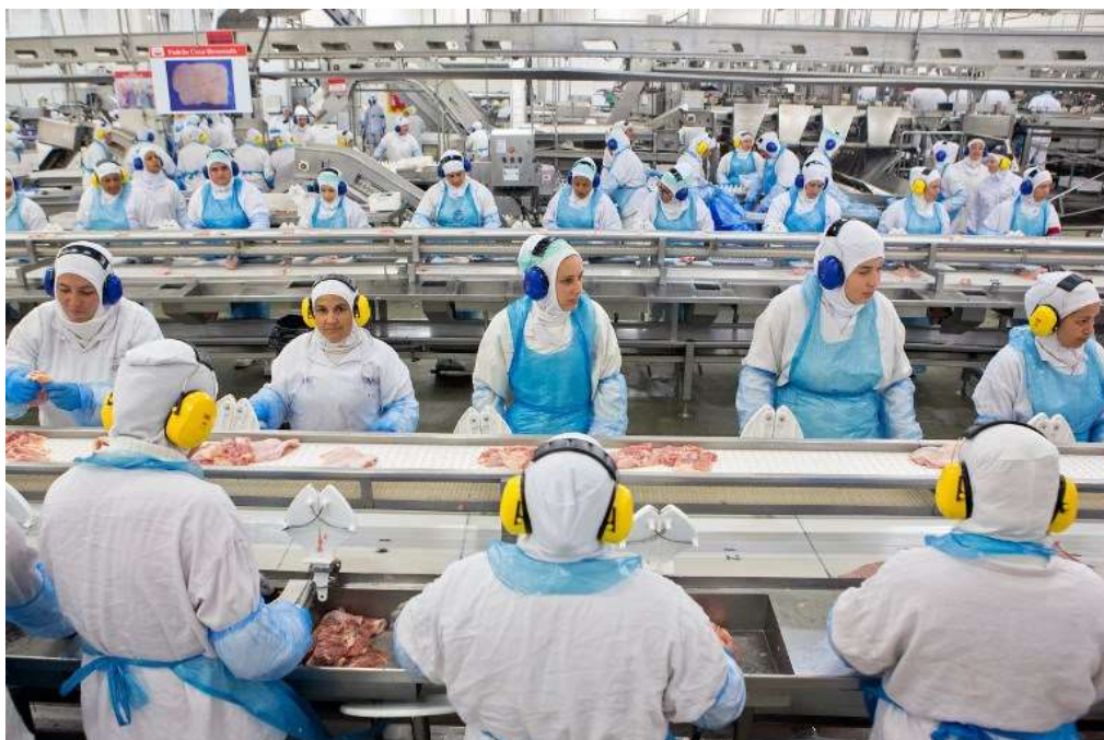
Figura 1 Linha de produção: setor de desossa