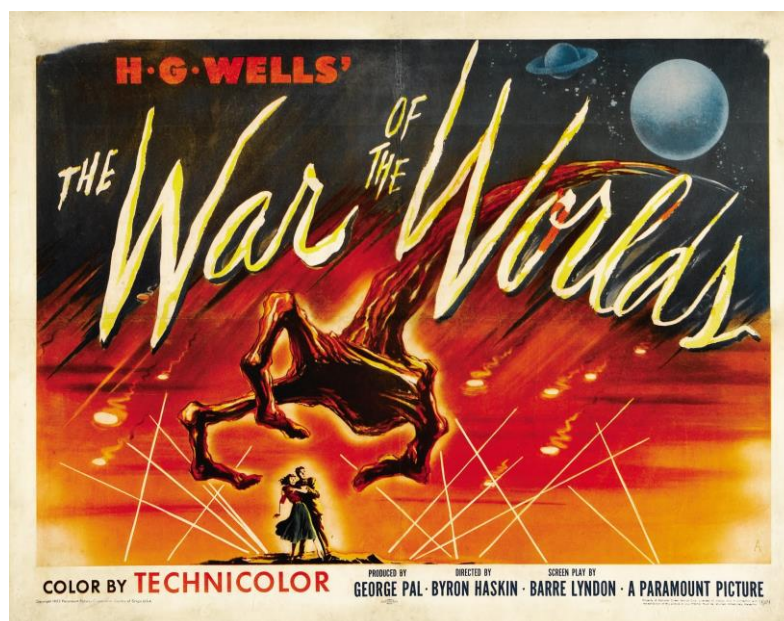
Figura 2 – Cartaz de The War of the Worlds

No entanto, essa não foi a única razão para manter os marcianos como invasores, igual à história original. Eles tornaram-se metáfora para comunistas soviéticos, de acordo com Ortiz (2012). As referências ao Planeta Vermelho começam no cartaz produzido (Figura 2) para a divulgação de The War of the Worlds (1953), onde se observa a mão vermelha do alienígena. Em 2014, Tom Whalen, artista norte-americano, criou um cartaz para uma edição limitada do filme (Figura 3), que mostra Marte próximo à Terra.