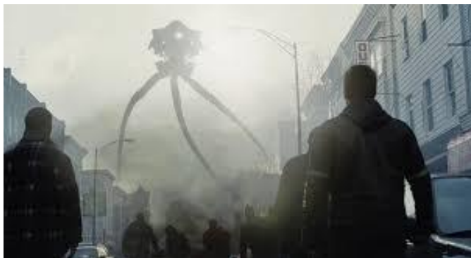
Figura 1 – Tripods de 150 pés de altura