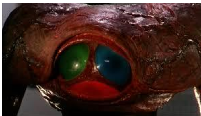
Figura 4 – Olhos do marciano em tecnologia RGB