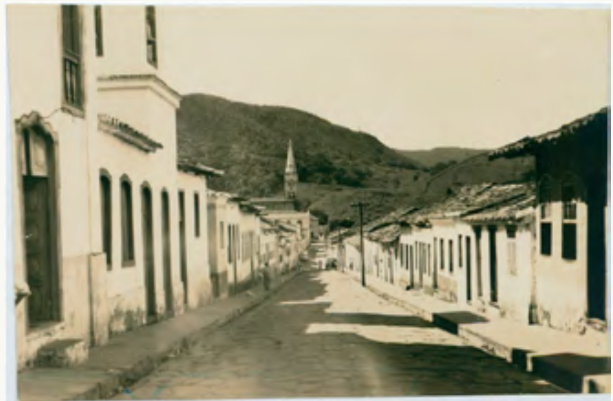
Figura 2 — Rua da Abadia, em Goiás, no século XX.

Nesse contexto, observamos um primeiro deslocamento de José J. Veiga. É importante destacar que esse tipo de movimento acontece em mais de um momento da vida do escritor e que estes acontecimentos serão pontuados ao longo deste trabalho. Portanto, quando Veiga sai da pequena Corumbá em direção a Goiás (Figura 2), aos doze anos, em 1927, o menino realizava uma mudança muito comum para diversos moradores rurais da época que iam em direção às capitais e aos grandes centros urbanos. Naquele ano, a cidade que o recebeu era ainda a capital do Estado de Goiás e concentrava, além dos poderes administrativos, novas oportunidades de estudo para Veiga que, à época, já se interessava pela literatura.