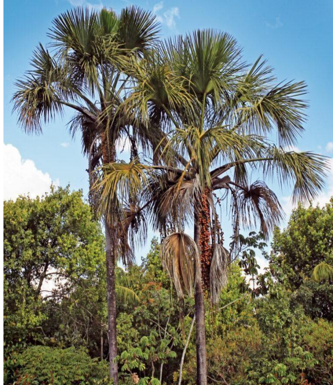
Fig. 3: A árvore da vida cerradeira.

A buritirana, nome pelo qual a fruta da árvore apresentada na Fig. 3 é chamada na região onde nasci e cresci, é também conhecida como palmeira, uma planta originária da América do Sul, no Brasil, presente em quase todos os estados brasileiros, incluindo a região sudeste Tocantins, onde está situado o município de Conceição do Tocantins.