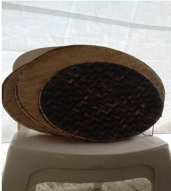
Fig. 1: Celeiro cerradeiro da Vida. foto tirada de quibanos a partir do trabalho de artesanato da Associação Quilombola Urbana João Borges Vieira da cidade de Uruaçu.