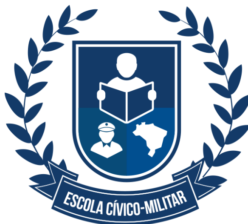
Figura 3 Brasão do PECIM