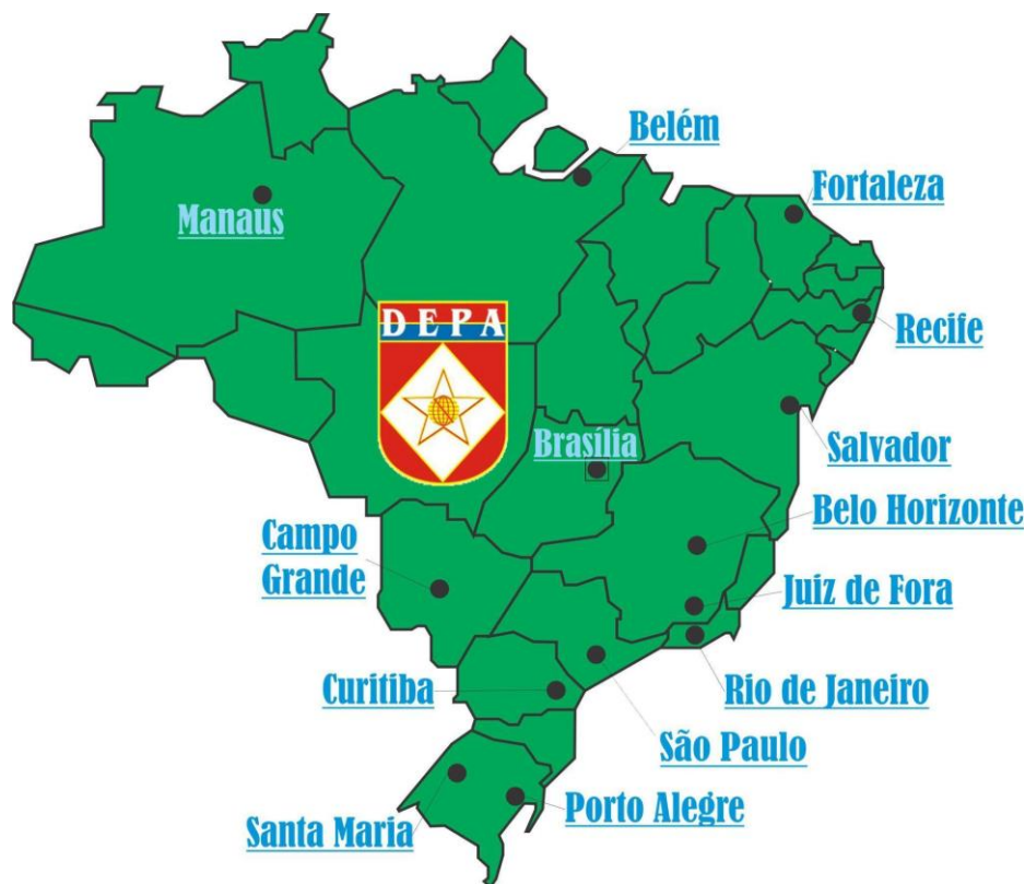
Figura 1 Mapa da distribuição geográfica de colégios pertencentes ao Sistema de Colégios Militar do Brasil