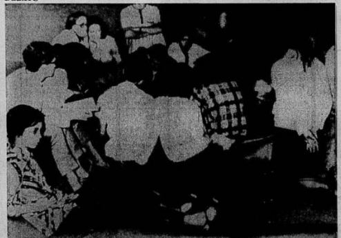
Os alunos da Universidade de Brasília debateram no Congresso a invação do campus universitário