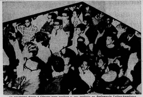
Os estudantes foram à Câmara para explicar o seu protesto ao Parlamento Latino-Americano