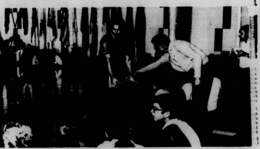
Estudantes brasileiros no Congresso desde a manhã de ontem, aguardando a sessão plenária do PLA.