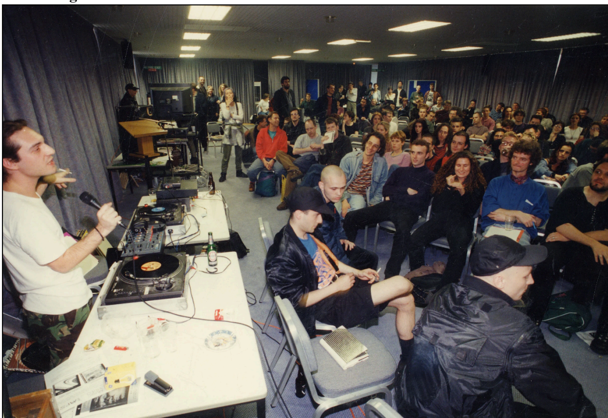
Figura 1 — Atividade no “Panorama Hall” durante a Virtual Futures 95